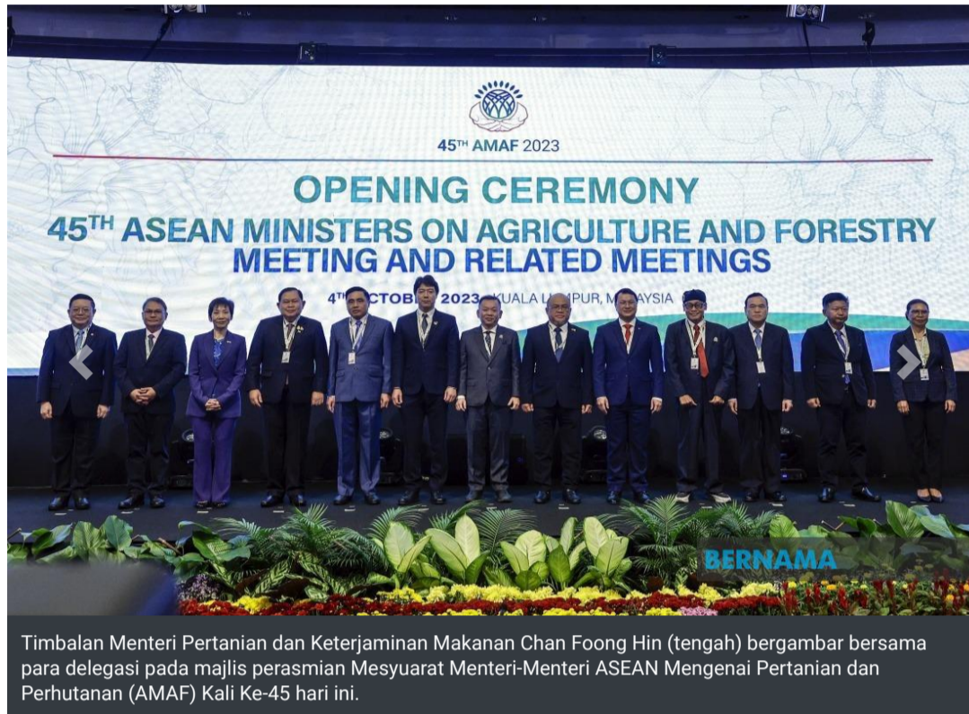
Timbalan Menteri Pertanian dan Keterjaminan Makanan Chan Foong Hin (tengah) bergambar bersama para delegasi pada majlis perasmian Mesyuarat Menteri-Menteri ASEAN Mengenai Pertanian dan Perhutanan (AMAF) Kali Ke-45 hari ini.