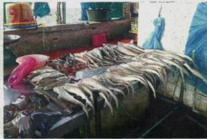
Cause for concern: Sharks being sold at a market in Sabah.

Provision of education and socialising programmes for the fishing industry, local communities and enforcers in order to avoid accidental capture, consumption and trade of the listed species are also important, he said.