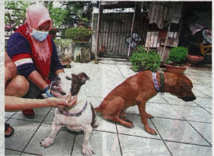
A veterinary department officer vaccinating pet dogs following a rabies outbreak in Taman Sri Kota Phase 2, Taiping.