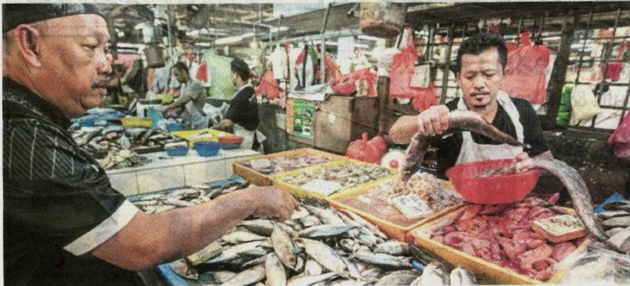
HARGA ikan di pasaran kini turun.

Kuala Lumpur: Harga ikan di pasaran kini turun antara RM3 dan RM6 sekilogram sejak dua hari lalu berikutan larangan Lembaga Kemajuan Ikan Malaysia (LKIM) mengeksport ikan ke luar negara selain faktor perubahan cuaca serta angin yang bertambah baik.