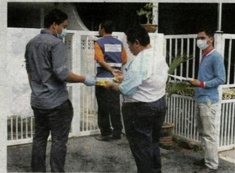
Kakitangan JPV Perak menjalankan pemeriksaan ke atas setiap rumah pemilik anjing di Pokok Assam, Taiping sejak kelmarin.

"KKM dan Jabatan Kesihatan Negeri Perak komited dan akan terus mempertingkatkan kerjasama dengan kerajaan Perak, JPV Malaysia serta agensi-agensi lain bagi memastikan langkah-langkah pencegahan dan kawalan jangkitan rabies dilaksanakan secara menyeluruh," katanya.