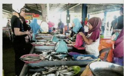
PENIAGA ikan di Seberang Kota, Kuala Kedah menjual beberapa jenis ikan saja berikutan bekalananya berkurangan.