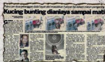
KERATAN Kosmo! 13 September 2018.

sepatutnya terhadap seekor kucing di premis Dobi Queen Self Service Laundry, Taman Gombak Ria antara pukul 12.54 tengah malam hingga 1 pagi pada 11 September 2018.