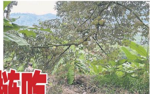
榴梿出口商以采用液氮冷冻技术将榴梿进行90度冷冻，使顾客365天都可以吃到榴梿。(档案照)