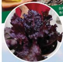
以正能量绿色科技种出来的沙拉 (salad) 蔬菜特别爽口可口。

【檳城17日讯】白世音光博近年来在国际农业界声誉日隆，掀起了绿色科技的新纪元，非但引起农耕社会的莫大关注，也让她在国际舞台上一次又一次的赢得赞许，获得奖项连连。