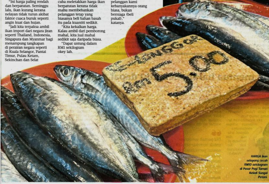
HARGA ikan selayang cecah RM10 sekilogram di Pasar Pagi Taman Keladi Sungai Petani.