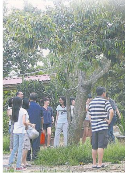
打造西彭成游客前来“玩山水、吃榴梿”的好地方。(档案照)

罗龙年表示,2020年是马来西亚旅游年,马来西亚旅游促进局及彭亨旅游局,已开始推广西彭旅游,去年12月初马来西亚旅游促进局更带领媒体及部落客访问文冬,展开宣传西彭旅游的工作。