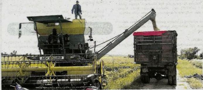
Hasil pengeluaran padi merosot teruk.

BPB ini menyebabkan daun dan tangkai pokok padi rosak, terdapat kesan warna bintik perang dan buah padi terencat. Saya hanya memperoleh purata pengeluaran hasil enam tan metrik" - Johari