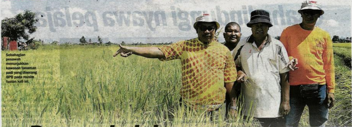
Sebahagian pesawah menunjukkan kawasan tanaman padi yang diserang BPB pada musim tuaian kali ini.

15 HUBUNGI OKLAH SABAK BERNAM: MOHD IZZATUL IZUAN - 019-2650821 / 019 6680275