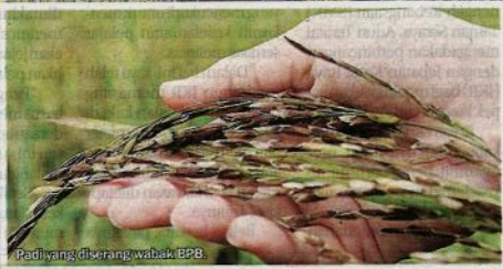
Padi yang diserang wabak BPB.