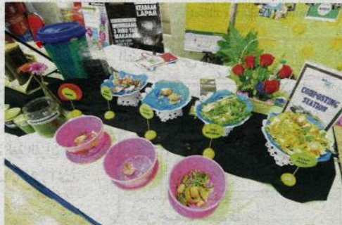
SISA makanan yang dibuang sepatutnya dikitar semula untuk dijadikan bahan berguna.