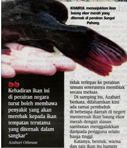
KHAIRUL menunjukkan ikan baung ekor merah yang diternak di perairan Sungai Pahang.

“Kehadiran ikan ini di perairan negara turut boleh membawa penyakit yang akan merebak kepada ikan tempatan terutama yang diternak dalam sangkar” Azahari Othman