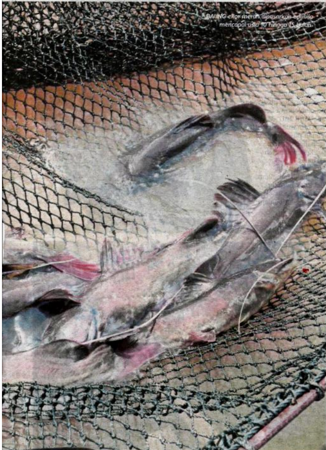
BAUNG ekor merah dipasarkan apabila mencapai usia 10 hingga 15 bulan.