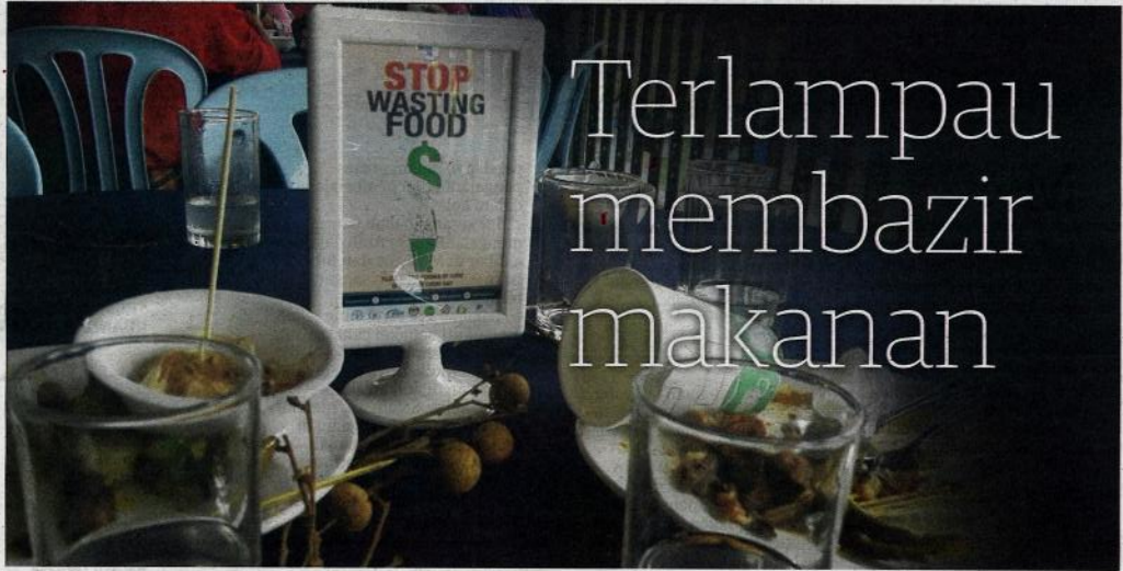
SANGGUPKAH kita terus melihat makanan dibazirkan setiap kali ada kenduri atau majlis?

Walaupun sisa makanan mampu terbiodegradasi secara semula jadi tidak seperti plastik atau komponen sisa pepejal lain, namun proses tersebut mengambil masa beberapa bulan dan akan melibatkan pengeluaran gas rumah hijau yang banyak dan berterusan dan mengancam alam sekitar. Pengeluaran gas rumah hijau juga akan mengakibatkan perubahan cuaca dan mengancam