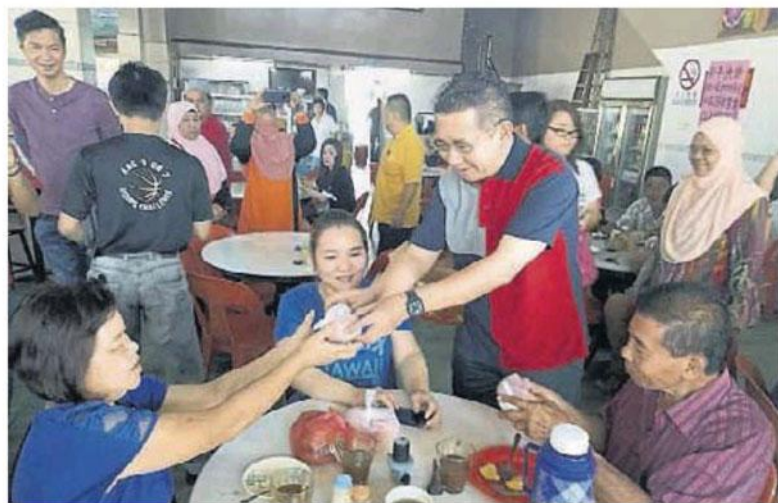
■沙拉胡丁阿育（站者）派年柑给民众，并与民众在小贩中心共享早餐，展现亲民一面。

他指出，今日派柑活动上，除了给选民送上新春祝福，也不忘聆听和收集居民面对的民生问题，以协助解决。