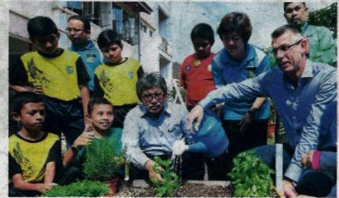
PROGRAM Kebun Dapur yang dianjurkan oleh MARDI bersama pelajar dengan kerjasama sebuah pasar raya besar membantu menerapkan kempen My Savefood

Bukan itu sahaja, Kementerian Kesihatan juga turut menyertai program berkenaan bagi mendidik pelajar untuk mengambil makanan secara sihat melalui Kempen Susu-Suku Separuh. Program Kebun Dapur ini merupakan satu model lengkap mendidik generasi muda mengenai menghargai makanan dan elakkan membazir serta membentuk amalan