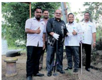
Timbalan Menteri Industri Utama, Datuk Seri Shamsul Iskandar Mohd Akin (tengah) menaman pokok roselle dalam lawatannya di Rembau.