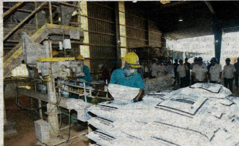
SALAH seorang pekerja sedang melakukan kerja-kerja menyusun baja sewaktu lawatan Amiruddin di kilang MNFSB di Gurun semalam.

“Ini (tender terus) antara isu yang sedang dibincangkan, maknanya bukan tidak ada langsung