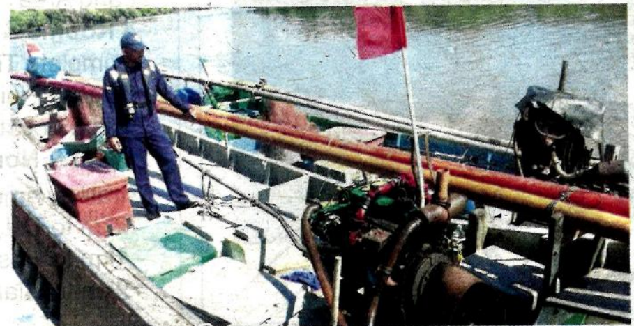
ANGGOTA APMM melihat dua bot nelayan yang ditahan kerana menggunakan pukat rawa sorong di perairan Yan semalam.

Tambahnya, ketiga-tiga bot itu dibawa ke Jeti Zon Maritim Kuala Kedah untuk tindakan lanjut mengikut Seksyen 8(b) Akta Perikanan 1985.