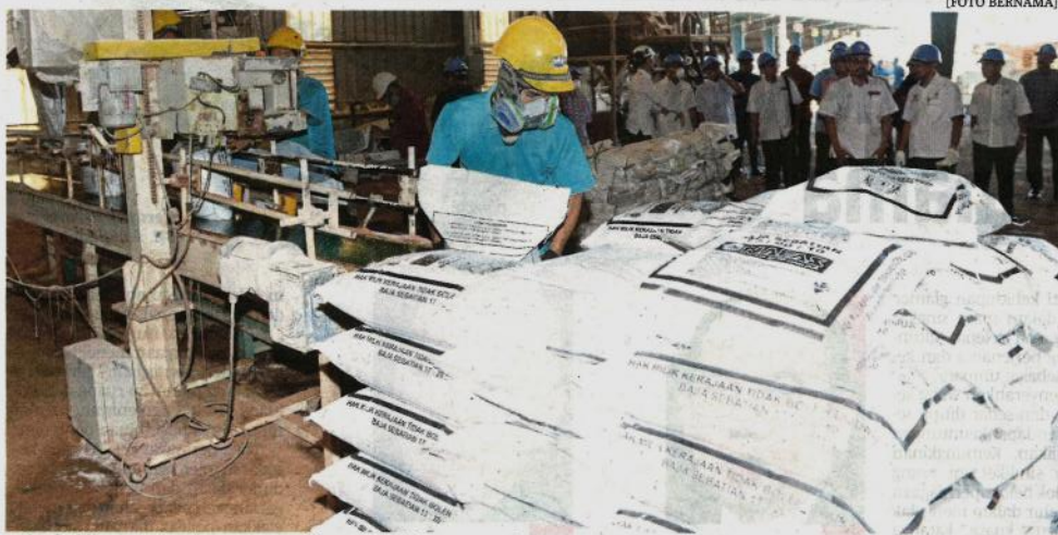
Pekerja kilang Malaysian NPK Fertilizer Sdn Bhd menyusun baja yang siap dibungkus di Gurun, semalam.