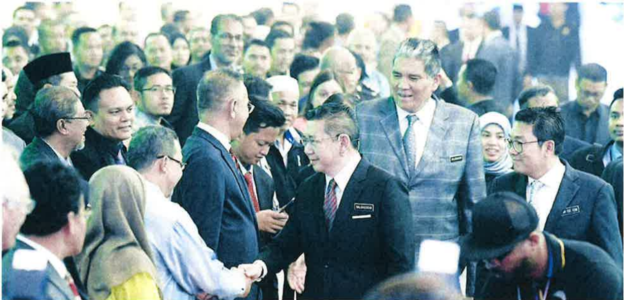
MENTERI Pertanian dan Industri Asas Tani Datuk Salahuddin Ayub (tengah) bersalaman dengan tetamu pada Majlis Pelancaran Hala Tuju Kementerian Pertanian Industri Asas Tani 'Prioriti dan Strategi 2019 hingga 2020' di Taman Ekspo Pertanian Malaysia (MAEPS) baru-baru ini.