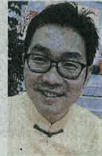
沈志勤：大马已与中国签署榴槤合作协议。