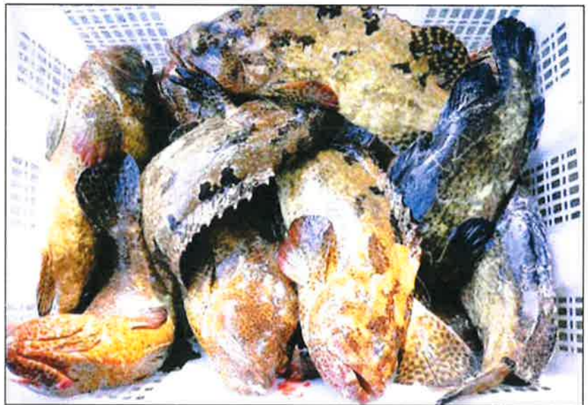
港船每月前来槟州收购近300吨斑类鱼。

他解释，香港渔船是困在我国执法单位的3个条件中，尤其是商船注册这项，因他们不是我国的渔船，要如何在我国注册或第