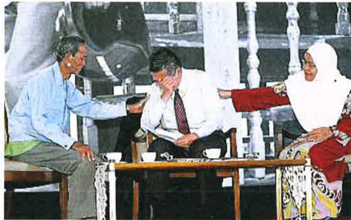
农长沙拉胡丁（中）在推介部门方向蓝图时，在开幕表演环节上，阅读农民代表伊巴斯所写的农民困境陈情书时，一时难掩悲伤情绪，当场落泪。图示其夫人法蒂玛和伊巴斯看到部长掩面掉泪，马上给予安慰。

（沙登14日讯）农业及农基工业部长沙拉胡丁今日在推介部门方向蓝图的仪式上，在阅读农民呈上的陈情书后，难掩悲伤情绪，当场洒泪。