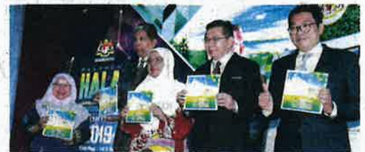
SALAHUDDIN Ayub (dua dari kanan) menunjukkan buku 'Prioriti dan Strategi 2019 hingga 2020' yang dilancarkan di Serdang, Selangor semalam.

"Untuk hala tuju kedua, kementerian akan merancang penglibatan pelaburan swasta dalam pertanian secara komer-