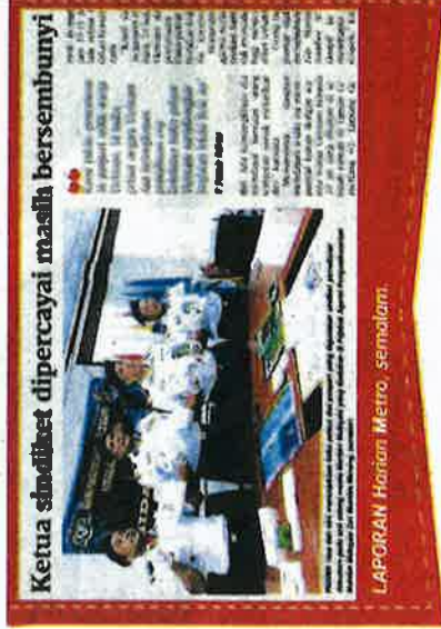
LAPORAN Harian Metro, semalam

"Dengan bantuan orang tengah, proses mendapatkan buku pelaut palsu menjadi lebih mudah apatah lagi mempunyai cap ketulusan pihak berkuasa negara Viet-nam," katanya.