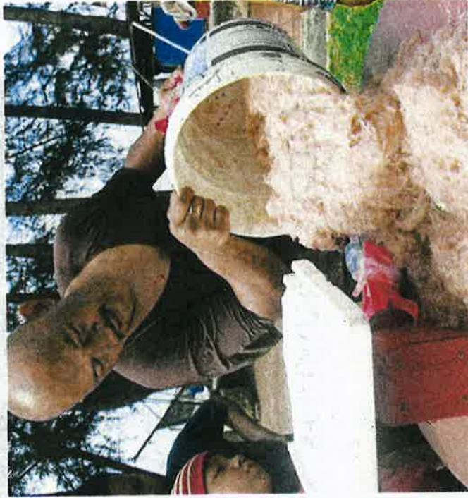
Sumber tangkapan udang geragau semakin merosot di Pantai Puteri Tanjung Kling, Melaka.

"Nelayan pun susah nak menyungkur kerana lumpur semakin dalam. Saya ada menunggu nelayan naik menyungkur di Perampungan Portugis. Bagaimanapun, yang naik cuma udang putih dan itu pun tidak banyak," katanya.