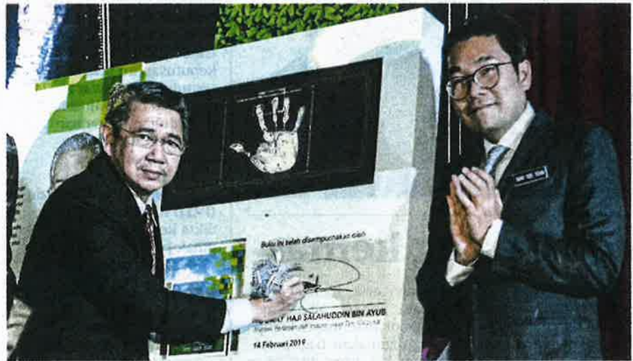
SALAHUDDIN melancarkan Hala Tuju Kementerian Pertanian dan Industri Asas Tani di MAEPS Serdang.

"Hala tuju pertama meliputi usaha memoden dan meningkatkan pengeluaran pertanian bagi menjamin kestabilan bekalan dan harga makanan negara dengan