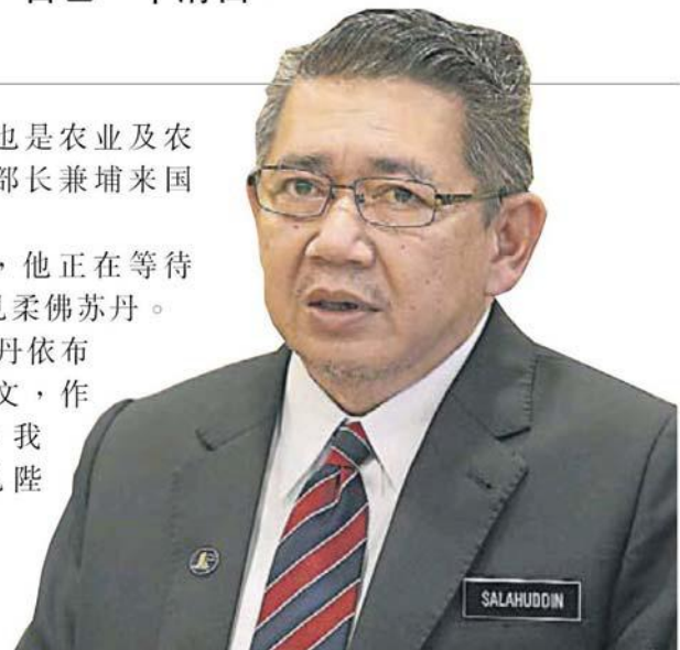
沙拉胡丁：仅是普通讲话，一般劝人行善与帮助他人的内容。