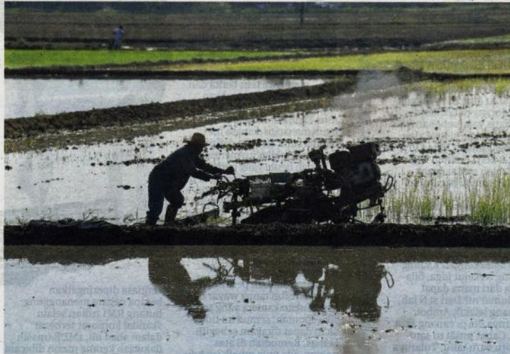
MASIH adakah ahli politik yang mahu sama-sama menangis, mendengar rintihan golongan miskin dan berpendapatan rendah seperti pesawah, petani, peneroka dan nelayan.

Tidak pernah lagi berlaku rasanya sejak kerajaan baharu mengambil alih tampuk pemerintahan negara, ada seorang anggota Kabinet menangis tanpa berselindung ketika menyelami rintihan golongan rakyat marhaen yang berhadapan dengan cabaran