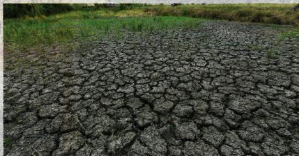
CUACA panas dengan bacaan 35 darjah Celsius di Alor Setar menyebabkan keadaan tanah merekah ketika tinjauan di sekitar Kampung Gunung dan Kampung Gunung Hilir kelmarin.

“Sekarang sudah masuk musim panas tetapi paras air di empangan tidak terjejas kerana masih berlaku beberapa