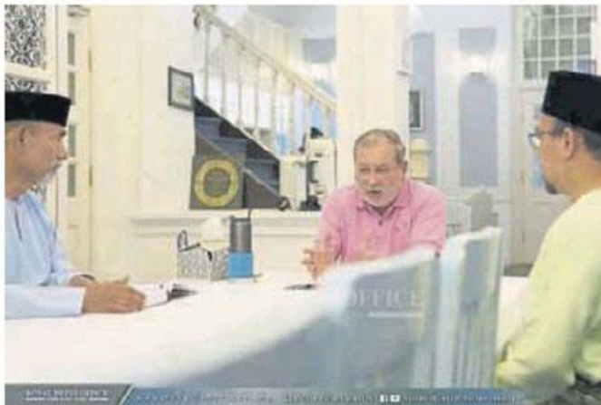
警告相关部长尽早道歉认错，柔苏丹(中)面子书贴文。

他说，他每周都会返回选区，昨日受邀到新山水塘路一清真寺演讲时，只发表10分钟演讲，劝勉大家应一起做好事。