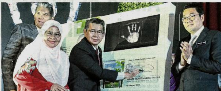
Salahuddin (dua dari kanan) bersama Timbalan Menteri Pertanian dan Industri Asas Tani, Sim Tze Tin (kanan) melancarkan Pelan Induk Kementerian Pertanian dan Industri Asas Tani di MAEPS Serdang, baru-baru ini.