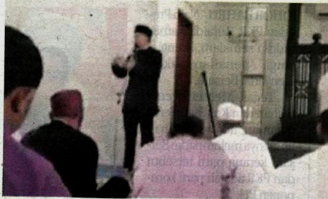
Individu yang didakwa seorang menteri sedang menyampaikan ceramah politik di dalam sebuah masjid.

Ismail itu susulan ciapan seorang pengguna Twitter yang memohon beliau menasihatkan seorang menteri didakwa menggunakan masjid untuk menyampaikan dakyah politik.