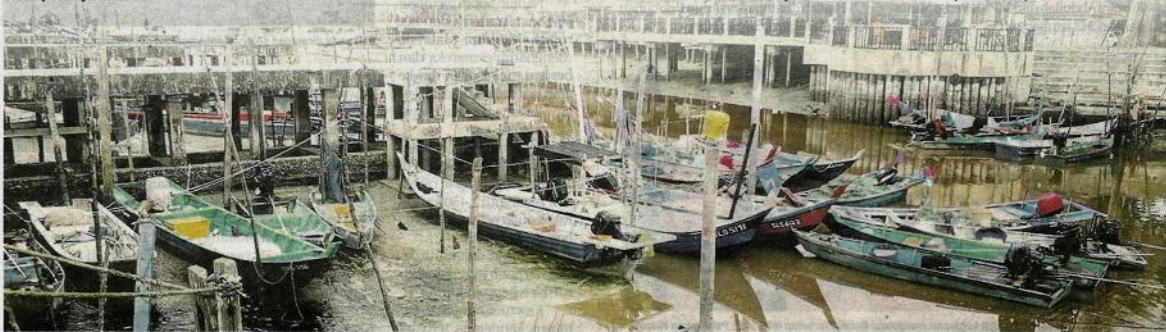
Ramai nelayan pesisir pantai di Kampung Sungai Haji Dorani bergantung kepada sumber pendapatan itu untuk menyara keluarga.