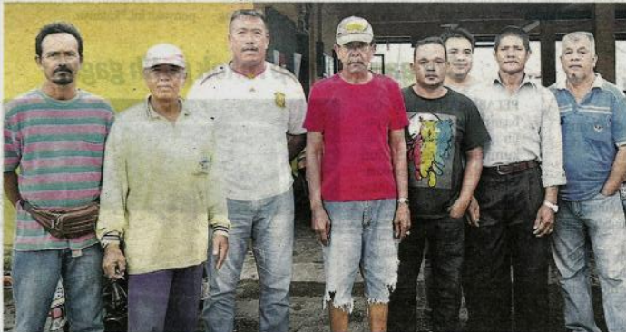
Nelayan mendesak kerajaan mengekalkan pemberian ESH sebanyak RM300 dan tidak menaguhkan bayaran kepada beberapa nelayan lain.

"Kami kecewa dengan situasi yang menimpa sekarang. Kerajaan boleh guna pelbagai usaha lain untuk berjimat-cermat, tetapi tolong jangan ambil duit bantuan nelayan," katanya.