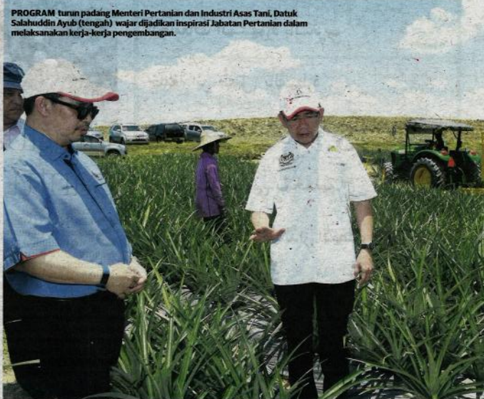
PROGRAM tunj padang Menteri Pertanian dan Industri Asas Tani, Datuk Salahuddin Ayub (tengah) wajar dijadikan inspirasi Jabatan Pertanian dalam melaksanakan kerja-kerja pembangunan.

Buat masa ini, kilang sayuran masih di peringkat cadangan, namun eksperimen yang