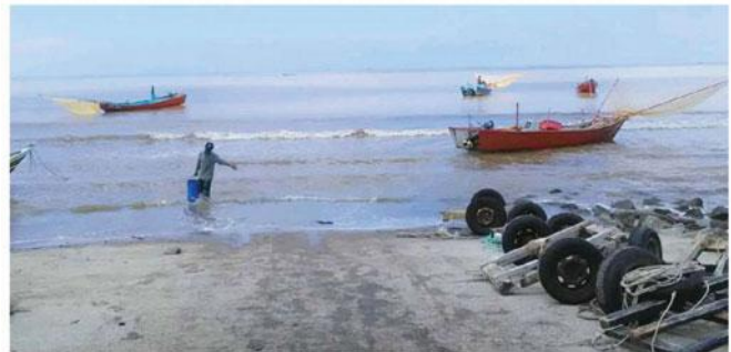
A fisherman brings a bucket full of 'bubuk' onshore at Batu Satu Lutong Beach.