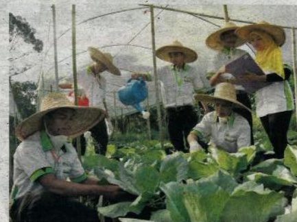
PEGAWAI program pengembangan juga perlu mendekati petani muda.

Selain itu bilangan ejen pengembangan perlu ditambah ekoran bilangan petani dan usahawan juga