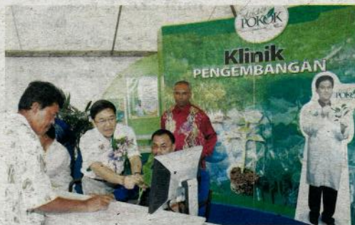
JABATAN Pertanian pernah memperkenalkan Klinik Pengembangan Dr. Pokok. - GAMBAR HIASAN

"Golongan petani dan usahawan boleh mengemukakan apa jua masalah pada hari tersebut dan jika pegawai tidak dapat mengatasinya, maka permasalahan itu akan dibawa ke peringkat tertinggi untuk tindakan susulan," katanya.