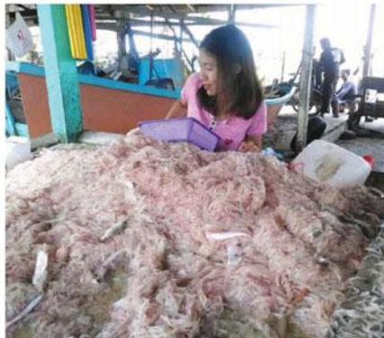
A local villager sells the 'bubuk' at her stall in Kampung Batu Satu Fishermen's Market.

"During this season, we fishermen can only get between