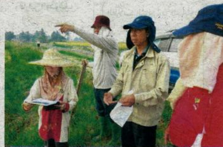
LATIHAN yang disampaikan oleh pegawai bidang khas banyak membantu petani.

dilakukan di Serdang, Selangor menunjukkan hasil yang positif dan berjaya.