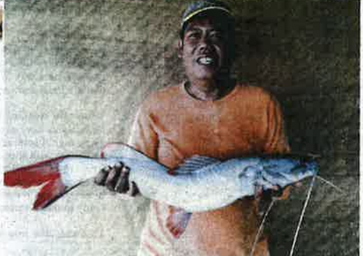
The Mekong red tail catfish is easily identifiable by the red markings on its tail.