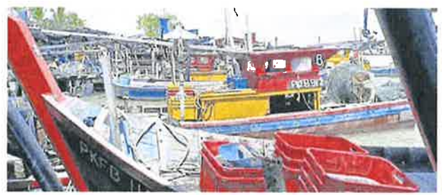
大马渔业发展局停止 B 型及 C 型渔船船主的“渔民生活补贴”，同时削减渔民生活补贴，引起哗然。