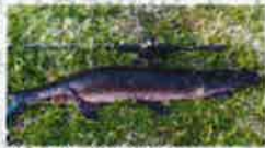
A Mekong red tail catfish is easily identifiable by the red markings on its tail.

The Fisheries Dept said the Mekong red tail catfish is a regular catch among fishermen in the state rivers. It is a large, aggressive fish that can grow up to 1.5m long and weigh more than 10kg. It is a voracious predator that eats a variety of aquatic species, including fry and shrimp.