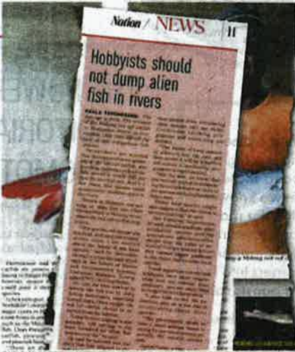
A flashback to yesterday's article in the New Straits Times that prompted the Fisheries Department's proposal to deal with disruptive fish species in local rivers.

"The Fisheries Department will continue to monitor the cultivation of this fish in this state (Terengganu) so that the farmers follow proposals and regulations that have been set."