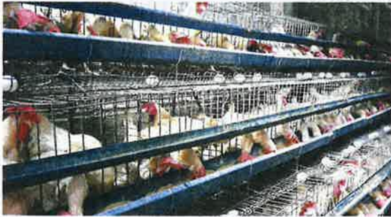
Golden eggs: Most counters in the poultry sector have seen their share prices rise in recent weeks on anticipation of bumper earnings.

This comes as prices of poultry and eggs advance