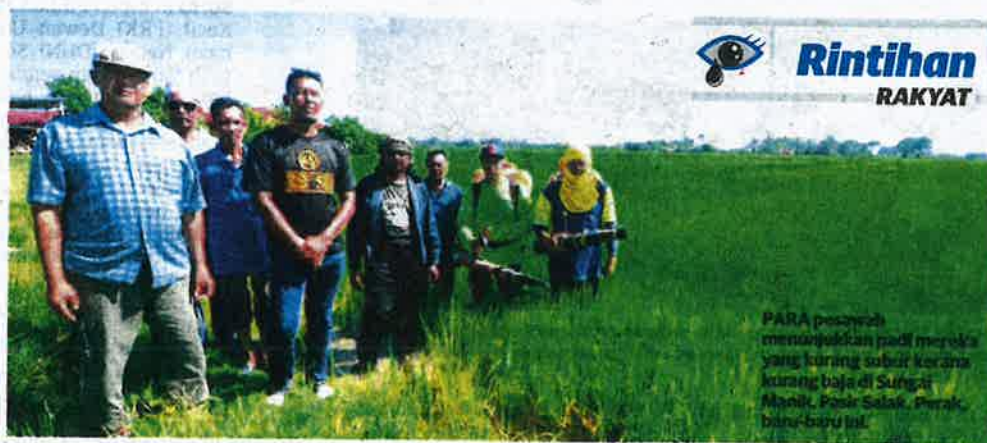
PARA pesawah menantikan padi mereka yang kurang subur kerana kurang baja di Sungai Manik, Pasir Salak, Perak, baru-baru ini.

pesawah ialah padi yang ditanam tidak mendapat baja mencukupi dan kawalan serangga makhluk perosak.