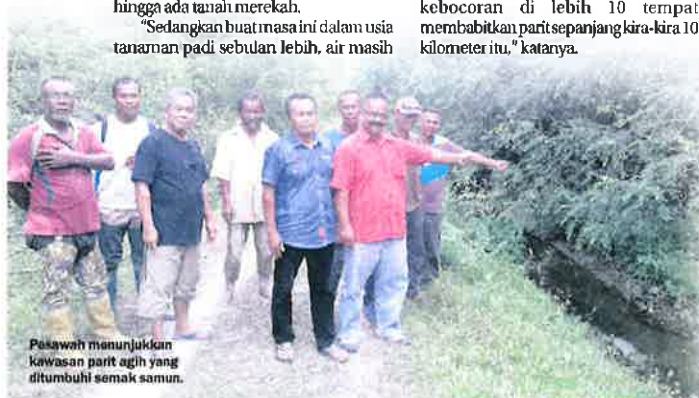
Pesawah menunjukkan kawasan parit agih yang ditumbuhi semak samun.

Bebau berkata, masalah pengairan di Skim Pengairan Pelagat berada pada tahap kritikal yang memerlukan tindakan segera daripada pihak terlibat.