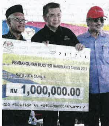
Pembangunan Kluster tanaman mangga antara yang menerima bantuan daripada Kerajaan Persekutuan.