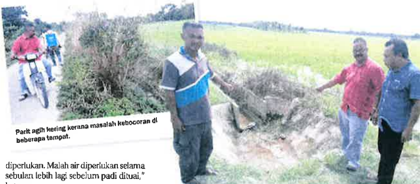
Parit agih kering kerana masalah kebocoran di beberapa tempat.

"Sedangkan buat masa ini dalam usia tanaman padi sebulan lebih, air masih