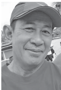
INISIATIF BAGUS DIALUKAN... Pengerusi PNK Mukah Oya.