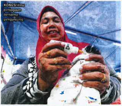
KONGSI ilmu perjagaan kepada pengunjung

"Kami ingin memperkenalkan konsep satu keluarga, satu haiwan peliharaan yang bertujuan memupuk kasih sayang terhadap haiwan dalam kalangan masyarakat, terutama kanak-kanak.