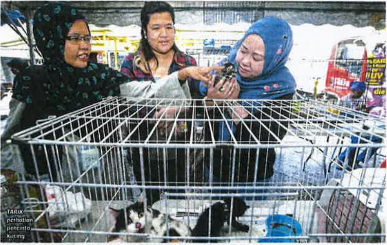
TARIKH perharian pencinta kucing

Penganturan Program Kucing Angkat anjuran Persatuan Haiwan Malaysia, minggu lalu,