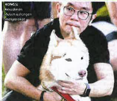
KONGSI kesedaran dalam kalangan masyarakat