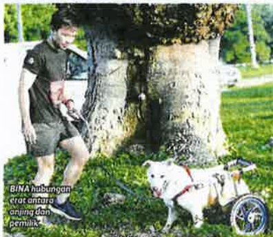
BINA hubungan erat antara anjing dan pemilik