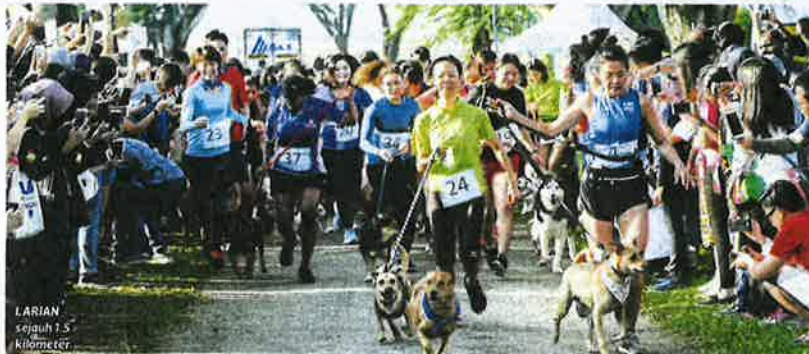
LARIAN sejauh 7.5 kilometer