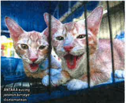
ANTARA kucing jalanan berjaya dielamatkan

"Kesanggupan keluarga angkat ini juga dapat menyebarkan mesej kesedaran, mengajar erti tanggungjawab, membentuk perasaan kasih pada makhluk lain, bersikap positif dan sabar.