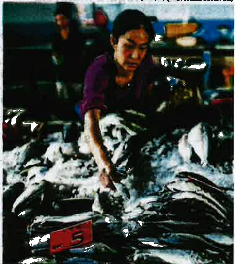
Nelayan turut menjual hasil laut kepada peniaga Pasar Awam Sungai Besar.