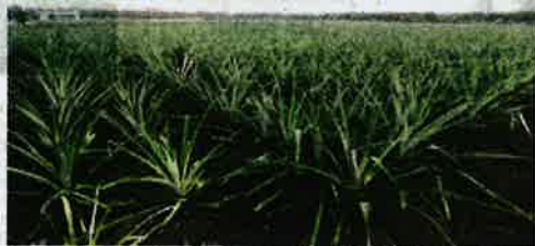
NANAS kini diusahakan secara komersial.

banyak potensi pendapatan lumayan jika diusahakan dengan betul dan bersungguh-sungguh," katanya.