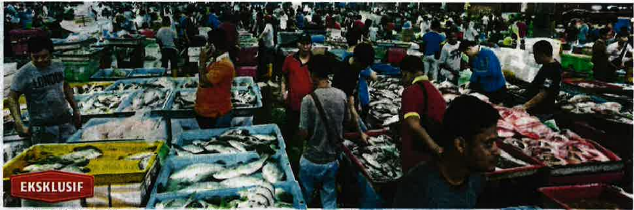
Pasar Borong Selayang menjadi tumpuan pengguna mendapatkan hasil laut.