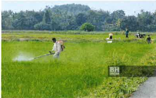
pihak yang berkaitan.

KUALA LUMPUR: Penubuhan koperasi dan melaksanakan pemasaran input secara terbuka akan membantu mengukuhkan kedudukan ekonomi pesawah di Malaysia, sekali gus mengurangkan masalah monopoli pengeluaran padi, demikian menurut Institut Penyelidikan Khazanah (KRI).