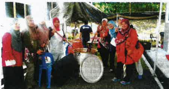
SEBAHAGIAN peserta yang terlibat dalam aktiviti memasak.

"Hal ini jelas terbukti bahawa pertanian merupakan antara salah satu faktor penyumbang kepada perkembangan ekonomi," ujarnya.