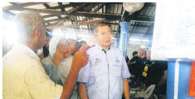
Salahuddin (kanan) diberi penerangan mengenai harga ikan ketika melawat Pasar Nelayan Balok di Kuantan, semalam.

Beliau berkata demikian ketika berucap dalam program Ramah Mesra Menteri Pertanian dan Industri Asas Tani Malaysia bersama Nelayan di Pasar Nelayan Balok, kelmarin.