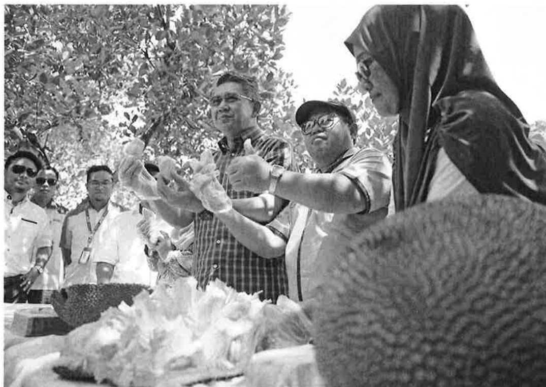
MENTERI Pertanian dan Industri Asas Tani Datuk Salahuddin Ayub (tengah) menunjukkan kualiti isi buah nangka sempena lawatan di Taman Kekal Pengeluaran Makanan (TPKM) Lanchang baru-baru ini. TPKM Lanchang merupakan kawasan pengeluaran buah-buahan terbesar negara dengan keluasan 3,600 hektar yang dikawal selia oleh Jabatan Pertanian Malaysia.