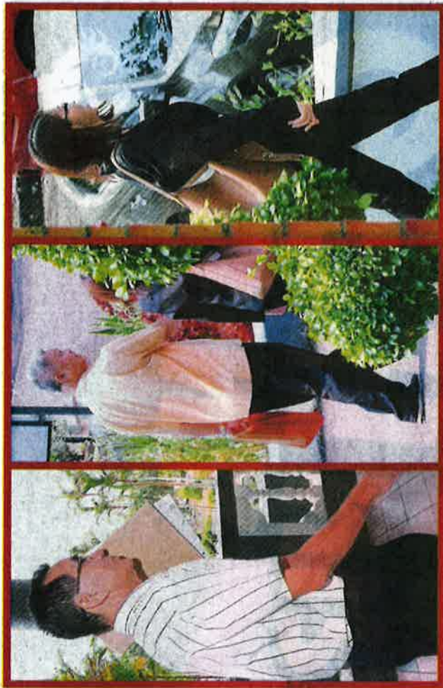
Tiga pengarah syarikat pengeluaran telur ayam mengadu tidak bersah selepas dipanggil ke Mahkamah, semalam.

Kesalahan itu didakwa dilakukan pada jam 2.15 pe-