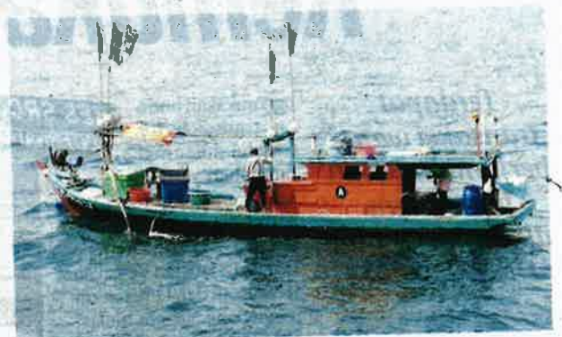
PPM berjaya mengesan sebuah bot kelas A menerusi Ops Gelora dan menangkap tiga nelayan warga Indonesia, di perairan Pulau Ketam semalam.

Katanya, siasatan masih dijalankan dan kes disiasat mengikut Akta Perikanan 1985 dan Akta Imigresen.