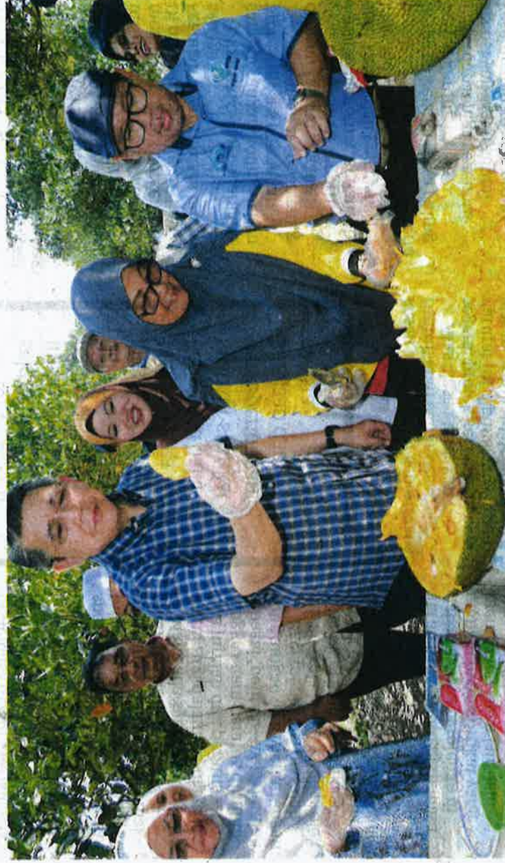
SALAHUDDIN AYUB mencuba nangka Tekam Yellow (J33) ketika melawat ladang nangka di Taman Kekal Pengeluaran Makanan Lanchang di Temerloh, Pahang semalam.

TKPM Lanchang bukan sahaja mewujudkan sebuah taman kekal tetapi lebih utama mampu menjana sumber ekonomi