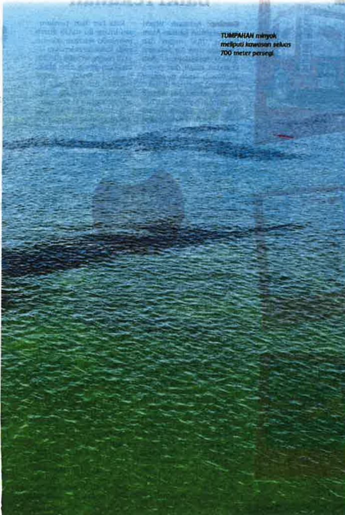
TUMPAHAN minyak meliputi kawasan seluas 700 meter persegi.

"Tetapi kali ini pencemaran membabitkan pesisir pantai sejauh dua kilometer. Ia juga melekat pada batu yang kerap dijadikan rujukan pelajar arkeologi Universiti Malaya (UM) bagi tujuan penyelidikan," katanya.