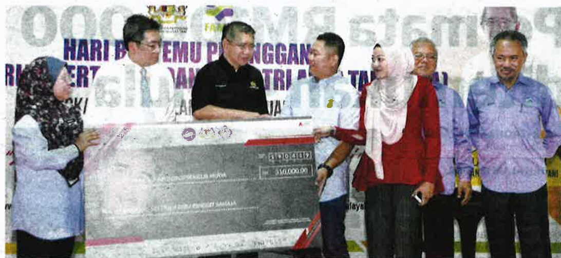
SALAHUDDIN AYUB (tiga dari kiri) menyampaikan replika cek geran untuk usahawan tani muda sempena program Hari Bertemu Pelanggan Kementerian Pertanian dan Asas Tani peringkat Lembah Klang di Ibu pejabat Lembaga Pemasaran Pertanian Persekutuan (FAMA) di Kuala Lumpur, semalam.