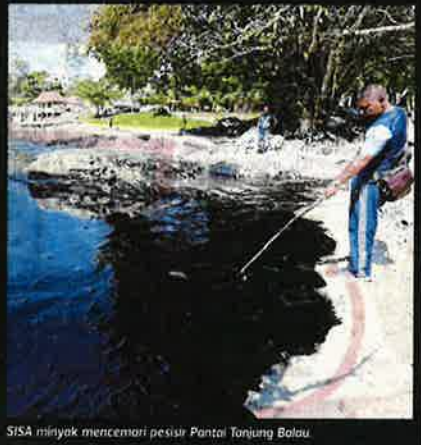
SISA minyak mencemari pesisir Pantai Tanjung Balau.