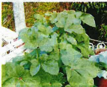
ANTARA tanaman yang ada di kebun.

Berkongsi petua menjaga tanaman, baginya pokok bunga dan sayur diletakkan betul-betul di tengah panas namun harus mencukupkan air dan baja bagi menyuburkan tanaman.