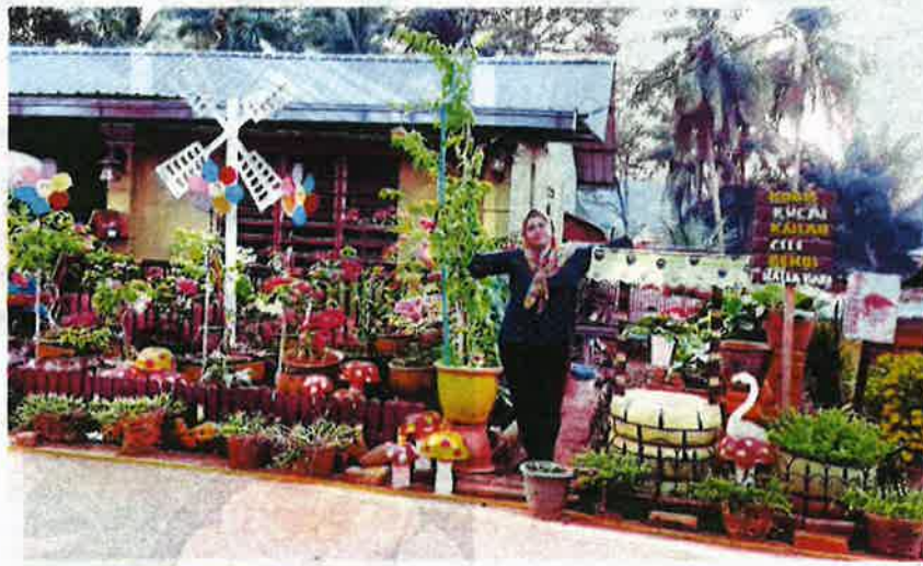
MAIZURA memanfaatkan ruang terhad di rumahnya dengan kebun dapur.

"Kita tidak tahu sayur yang dijual di pasar diambil dari mana dan cara pengurusan penanamannya. Malah tiada jaminan sama ada sayur itu bebas racun serangga yang