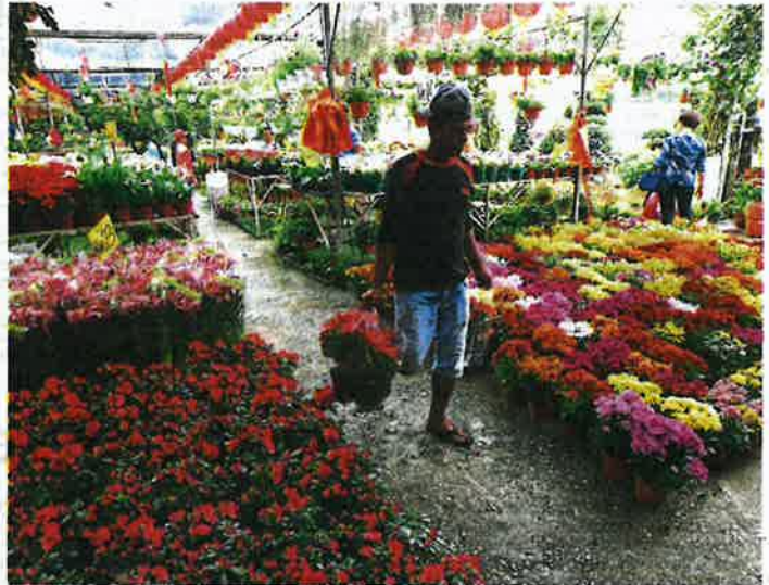
The nurseries in Sungai Buloh are particularly popular during festive seasons as Klang Valley folk making a beeline for plants with auspicious meanings.

Letting the nurseries die off will be a big mistake because it is a lucrative and sustainable business, and what was once a noble initiative should be continued for the sake of future generations.