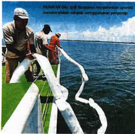
PASERAN Oils Spill Response menjalankan operasi membersihkan minyak menggunakan perangkap.

pendapatan RM400 hingga RM500 seminggu. "Jarak bubu ditempatkan 500 meter hingga satu kilometer dan kedalaman 15 meter untuk membolehkan hasil tangkapan yang banyak," katanya.