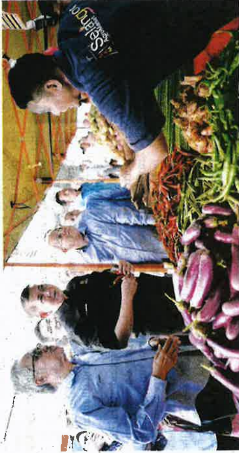
Salahuddin beramah mesra dengan peniaga ketika lawatan kerja Hari Bertemu Pelanggan Peringkat Lembah Klang di Ibu Pejabat FAMA di Selayang, semalam.

Menteri Pertanian dan Industri Asas Tani, Datuk Salahuddin Ayub berkata, program dengan tema 'Permasaran dan Keusahawanan' akan diadakan pada setiap Rabu di peringkat