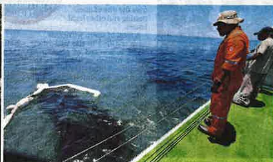
(Left) The oil slick found on a beach in Tanjung Balau, Kota Tinggi, yesterday. (Right) The crew of 'Al Nilam', a boat belonging to the Marine Department, deploying a net to clean up an oil slick yesterday.