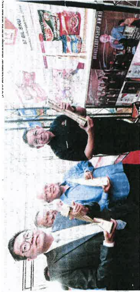
Salahuddin melawat pameran selepas merasmikan Program Hari Bertemu Pelanggan MOA Peringkat Lembah Klang di Ibu Pejabat FAMA, Kuala Lumpur, semalam.

Sementara itu, beliau berkata, Hari Bertemu Pelanggan MOA akan diadakan pada peringkat ne-