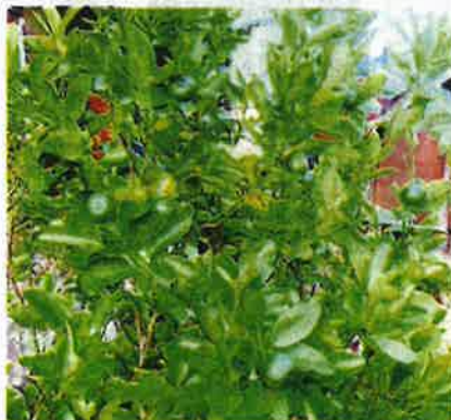
HASIL tanaman yang subur dengan penjagaan betul.