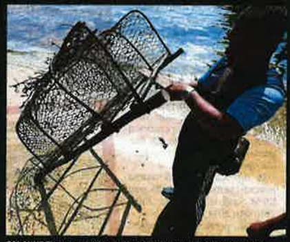
SALAHUDEN menunjukkan bubu miliknya yang diselaputi minyak.