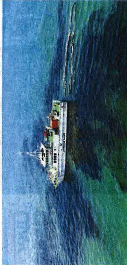
Dark sea: A Marine Department vessel surveying the oil spill off Kota Tinggi.

"We finally managed to contact his children about their missing father and they picked him up at 11pm," he said.