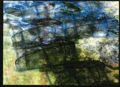
BANYAK bubu baru yang direndam diselaputi minyak.