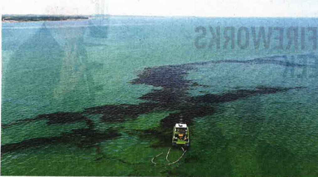
An aerial picture taken by a drone showing the Marine Department ship 'Al Nilam' cleaning up the oil slick in the waters off Tanjung Balau in Kota Tinggi yesterday.