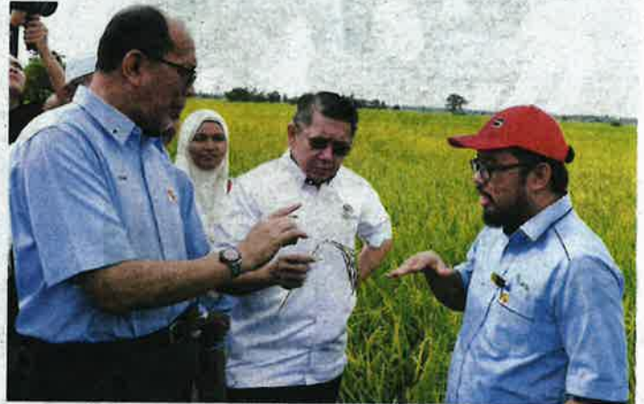
TINJAUAN... MENTERI Pertanian dan Industri Asas Tani, Datuk Salahuddin Ayub (tengah) melawat sawah padi sempena Program Tinjauan Mesra Padi dan Perasmian Kempen Penggunaan Benih Padi Sah peringkat kebangsaan di Pusat Pertanian Sungai Burong, Selangor baru-baru ini.

"Sebab itu saya ingin menarik lebih ramai generasi muda supaya meyakini bahawa bidang pertanian boleh menjadi sumber pendapatan lumayan jika berusaha," katanya.