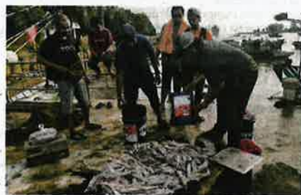
Lambakan sotong yang berjaya ditangkap menerusi aktiviti mencandat.

Namun, pendapatan lumayan seperti itu bukan selalu diperolehi kerana ia bergantung kepada nasib serta keadaan cuaca semasa dan ada ketikanya pulang dengan beberapa kilogram sotong sahaja.