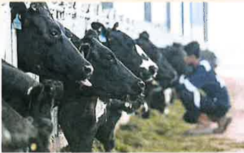
农业部也研探討如何提升牛畜业的发展潜力

【新山21日讯】农业及农基工业部长拿督沙拉胡丁阿育披露，在笨珍县打造全国最大蚌蛤及贝类生产中心的计划，预计在两个月内正式推介。 他指出，农业部及柔佛州政府都将投入拨款，推动上述计划的落实。