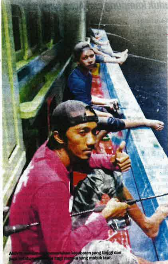
Aliran angin kencang menyebabkan gelombang yang tinggi dan juga berbahaya bagi mereka yang mabuk laut.