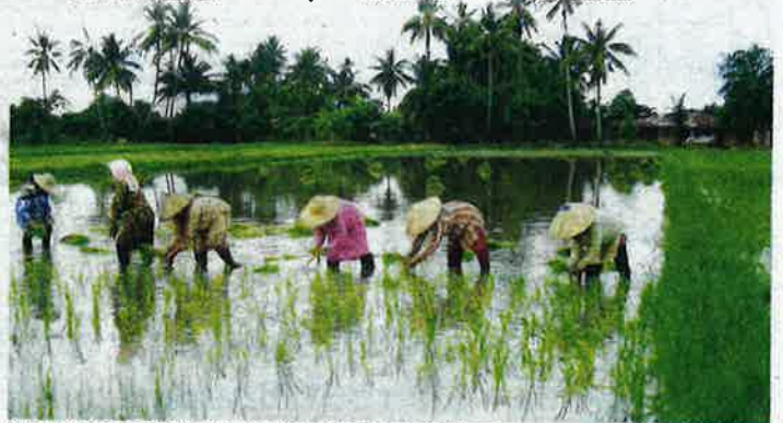
PESAWAH masih memerlukan bantuan daripada kerajaan setiap kali musim penanaman. - GAMBAR HIASAN