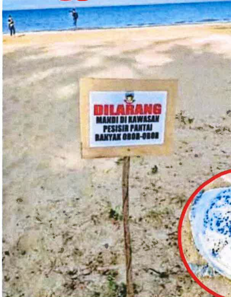
PAPAN tanda diletakkan di sepanjang Pantai Tanjung Aru berikutan kehadiran obor-obor pasir.