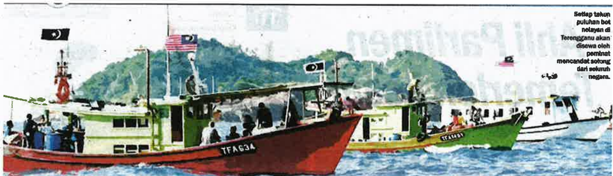
Setiap tahun puluhan bot nelayan di Terengganu akan disewa oleh peminat mencandat sotong dari seluruh negara.