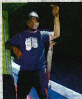
Sotong bersaiz besar yang berjaya dianalkan hasil teknik mencandat.

Tambahnya, walaupun hasil tangkapan sotong tidak banyak kerana faktor bulan gelap tetapi mereka berpuas hati dengan apa yang diperolehi dan paling utama, pengalaman itu tidak dapat dijual beli.