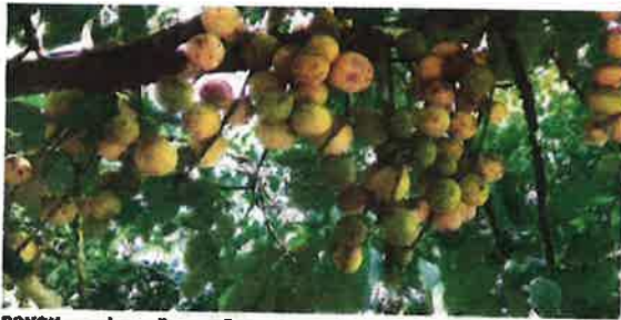
PONOK cermal yang ditanam di Sjangkong Selangor.

"Contoh yang bakal merundum dalam masa lima tahun lagi adalah durian musang king.