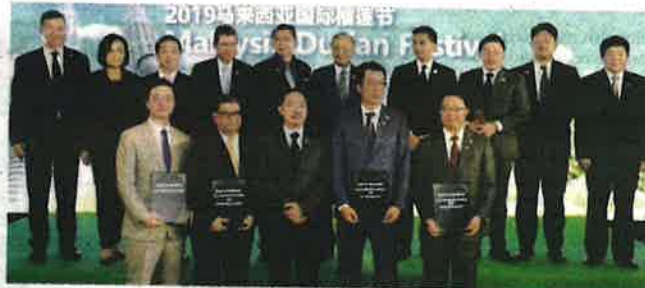
Dr Mahathir (belakang lima dari kanan) menandatangani perjanjian bagi meningkatkan pemasaran produk durian ke China, kelmarin.

Sepanjang program berlangsung, PLS Plantation telah memeterai perjanjian induk dengan Shanghai