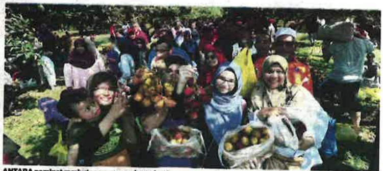
ANTARA peminat rambutan yang membawa buah untuk ditimbang dan bayar di MARDI Serang.