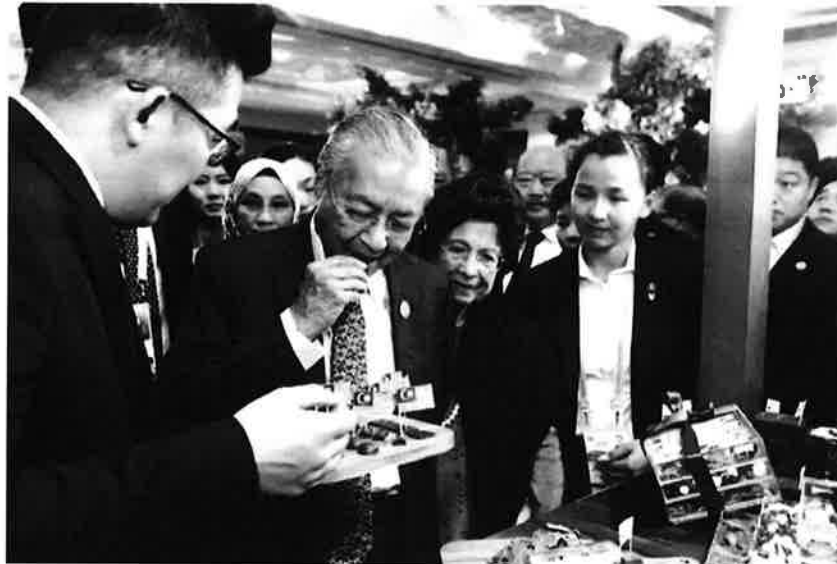
Prime Minister Dr Mahathir (second left) and wife Tun Dr Siti Hasmah Mohd Ali are seen visiting the Malaysia Durian Festival exhibition booth in Beijing, China.