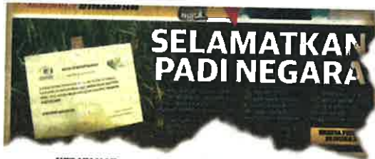
KERATAN Mingguan Malaysia semalam.

"Sebab itu kita minta mereka memulakan langkah dengan meminta resit setiap kali membeli benih daripada pembekal supaya kita dapat menyelesaikan masalah pendedaran benih