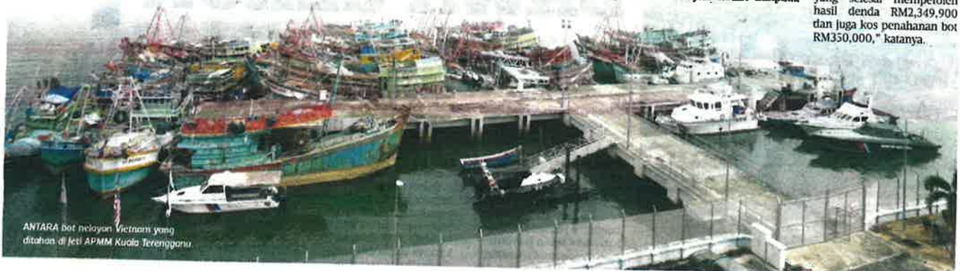
ANTARA bot nelayan Vietnam yang ditahan di Jeti APMM Kuala Terengganu.

"Selain itu, kes mahkamah yang selesai memperoleh hasil denda RM2,349,900 dan juga kos penahanan bot RM350,000," katanya.