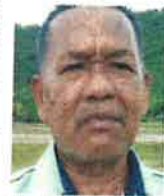
CHE ANI MAT ZAIN

"Pihak MADA juga perlu memperbaiki peranan pegawai-pegawai mereka supaya dapat membantu pesawah pesawah daripada menjadi mangsa penipuan ejen, broker atau orang tengah dalam isu ini," katanya yang turut menghargai usaha Utusan Malaysia di sini hari ini.