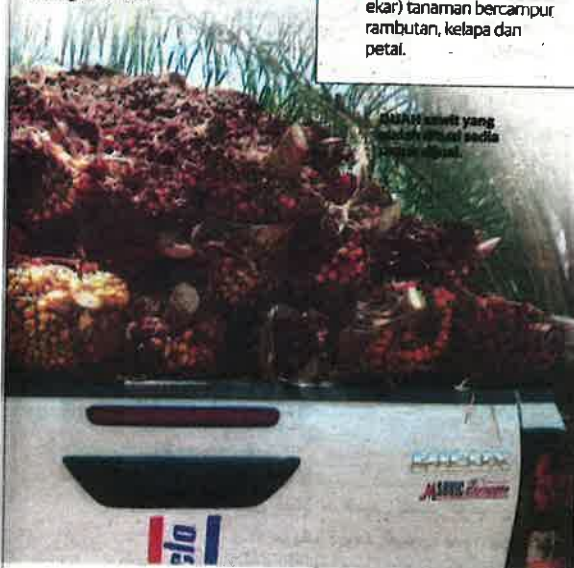
MARDI sawit yang berbuah pada setiap tahun.

Bagi Basri Nawawi dia juga seronok dengan jemputan tersebut tetapi berharap kemudahan ditambah baik demi kelesaan pengunjung.