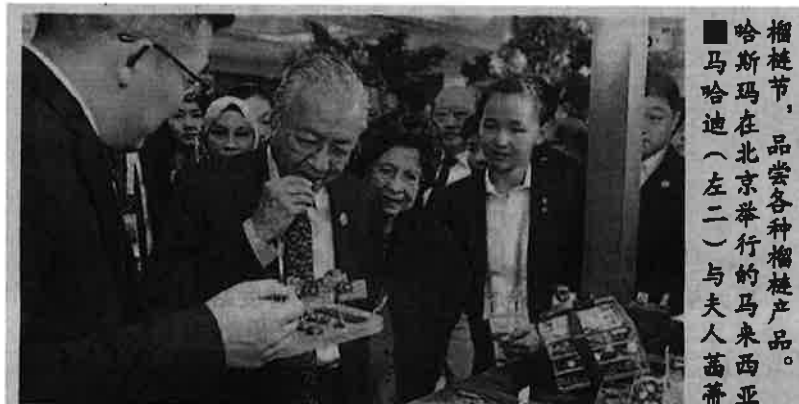
■ 榴梿节，品尝各种榴梿产品。 马斯玛在北京举行的马来西亚 马哈迪（左二）与夫人茜蒂