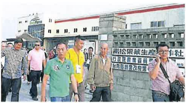
青松果菜生产合作社的营运模式，让参访者获益良多。

以农教型生产合作社管理模式，根据合作模式，农民提供生产基地和劳力，以光明生产产线，依照双方约定的品质、价格、产量、收购，农民可省去到批发市场的时间，并节省人力，并节省大量的时间和精力扩大生产面积及增加农民受益。