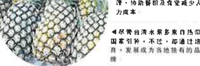
尽管台湾水果多来自热带国家引种，不过，即通过培育，发展成为当地独有的品牌。