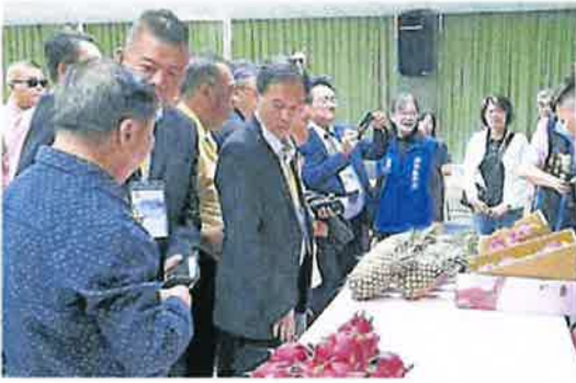
参访者向农委会负责人了解种植与培育水果的方法。