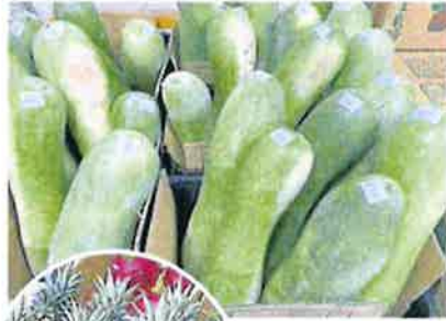
台湾目前不仅重视蔬果产销市场，也进行切割加工处理，协助餐馆及食堂减少人力成本。