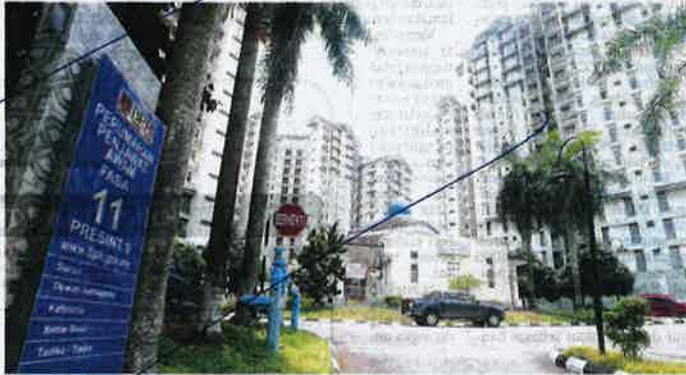
KIRA-KIRA 500 kontraktor bumiputera terpaksa gulung tikar ekoran keputusan kerajaan menamatkan kontrak kerja-kerja penyelenggaraan kuarters penjawat awam di Putrajaya bermula Jun ini.

"Selangkan ketika ini kami banya peroleh keuntungan bersih