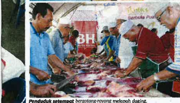
Penduduk setempat bergotong-royong melapah daging.