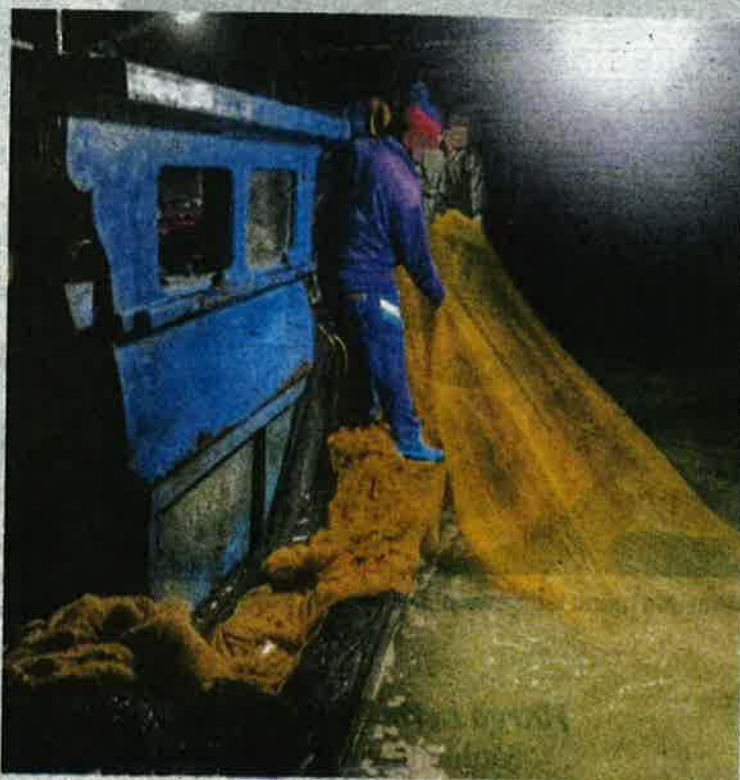
Bot kenka, lima nelayan dan semua barang rampasan dibawa ke Jeti Pasukan Polis Marin Batu Uban untuk tindakan lanjut.

"APMM akan terus meningkatkan lagi pemantauan dan rondaan dalam membanteras sepenuhnya aktiviti yang menyalahi undang-undang jenayah di laut," katanya.