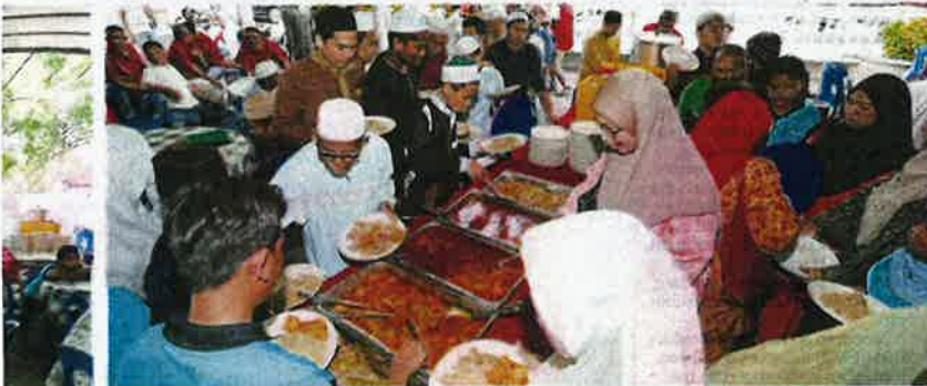
Orang ramai mengambil juadah berbuka puasa di pekarangan Masjid Jamek Kodang.