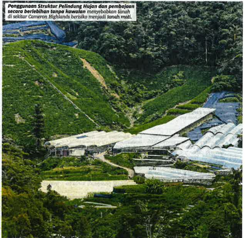
Penggunaan Struktur Pelindung Hujan dan pembajaan secara berlebihan tanpa kawalan menyebabkan tanah di sekitar Cameron Highlands berisiko menjadi tanah mati.