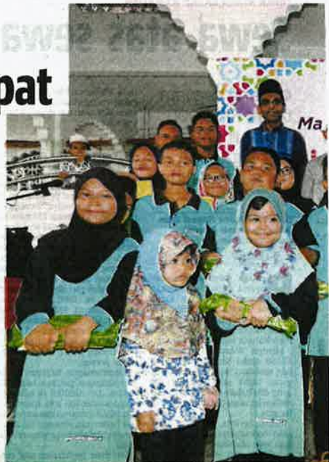
Sebahagian golongan esnaf yang hadir pada majlis berbuka puasa pada Kolaborasi Program Semarak Ramadan BH 2019 di Masjid Jamek, Kodiang, semalam.

Katanya, selain pengagihan bubur lambuk, program itu juga membabitkan penyerahan bantuan barangan keperluan harian kepada 50 keluarga terpilih.