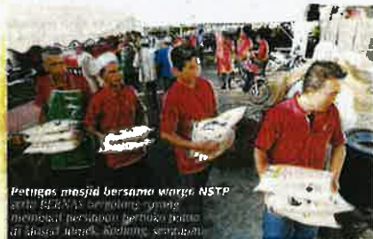
Petugas masjid bersama warga NSTP serta BERNAS berkolaborasi untuk membina perkhidmatan berbuka puasa di masjid Jamek, Kodiang, semalam.