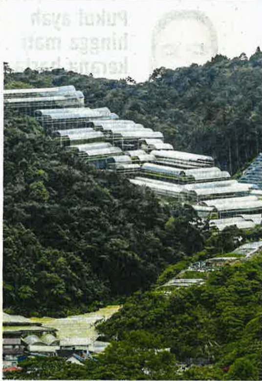
'TANAH MATI' ANCAM CAMERON HIGHLANDS