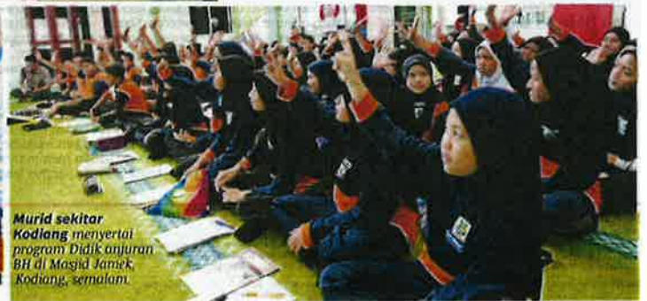
Murid sekitar Kodang menyertai program Didik anjuran BH di Masjid Jamek Kodang, semalam.