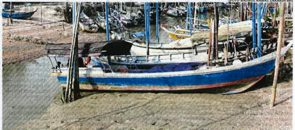
Bot nelayan tersadai di Pangkalan Parit Karang Laut ketika air surut berikutan keadaan di muara cetek.