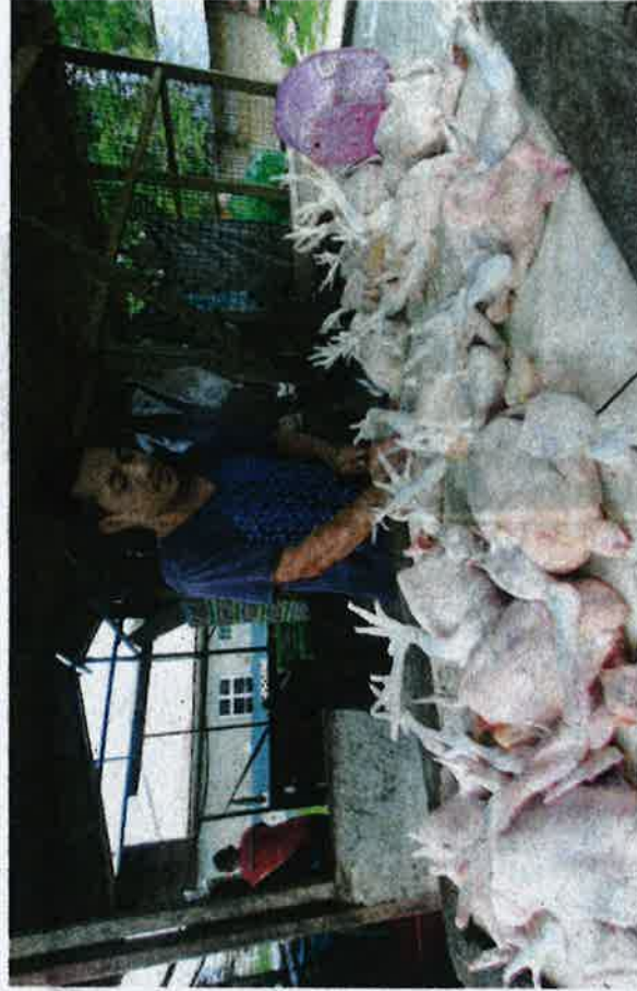
BEKALAN daging ayam dijangka mendapat permintaan tinggi sempena sambutan Hari Raya Aidilfitri awal bulan depan. – Gambar hiasan

tribunal tuntutan pengguna sebagai platform untuk membuat tuntutan ganti rugi berkenaan pembehan barangan atau perkhidmatan," katanya.