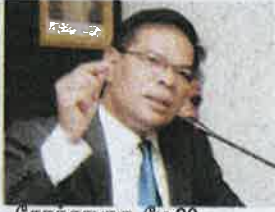
கோத்தாபாரு, மே 20-

இவ்வாண்டு ஹரி ராயா கொண்டாட்டத்தை முன்னிட்டு போதுமான அத்தியாவசிய உணவுப் பொருட்கள் இருப்பதை உள்நாட்டு வாணிப மற்றும் பயனீட்டாளர் அமைச்சு உறுதி செய்யும் என அதன் அமைச்சர் சைபுடின் நகத்தியோன் கூறினார். கோழி, முட்டை மற்றும் தேங்காய்