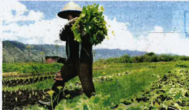
USAHA mengeluarkan sebanyak mungkin hasil daripada tanah terbiar dapat mengurangkan kos hidup. (Gambar hiasan)

Statistik Jabatan Pertanian pada 2014 menunjukkan tidak kurang 119,273 hektar tanah yang sesuai untuk pertanian tidak diusahakan dan terbiar di seluruh negara.