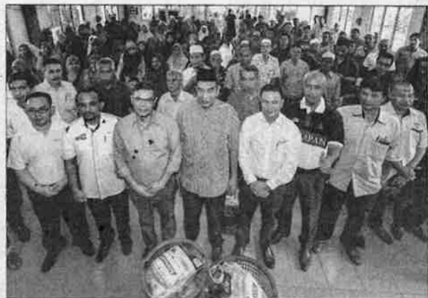
Domestic Trade and Consumer Affairs Minister (KPDNHEP), Datuk Seri Saifuddin Nasution Ismail (third left), pictured with recipients of the Ihye Ramadan Programme and the Tumpat community on Sunday. Also present was Kemubu Agricultural Development Authority chairman Datuk Husam Musa (fifth right).

Meanwhile, Saifuddin Nasution said the ministry had issued 447 compound notices to 38,000 traders at the Ra-