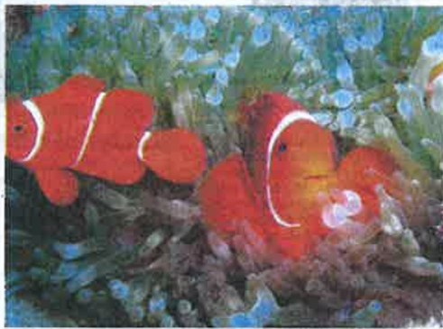
CLOWN fish menjadi tarikan utama kepada para penyelam di Taman Laut Pulau Payar, Langkawi.

Bagi mencapai matlamat tersebut, banyak langkah pemuliharaan yang dilakukan termasuk yang paling memberi