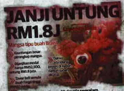
KERATAN Mingguan Malaysia semalam.

"Modus operandinya adalah pergi ke suatu tempat di kawasan luar bandar, menerang-