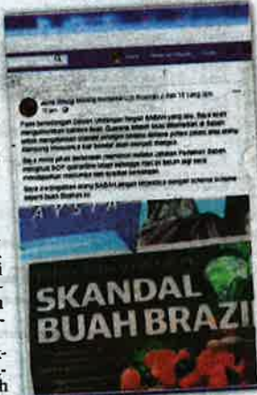
STATUS facebook, Junz Wong berkenaan skandal buah guarana semalam.

mengambil berat dan menjaga kebajikan rakyatnya dengan menasihati agar tidak tertipu dengan skandal yang ada.