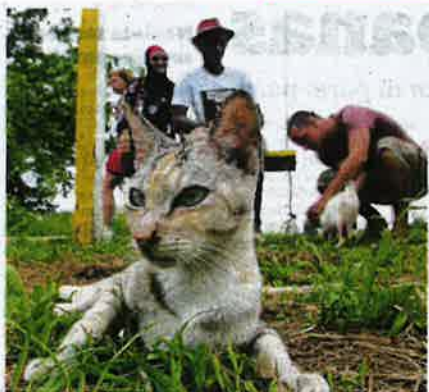
MEOW Island sering mendapat perhatian pencinta kucing dari Barat untuk menjadikannya destinasi sukarelawan.