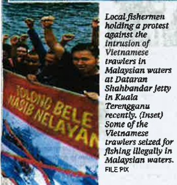
Local fishermen holding a protest against the intrusion of Vietnamese trawlers in Malaysian waters at Dataran Shahbandar Jetty in Kuala Terengganu recently. (Inset) Some of the Vietnamese trawlers seized for fishing illegally in Malaysian waters.