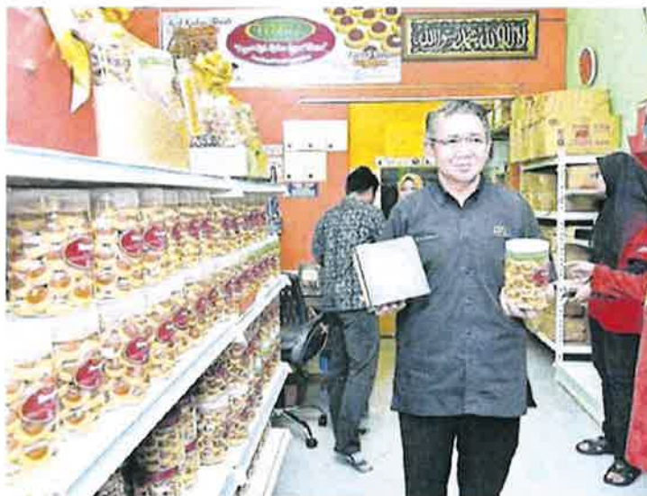
■沙拉胡丁阿育披露，我国的黄梨产品，无论是出口或国内需求都有上升趋势。