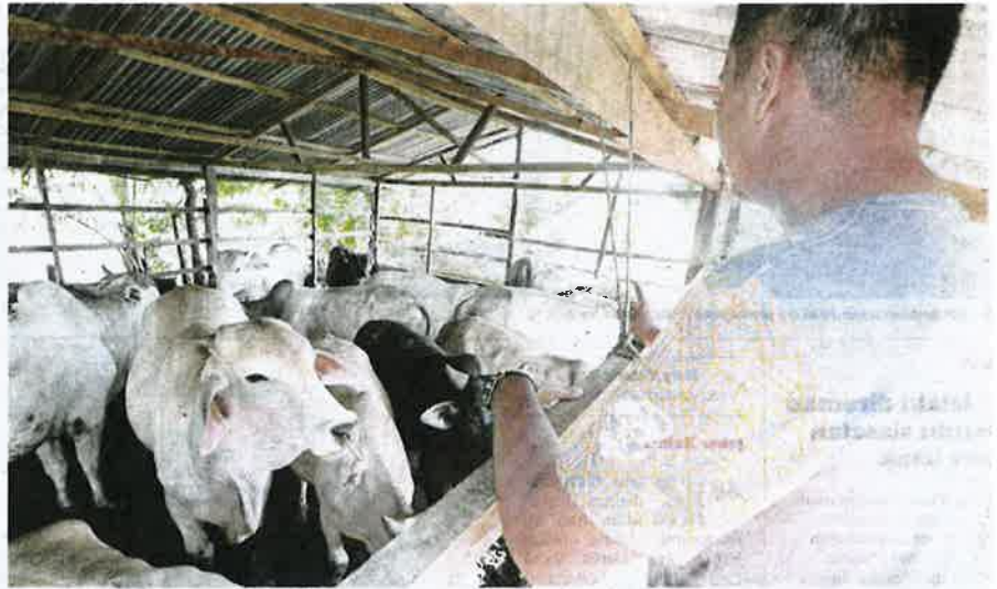
ANGGOTA Batalion 9 PGA menantau rampasan lembu yang disekup masuk dari Thailand di Pos Ular sebelum diserahkan kepada MAQIS.