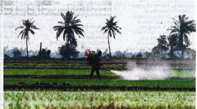
KEPIMPINAN LPP perlu benar-benar bertanggungjawab dan mempunyai komitmen tinggi untuk memastikan pertubuhan mereka mampu memberi apa juga bantuan dan perkhidmatan kepada peladang. - GAMBAR HIASAN/BERNAMA

■ Komposisi AJP di NAFAS terdiri daripada lima ahli yang dipilih dalam MAT dan enam dilantik oleh Menteri serta Pengerusi hendaklah dinamakan dalam kalangan