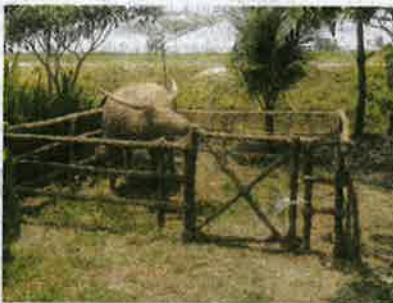
Arca jerami padi dijual pada harga serendah RM500 hingga RM3,000 bergantung pada saiz, proses penghasilan dan ketahanan arca.

Selain menjual arca jerami padi, Taugh turut merancang membuka sebuah galeri seni jerami padi pada masa depan.