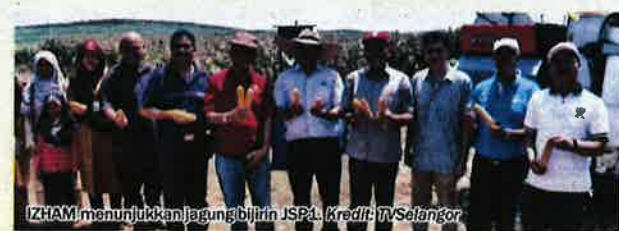
IZHAM menunjukkan jagung bijirin JSP1.

lankan Green World Genetic Sdn Bhd (GWG) dengan kerjasama Perbadanan Kemajuan Pertanian Selangor (PKPS) itu diusahakan di atas tanah seluas 54 hektar di Hulu Selangor.