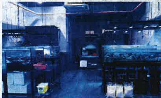
PUSAT Pameran dan Jualan di Puncak Bukit Jalil, Kuala Lumpur.

Antara aspek diberi penekanan dalam penstrukturan semula itu adalah cara penternakan, pengurusan