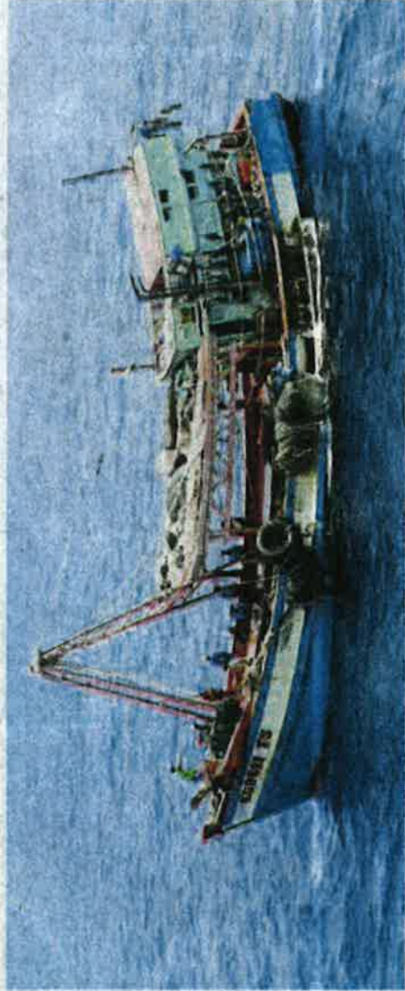
APMM merampas lima bot dan menahan 40 warga Vietnam menceroboh di perairan negara.

"Selepas diperiksa, bot yang membawa lima awak-awak termasuk tekong dipercayai menggunakan nombor pendaftaran klon kerana nombor enjin bot tidak sama dengan lesen, selain tidak memi-