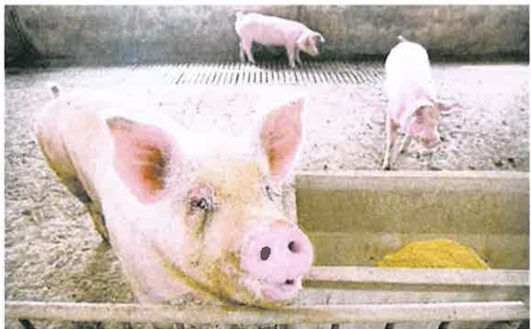
■非洲猪瘟疫情蔓延, 导致全球猪肉价格飙升至新高价位。