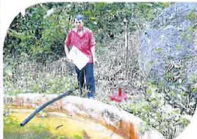
■相信是新地的边界，周县长指出河流上游区的石塘（黄圈点）。