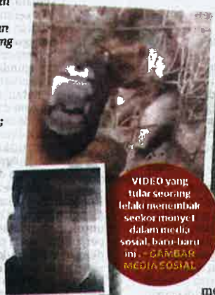
VIDEO yang tular seorang lelaki menembak seekor monyet dalam media sosial baru-baru ini.

Jadi, apa yang kita boleh bantu? Laporkanlah sebarang kejadian penderaan haiwan yang kita nampak. Nak harap manusia kejam dan tidak berakal sebegini tiba-tiba jadi baik dan bijak, jangan berharap.