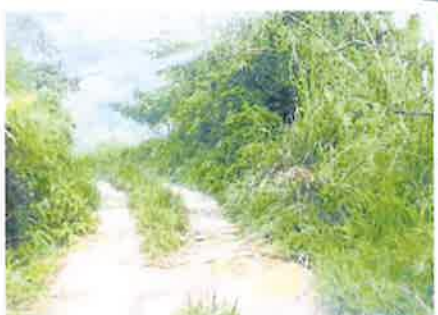
进入新姜地的山路与泥路不平坦。