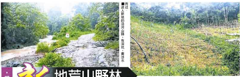
■进入新地的沿河山路，有深坑，需涉水而过。