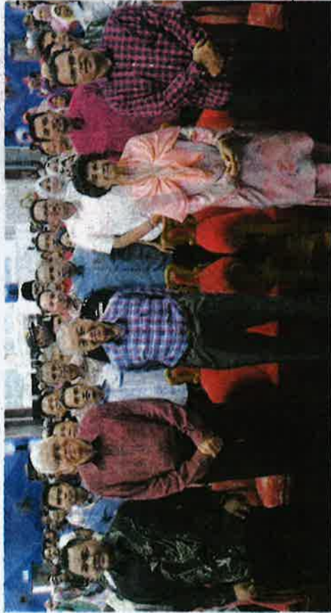
Dr Mahathir (tengah) dan isteri Tun Dr Siti Hasmah Mohamad Ali (dua dari kanan) pada majlis petancaran KIDA di Langkawi semalam.

LANGKAWI - Langkawi berpotensi menjadi pengeluar beras pulut utama di Malaysia melalui projek penanaman padi pulut dijangka dilaksanakan pada September depan.