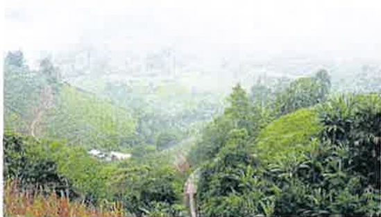
■ 23碑姜地的景色可媲美金马仑高原。