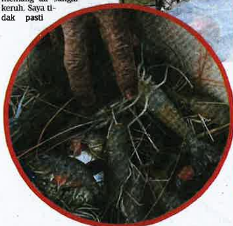
UDANG galah yang dipancing di Sungai Linggi berhampiran Pengkalan Kempas, Port Dickson, Negeri Sembilan.

"Berkaitan pencemaran sungai dari kawasan industri, setakat ini ia dalam kawalan JAS dan tiada pengeluaran (bahan kimia dari kilang) secara langsung kepada kesamatan ikan atau udang," katanya.