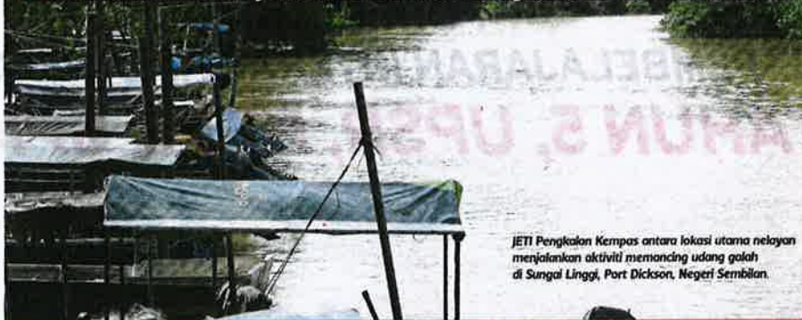
JETI Pengkalan Kempas antara lokasi utama nelayan menjalankan aktiviti memancing udang galah di Sungai Linggi, Port Dickson, Negeri Sembilan.

■ Penduduk dakwa fenomena disebabkan pencemaran racun tuba