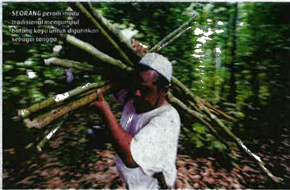
SEORANG peraih madu tradisional mengumpul batang kayu untuk digunakan sebagai tangga.