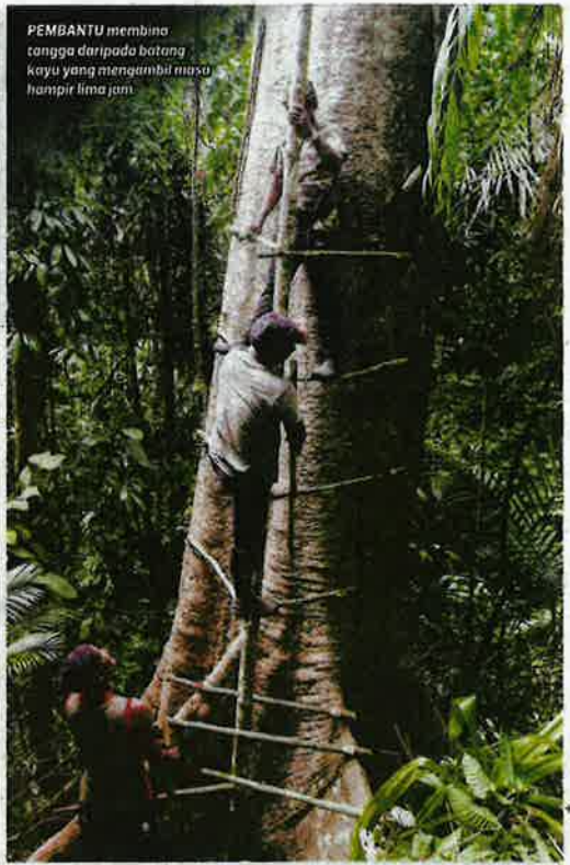
PEMBANTU membina tangga daripada batang kayu yang mengambil masa hampir lima jam.