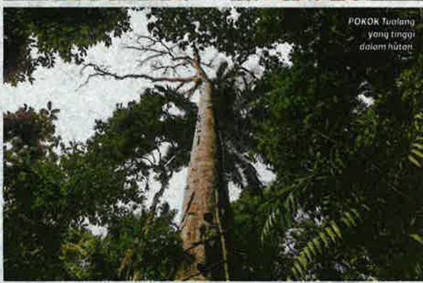
POKOK Tuolang yang tinggi dalam hutan.