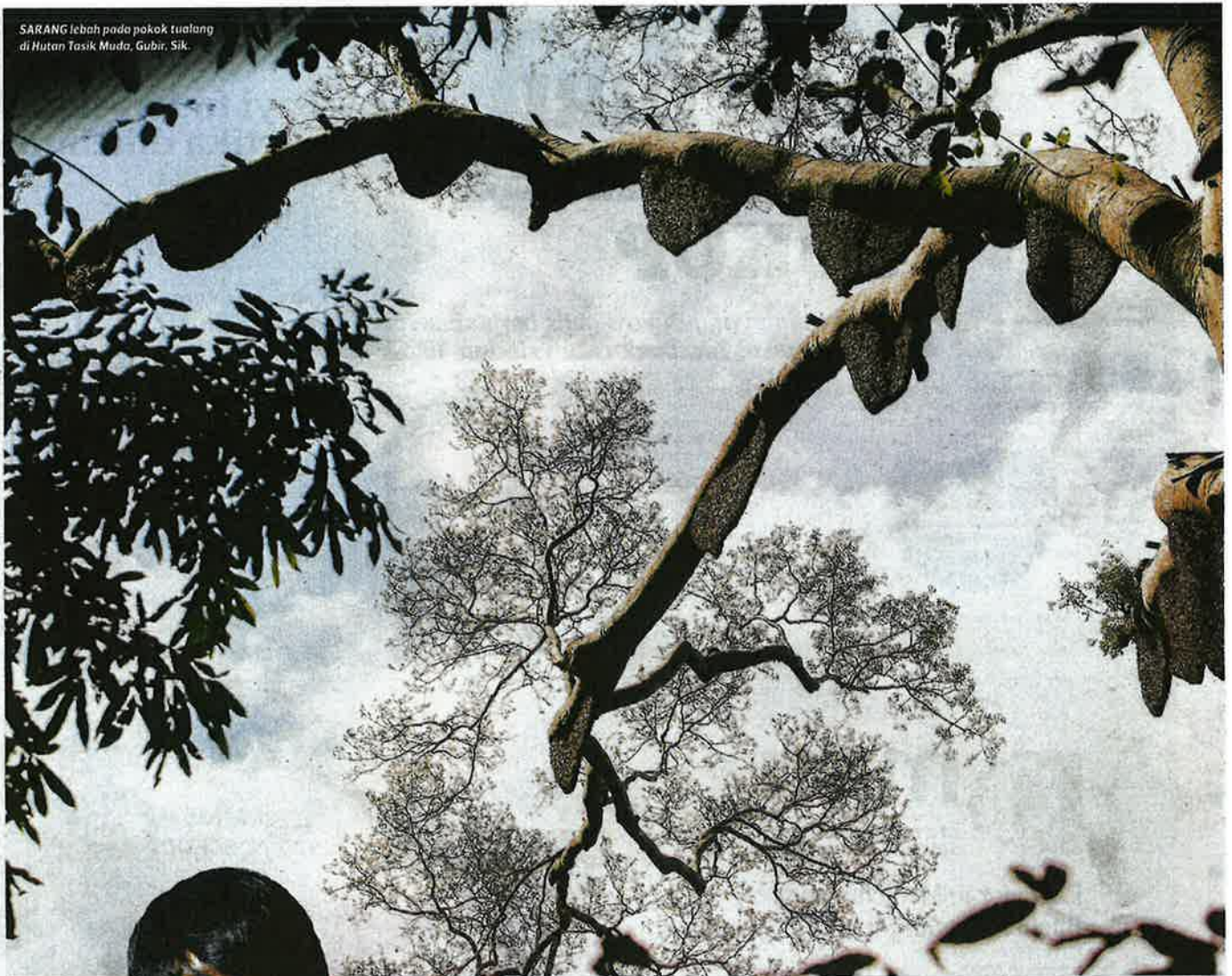
SARANG lebah pada pokok tualang di Hutan Tasik Muda, Gubir, Sik.