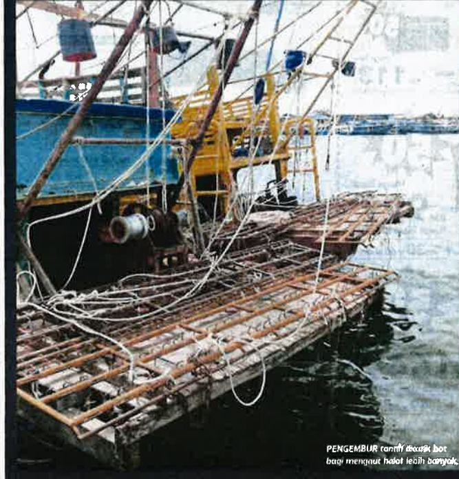
PENGEKEMUR rajam dapat lebih banyak bagi mengaut hasil lebih banyak.

Penggunaan tangkuk besi boleh merosakkan batu karang yang menjadi habitat hidupan marin. Lebih menyedihkan lagi, ada seseneng spesies batu karang yang memerlukan masa ratusan tahun untuk membesar, musnah begitu