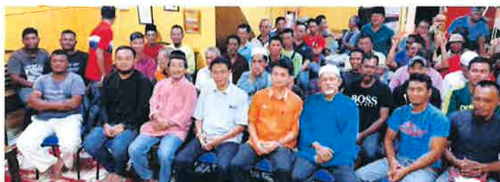
Sesi dialog bersama nelayan DUN Benut di Pekan Benut kelmarin.

Antara isu yang mendapat perhatian ialah lesen nelayan memandangkan masih ramai tidak mempunyai lesen turun ke laut demi mencari rezeki.