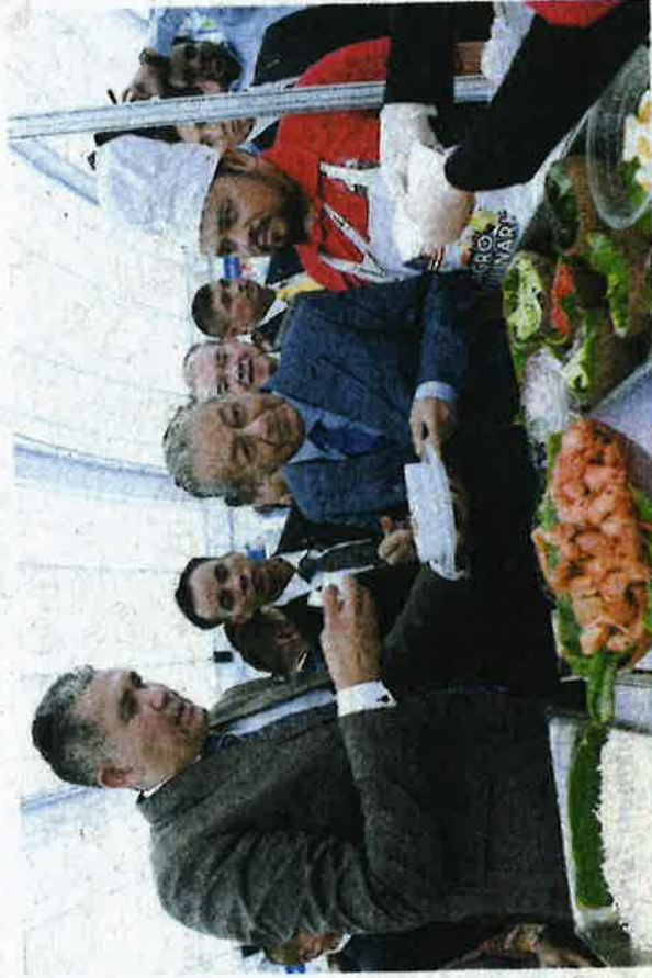
DR. MAHATHIR mencuba makanan Malaysia yang dipamerkan di Malaysia Fest 2019 di Dataran CentralWorld, Bangkok semalam.

Terdahulu, Dr. Mahathir melancarkan Malaysia Fest 2019 yang mengetengahkan makanan, barangan dan persembahan kebudayaan terbaik Malaysia di Dataran CentralWorld di sini.