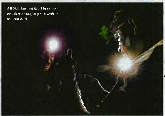
ABDU: Samad tak l bersiap untuk memanjat pada waktu malam hari.