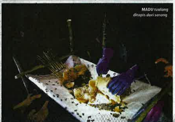
MADU tuolang ditapis dari sarang.