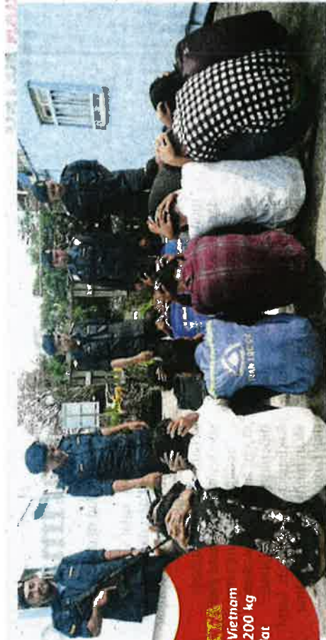
Tiga bot Vietnam bawa 2,200 kg balai

"Ketiga-tiga bot bersama semua nelayan Vietnam dibawa ke Jeti Sabah Port Kudat sebelum diserahkan kepada