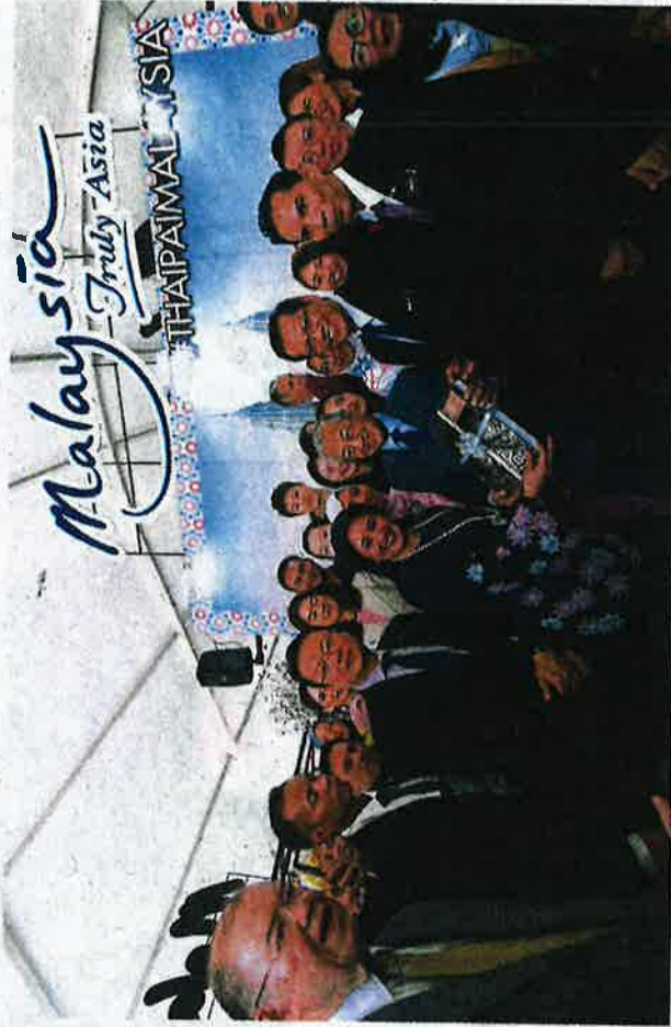
All smiles: Dr Mahathir receiving a copy of 'Plaited Arts from the Borneo Rainforest' after launching the inaugural Malaysia Fest 2019 in Bangkok. — Bernama

"We expect more local and foreign tourists to flock to the Malaysia Street Food Lover programme this weekend," he said. — Bernama