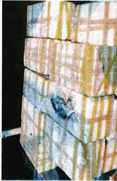
Kotak polisterin yang mengandungi benih udang kara.