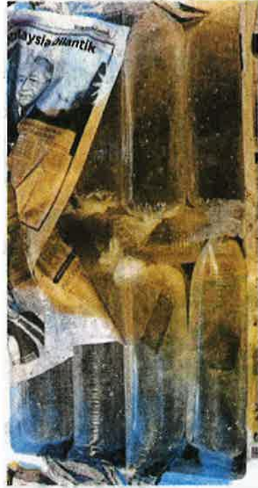
BENIH udang kara yang cuba diseludup dirampas APMM.

Batu Pabat: Agensi Penguatkuasaan Maritim Malaysia (Maritim Malaysia) Zon Maritim Batu Pabat menahan dua individu dan merampas 19 kotak polisterin mengandungi 45,000 benih udang kara disyaki cuba diseludup masuk di Sungai Muar, kelmarin. Pengarahnya, Komander