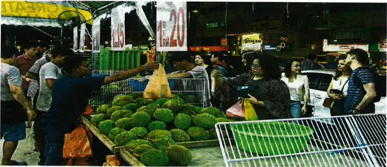
Customers choosing fruits priced from RM2 to RM25 each at SS2 Durian House.