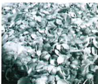
捞上岸的蚶空壳占了70%。