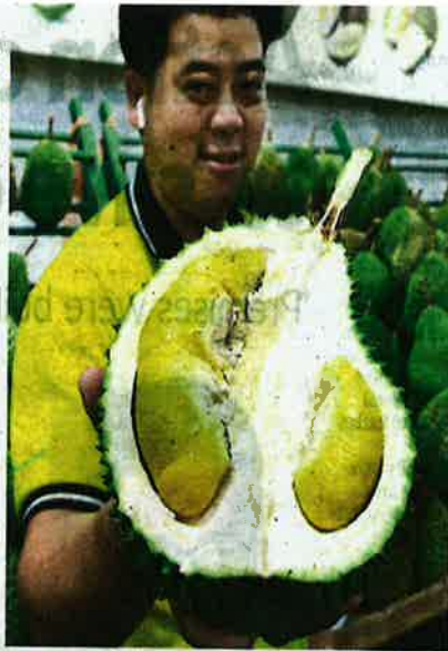
The Musang King variant is currently more affordable with some stalls selling them for as low as RM28 per kg.