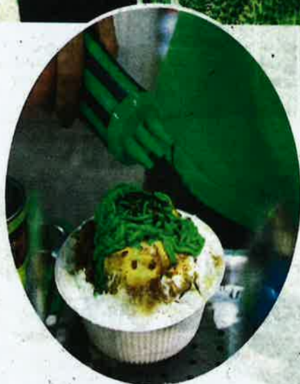
A worker preparing durian cendol. Other desserts like durian ice kacang, ice cream and smoothies are just as popular. (Right) Durian stalls are often packed with customers after working hours as some prefer to enjoy the fruit for dinner or have it as dessert.