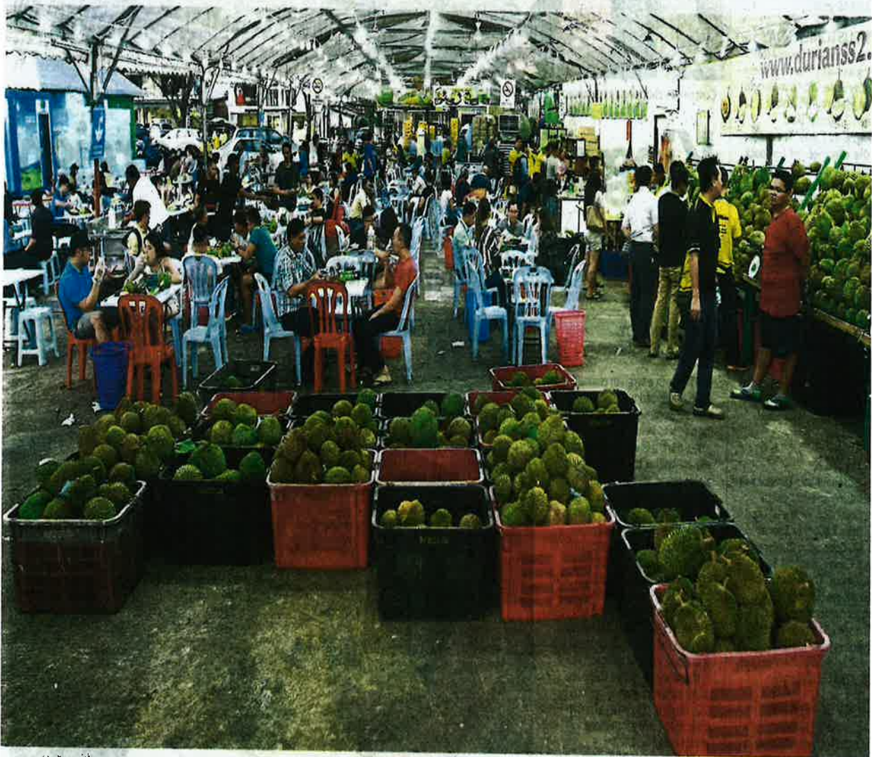
Durian windfall: It is not the peak season yet but people are already swarming stalls around SS2, Petaling Jaya to savour their favourite delicacy.

Bumper-to-bumper congestion is no deterrent to durian lovers in search of new variants and low prices in SS2, Petaling Jaya. >2&3