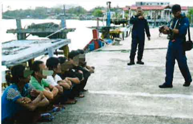
PEN DATANG asing tanpa izin warga Myanmar yang ditahan dalam pemeriksaan di sebuah sangkar ikan di perairan Kuala Gula.