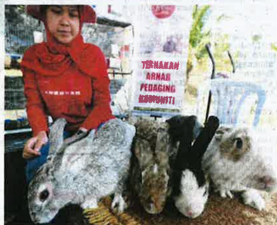
Penternakan arnab antara Program Pembangunan Peneroka diperkenalkan kepada peneroka FELDA.

J: Bukan semua, ada rumah lagi besar misalnya di Johor. Lagi cantik sebab mereka berjaya. Mereka menggunakan hasil daripada penat lelah memperbesar rumah demi kesselesaan anak. Jadi itu sebab, kalau di Johor, kebanyakan mereka dari negeri itu tidak seperti di FELDA Jengka. Setiap tempat berbeza pemikiran atau psikologi. Mustahak kita kaji dan pastikan mengapa sesetengah tempat itu kurang hasil.