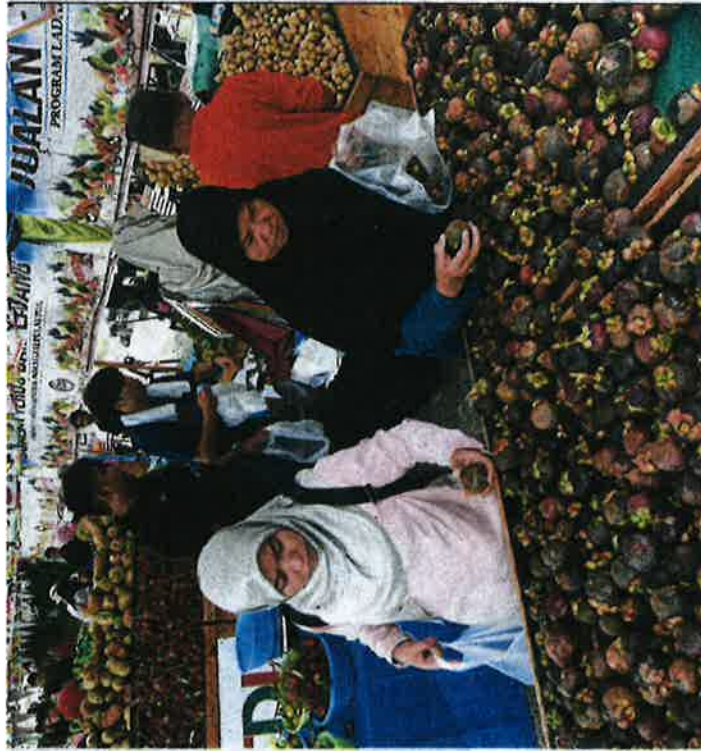
Healthy move: Visitors buying fruits during the launching of 'Eat More Local Fruits' campaign at Tapak Ekspo, Seberang Jaya.

The event at the Seberang Jaya Expo Site saw farmers selling fruits