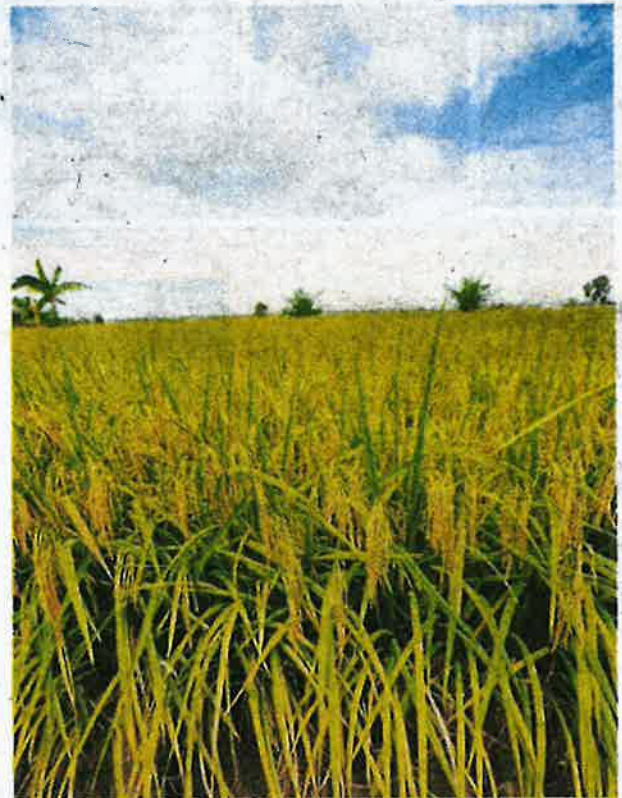
Bernas has given its assurance that the supply of rice will always be on the company's top priority list. FILE PIC

LPN is a state entity established in 1971 that was authorised to regulate the padi and rice sector in the country.