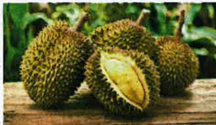
DURIAN yang dianggap sebagai Raja Buah mempunyai ramal penggemar di negara ini. - Gambar hiasan

"Antara yang paling utama tentulah aktiviti berkaitan durian seperti penjualan durian dengan harga runtuh, demonstrasi memasak, lelongan durian terbaik dan penjualan produk berasaskan durian.