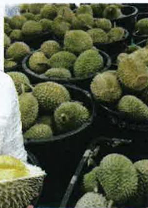
Aktiviti ekeport durian Malaysia ke pasaran China berpotensi membantu meluaskan pasaran produk berassakan durian tempatan ke peringkat pasaran global.

Salahuddin berkata, pasaran tempatan untuk durian musang king juga tidak akan terjejas meskipun diekspor ke China, malah pasaran durian tersebut lebih meluas bagi produk hillran berassakan