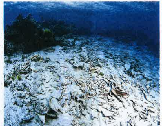
In ruins: Degraded corals from fish bomb activities in Sabah waters.

"Divers must take extra precaution to look around their sea surface and place a buoy to inform others that diving activities are taking place," he said.