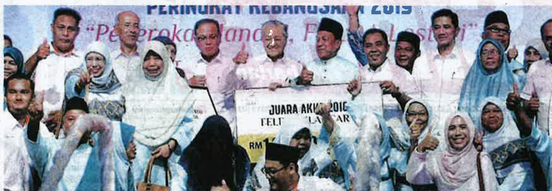
Dr Mahathir (tengah) bersama pemenang Anugerah Keceriaan Kampung Felda (AKKF) pada majlis Sambutan Hari Peneroka Felda 2019 bertemakan 'Peneroka Mandiri, Felda Lestari' di Felda Selancar 3, Rompin semalam.

"Apabila harga kelapa sawit dan getah jatuh, kita masih memperoleh pendapatan daripada tanaman lain ini. De-