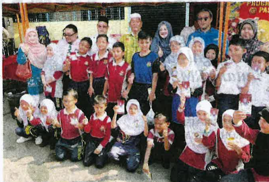
Seramai 25 murid dari golongan B40 diberi peluang merasai buah-buahan percuma di Pasar Tani Sungai Petani semalam.

"Kita mengalu-alukan orang ramai untuk datang dan memeriahkan program pada Sabtu dan Ahad depan bagi mendapatkan buah-buahan segar dengan harga lebih rendah daripada pasaran," katanya ketika