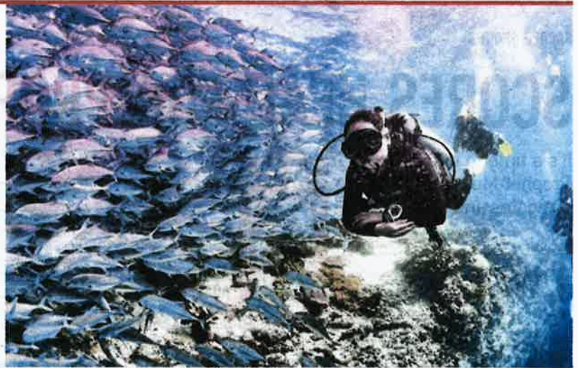
Divers get to see a wonderful display of marine life in Semporna.

"It saddens me that lives were taken due to this irresponsible act of fish bombing, which is il-