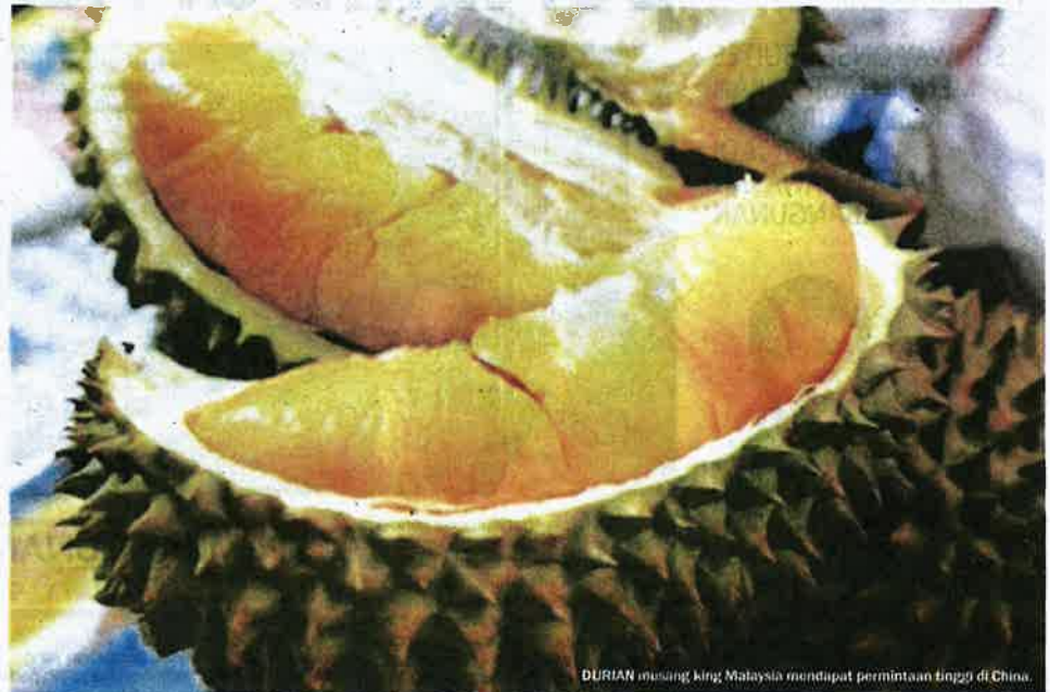
DURIAN musang king; Malaysia mendapat permintaan tinggi di China.