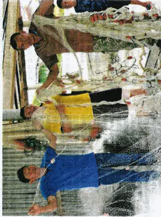
TIGA nelayan memuntahkan pukat mereka yang rosak akibat aktiviti bot siput retak seribu dan siput retak seribu dipercayai dari Kedah dan Thailand yang menceroboh ke kawasan penangkapan ikan di Kuala Sungai Baru, Arau, Perlis, semalam.

"Kadang-kala kami balik tangan kosong apabila tiada hasil tangkapan. Meskipun bot berkenaan tidak dibe-