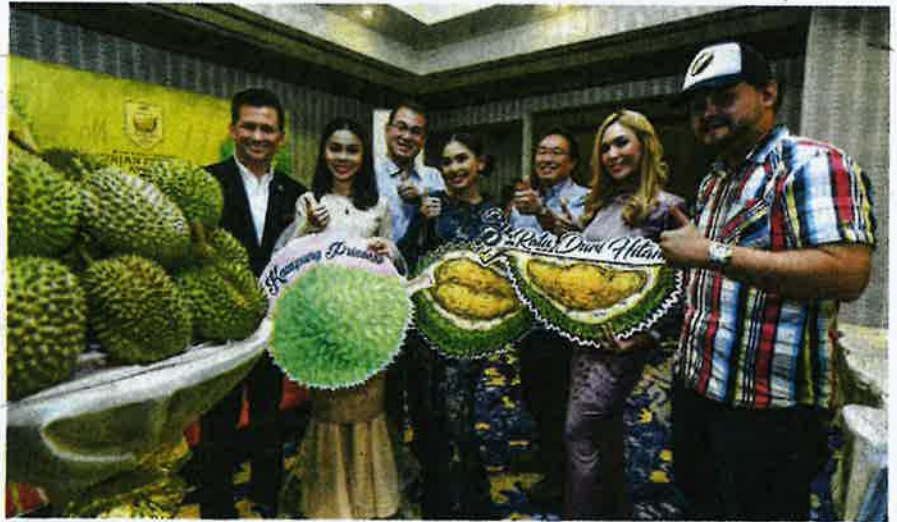
BARISAN artis yang hadir pada Festival & Anugerah Durian Bangi Golf Resort di Bangi tahun lalu.

“Bangi Golf Resort kini dalam proses membangunkan hab durian sepanjang tahun tanpa mengira musim dengan mewujudkan muzium durian, produk agro pelancongan dan pusat penyelidikan durian,” katanya menerusi kenyataan akhbar yang dikeluarkan di sini baru-baru ini.