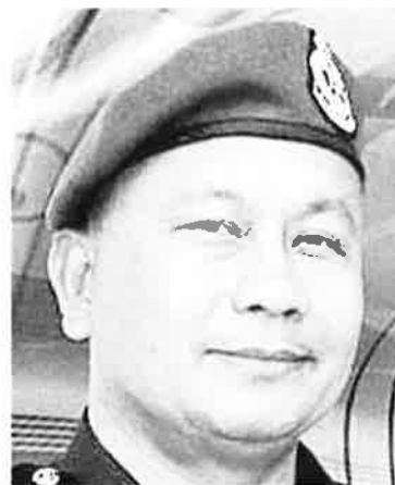
ACP Mohamad Pajeri

This is to ensure criminal activities do not escalate.