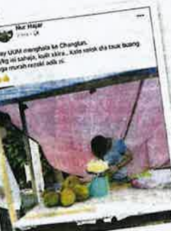
Gambar Mohd Izzuwan sedang membuka buah durian untuk diisi ke dalam bekas yang tular di media sosial.

Usaha Mohd. Izzuwan yang juga seorang mekanik motosikal itu mendapat pujian orang ramai