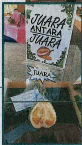
←陈家的浮罗“黑刺”夺得2019年榴梿“冠中冠”。