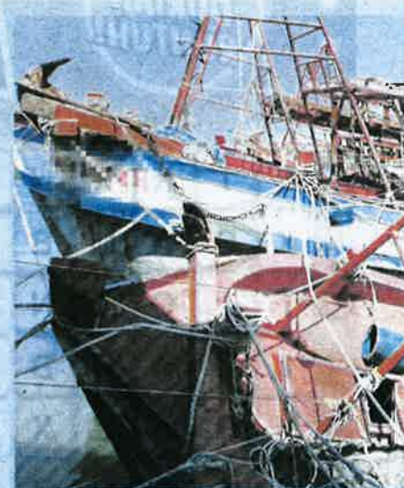
BOT dari Terengganu yang dijaja di Vietnam.

DUA jenis nombor pendaftaran bot - satu Malaysia dan satu lagi Vietnam.