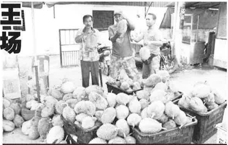
太平峇都古劳是我国著名榴槤产区，每年的榴槤季节，都有不少的榴槤老饕前来选购美味甘榜榴槤。

“预计两年后将有一定数量的猫山王榴槤，将会国内外市场，基于峇都古劳的联邦农会到暂局设有冷冻设备，届时可将果肉成块或榴槤冷冻出口至中国。”