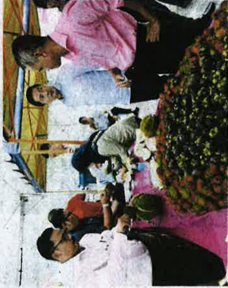
PELABAGAN buah-buahan bermaksud disediakan untuk pengunjangan pada Majlis Sambutan Ulang Tahun Ke-25 Bernas

ESMAIL beramah mesra dengan tetamu yang hadir.