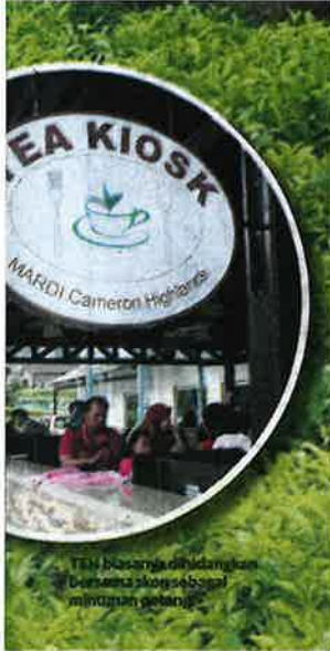
Teh biasanya ditudangkan bersama roti sebagai minuman petang.