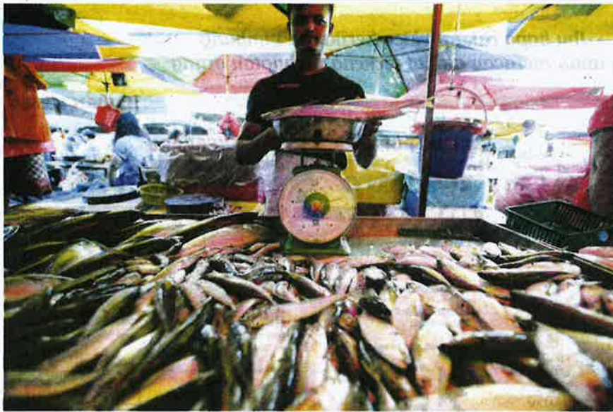
PENDAPATAN sektor perikanan mencecah RM8 bilion setahun.