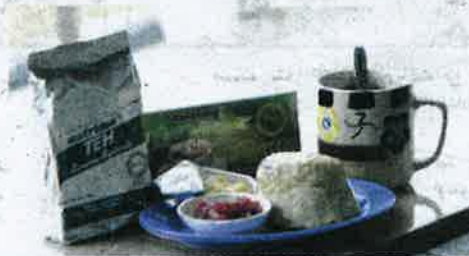
KIOS di TATMCH menyediakan akon untuk dinikmati bersama teh.

Camellia sinensis var assamica . Antara teh-teh tersebut adalah seperti Betjan , Charali , Dangri , Dhonian dan Rajghur yang namanya diambil dari kawasan ia diperoleh atau ditanam di Assam.