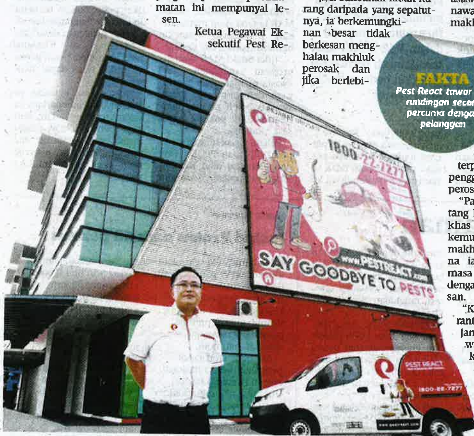
LOW menawarkan perkhidmatan kawalan serangga perosak berlesen.

Pest React tawar sesi rundingan secara percuma dengan pelanggan