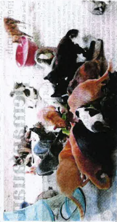
Tanggungjawab memelihara haiwan adalah besar, termasuk memastikan makam dan minum dijaga rapi serta mengambil berat soal kesihatan. (Foto hiasan)

Seksyen 30 Akta Kebajikan Haiwan 2015 menetapkan individu yang disabitkan kesalahan boleh dikenakan hukuman tiga tahun penjara, denda antara RM20,000 dan RM100,000 atau kedua-duanya sekali. Seksyen 423 Kanun Keseksian pula menetapkan hukuman penjara atau denda atau kedua-duanya, dengan jumlah denda mengikut budi bicara hakim. Saya percaya tiada lagi alasan