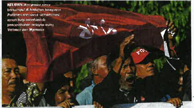
NELAYAN dari pantai timur berkumpul di hadapan bangunan Parlimen menuntut demonstrasi aman bagi membantah pencerobohan nelayan asing Vietnam dan Myanmar.

"Mana-mana lesen atau pukat tidak munasabah saya akan rampas dan batalkan. "Yang tempatan pun sama mana-mana pencerobohan ke zon lain (tidak ikut lesen) jika ditahan memang tidak ada ampun lagi," katanya.