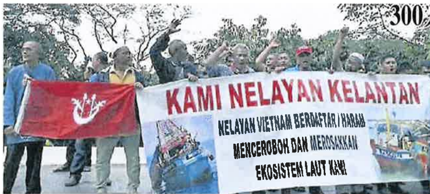
逾 300 渔民在国会外拉横幅，表达不满。