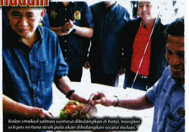
Kalau smoked salmon sentiasa dihidangkan di hotel, mungkin selepas ini tuna steak pula akan dihidangkan secara meluas.

Tahun lepas, pendaratan ikan tuna dalam negara ialah sebanyak 100,000 tan metrik. Kita unjurkan menjelang tahun 2020, jumlah ini berupaya ditingkatkan kepada 130,000 tan metrik bernilai RM 1 bilion.