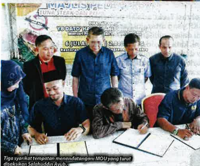
Tiga syarikat tempatan menandatangani MOU yang turut disaksikan Salahuddin Ayub.