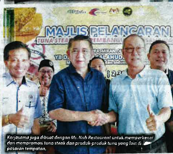
Kerjasama juga dibuat dengan Mr. Noh Restaurant untuk memperkenalkan dan mempromosi tuna steak dan produk-produk tuna yang lain di pasaran tempatan.