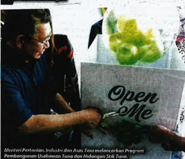
Menteri Pertanian, Industri dan Asas Tani melancarkan Program Pembangunan Usahawan Tuna dan Hidangan Stik Tuna.