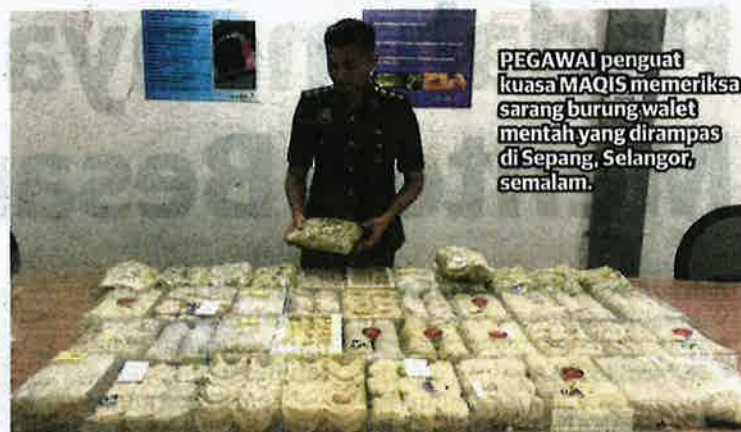
PEGAWAI penguat kuasa MAQIS memeriksa sarang burung walet mentah yang dirampas di Sepang, Selangor, semalam.