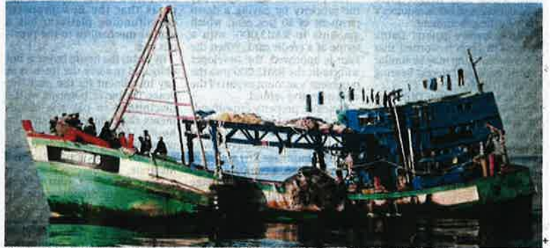
The three areas in the region prone to illegal fishing are the Gulf of Thailand, Indonesian waters and within the exclusive economic zone of Malaysia.

Since 2006, Malaysia has seized 748 vessels and detained 7,203 fishermen from Vietnam fishing