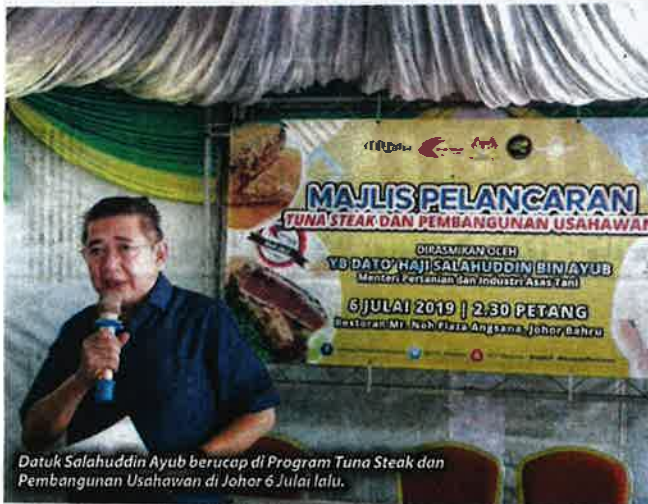
Datuk Salahuddin Ayub berucap di Program Tuna Steak dan Pembangunan Usahawan di Johor 6 Julai lalu.