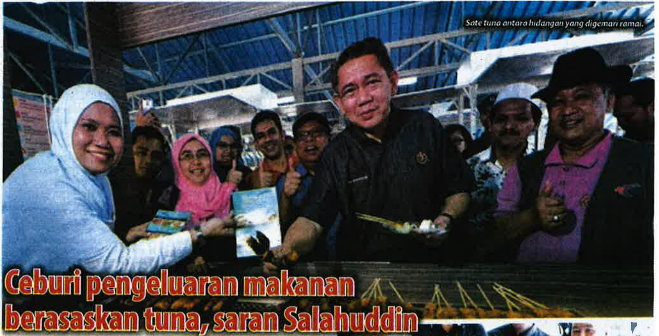
Sote tuna antara hidangan yang digemari ramai.