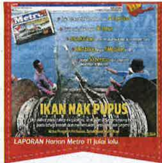
Semenanjung dan barat laut Sarawak dan Sabah.

Persoalannya, mengapakah isu ini seolah-olah tiada penghujung? Tidak mampukan kita cari penyelesaian terbaik demi menyelamatkan perairan negara dan memastikan sumber laut perairan khusus menjadi milik nelayan tempatan?