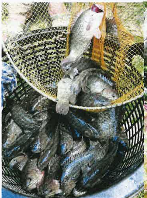
IKAN puyu baka Chumphon F1 dari Thailand yang dikomersialkan Mohd Izzat lebih tebal isinya.