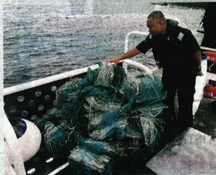
Antara bubu naga dirampas APMM Kedah dan Perlis kira-kira 1.2 batu nautika barat laut Pulau Rebak Besar semalam.

Orang ramai boleh menghubungi talian kecemasan 24 jam MERS 999 atau Pusat Operasi Maritim Malaysia Langkawi di talian 04-9662750 untuk memberi maklumat jenayah berkaitan.