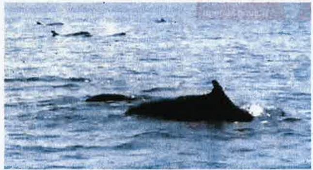
Lana orang awam merakam sekumpulan paus pilot sirip pendek sedang berenang berhampiran Pulau Perhentian di perairan Besut, Terengganu kelmarin.

"Kebiasaannya spesies itu sentiasa bergerak dalam kumpulan populasi antara 10 ekor hingga 50 ekor.