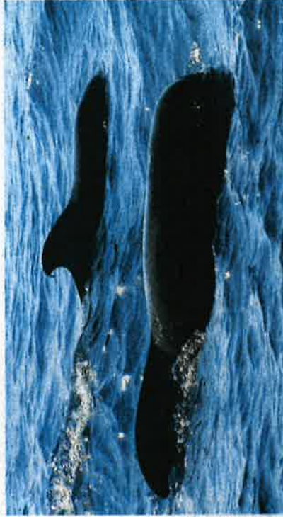
SEBAHAGIAN daripada sekumpulan ikan paus pilot sirip pendek yang ditemui di perairan Besut berhampiran Pulau Perhentian pada Rabu lalu.