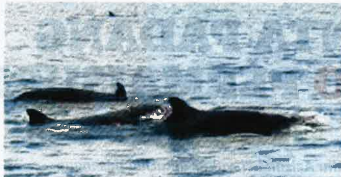
KUMPULAN paus pilot sirip pendek yang ditemui pemancing di perairan Pulau Perhentian, Besut.