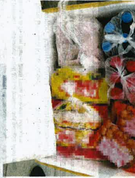
Sebahagian produk hasilan babi dirampas Maqis di Kompleks ICQS Bukit Kayu Hitam pada Jumaat lepas.

"Ia dikuatiri mampu mengakibatkan kerajaan menanggung kerugian yang tinggi jika penyakit ini tidak dikawal dan boleh menjejaskan industri ternakan babi di Malaysia," katanya.