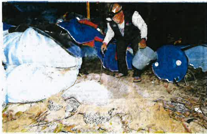
HARON mengutip telur penyu untuk dibawa ke tempat penetasan.