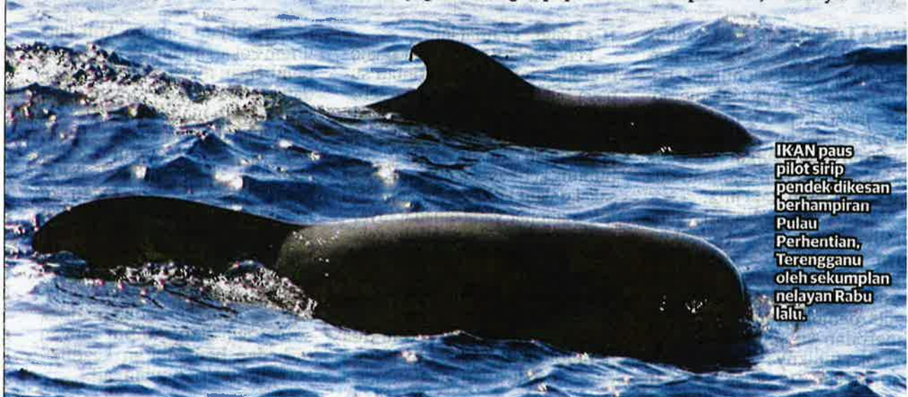
IKAN paus pilot sirip pendek dikesan berhampiran Pulau Perhentian, Terengganu oleh sekumplan nelayan Rabu lalu.

"Seperti di perairan Amerika, populasi paus pilot sirip pendek ini sangat banyak pada musim sotong namun setelah sotong mula berkurangan, paus pilot sirip pendek ini tidak kelihatan dan bermigrasi mencari tempat baru," katanya.