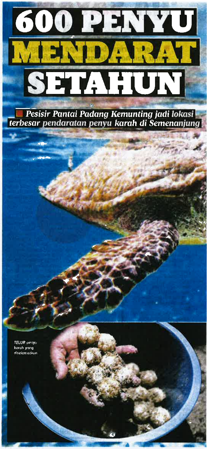
TELUR penyu karah yang diselamatkan

membantunya mengesan lokasi penyu bertelur. "Sebelum menjadi renjer saya tiada peisedahan dan maklumat mengenai ancaman yang dihadapi penyu karah, tetapi kini keselamatan telur penyu menjadi keutamaan. "Berkalkikan maklumat yang ada, saya sampai dan terangkan kepada penduduk betapa bernilainya telur penyu pada masa akan datang," katanya. Dia yang ditugaskan mengutip telur penyu di kawasan Tanjung Dahan, Kuala Sungai Baru, berkata, dia hairan walaupun permintaan telur penyu kini sudah tiada, tetapi masih ada pencari telur haram aktif berbuat demikian sehingga telur terbuang begitu sahaja