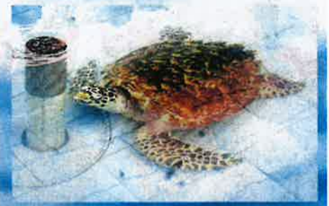
PENYU karah yang ditempatkan di Pusat Konservasi dan Penerangan Penyu di Padang Kemunting, Masjid Tanah.

Beliau turut mengingatkan nelayan supaya tidak memasang jaring pekap dan pukat rawai dalam tempoh pendaratan penyu kerana ia bukan sahaja boleh mencederakan haiwan berkenaan malah membunuhnya.