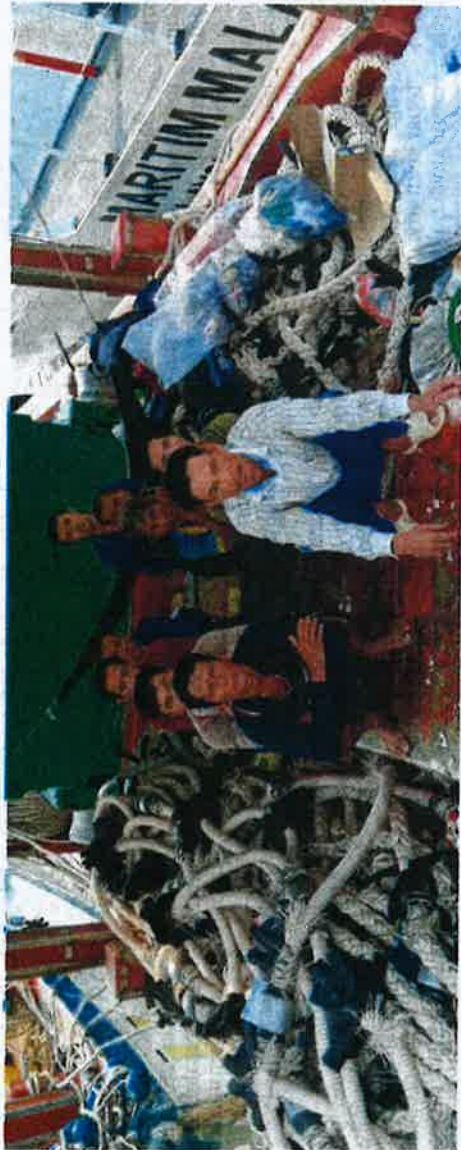
EBAHAGIAN nelayan Vietnam yang ditahan Maritim Malaysia dalam Op Iman di kedudukan sekitar 104 hingga 109 batu nautika timur laut Kuala Kemaman, Terengganu, semalam.

Oleh MUKHATAR A. RAHMAN mukhtar@gmail.com