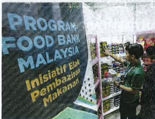
Akta khas yang dibentang di Dewan Rakyat akhir tahun ini, akan melindungi penaja dan penderma Program Food Bank Malaysia.

Kuala Lumpur: Penaja, penderma dan pihak berkaitan Program Food Bank Malaysia akan dilindungi dengan akta khas apabila rang undang-undang mengenainya dibentangkan di Dewan Rakyat, akhir tahun ini.