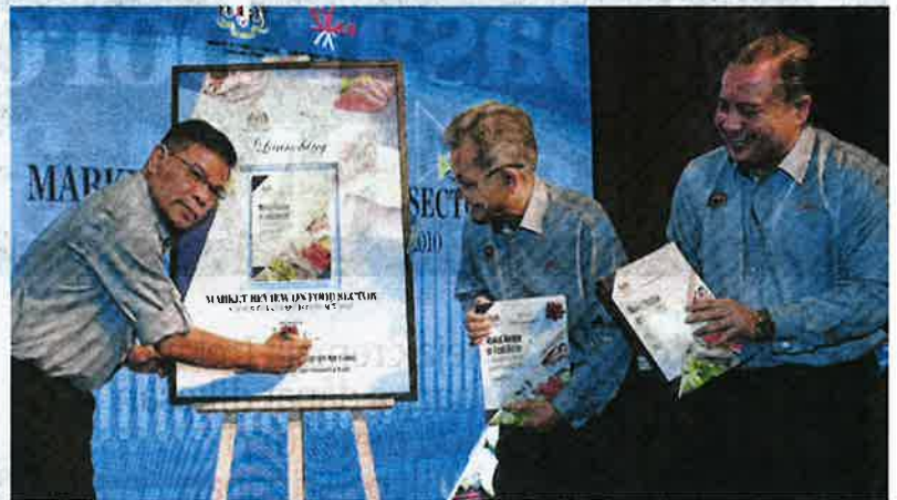
Saifuddin Nasution melancarkan Buku Laporan Suruhanjaya Persaingan Malaysia (MyCC) di Pusat Timbang Tar Antarabangsa Asia (AICTD), Kuala Lumpur, semalam.