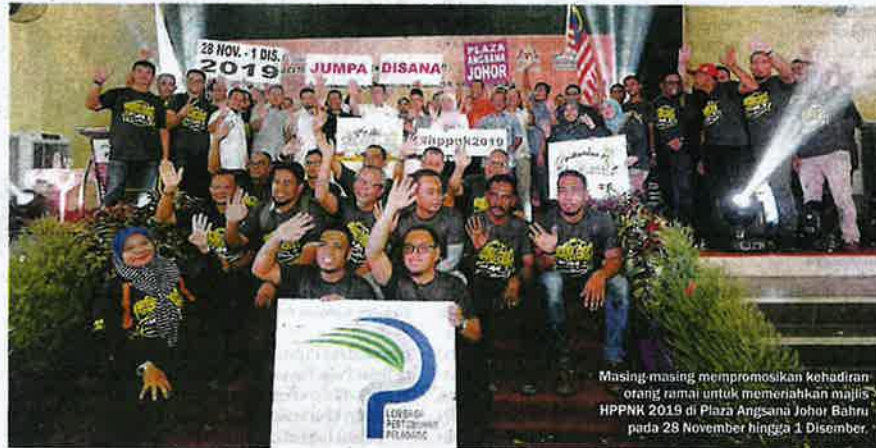
Masing-masing mempromosikan kehadiran orang ramai untuk memiahkan majlis HPPN 2019 di Plaza Angsana Johor Bahru pada 28 November hingga 1. Disember.

Menghadapi persaingan global yang semakin sengit,