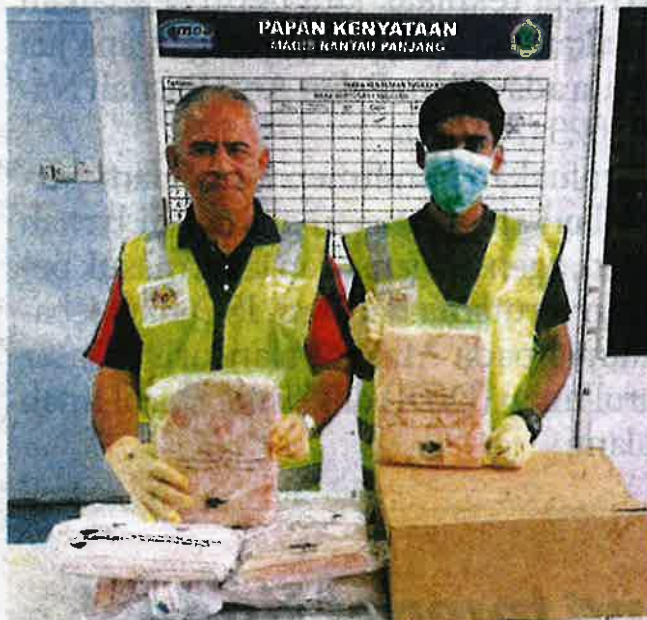
Kakitangan Maqis menunjukkan ayam sejuk beku yang dirampas oleh PGA di Jeram Perdah.

Katanya, rampasan dibuat ketika Op Wawasan yang dijalankan berhampiran pangkalan haram Jeram Perdah dekat sini.