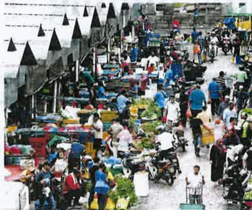
Pekerja asing ambil kesempatan berniaga di Pasar Borong Selayang.

ada pekerja asing yang tidak berlesen atau tidak menyewa tapak menjual ikan di tepi jalan dengan harga empat kali lebih murah berbanding di pasar utama.