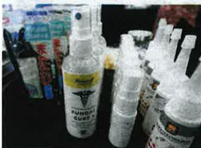
PRODUK kesihatan untuk kucing turut dijual.