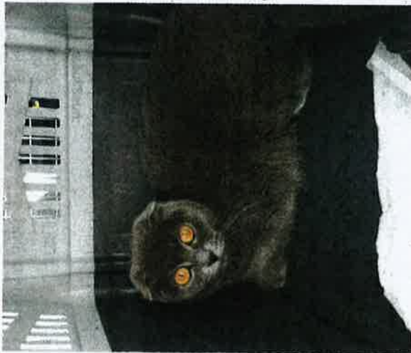
SEEKOR kucing baka British short hair ditahan Maqis di Kompleks Kargo KLIA, Sepang pada 1 Ogos lalu.