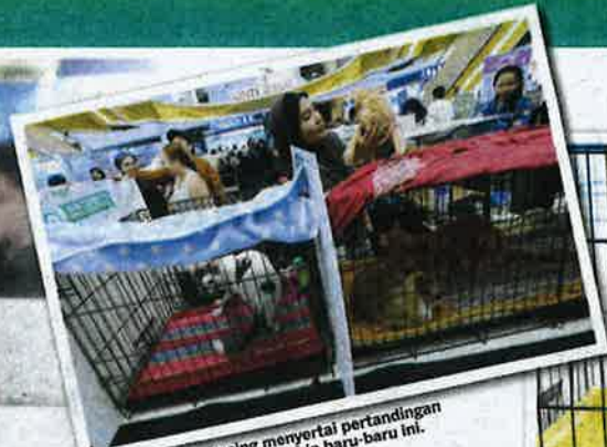
LEBIH 140 ekor kucing menyertai pertandingan National MEOW Championship baru-baru ini.