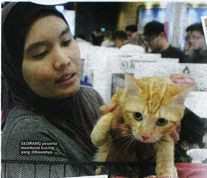
SEORANG peserta membelai kucing yang dibawanya.