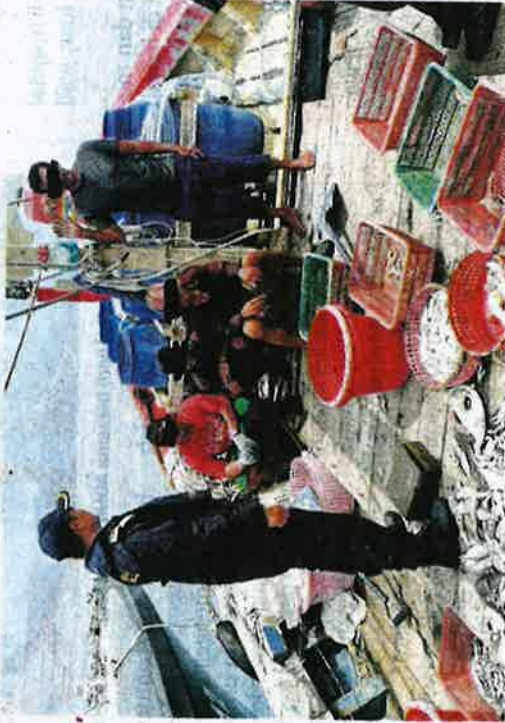
Nelayan Thailand ditahan untuk siasatan kerana melanggar syarat sah lesen.

"Mereka boleh menghubungi talian kecemasan 24 jam iaitu MERS 999 atau Pusat Operasi Maritim Negeri Pulau Pinang di