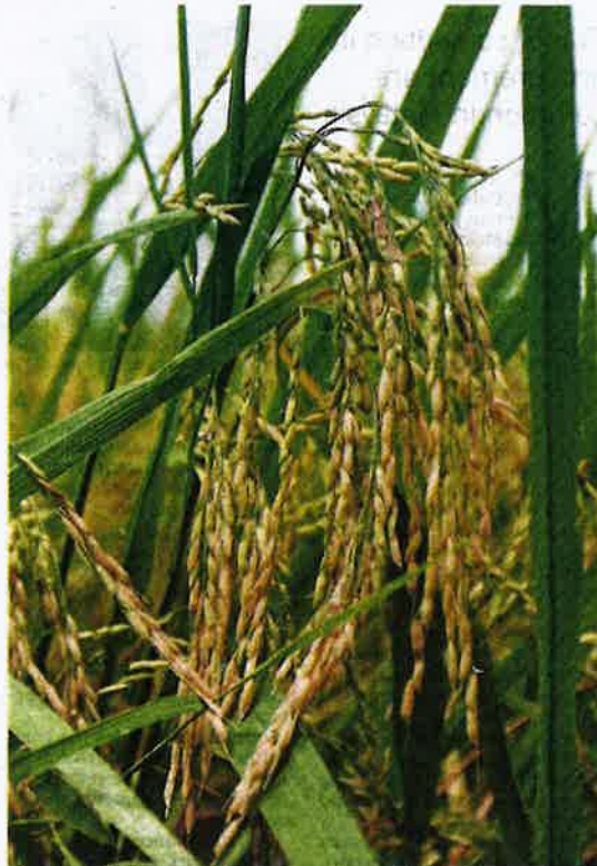
Genetic-modification technology can be used by plant researchers to create productive, nutritious or hardy crops.

A holistic research is therefore needed to consider long-term real field conditions, with comparisons with other production systems, such as integrated pest