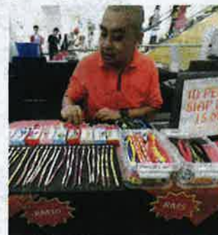
AKSESORI untuk kucing turut dijual pada pertandingan tersebut.

"Seperti yang kita ketahui, kebanyakan kucing-kucing yang menyertai sesuatu pertandingan adalah daripada baka-baka kacukan dan juga luar. Sebenarnya kucing daripada baka tempatan juga sangat comel jika dijaga