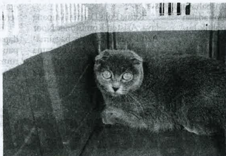
Kucing baka British short hair yang didapati dibawa masuk ke negara ini menggunakan permit import mengelirukan.

Jabatan Perkhidmatan Kuarantin dan Pemeriksaan Malaysia (Maqis) menahan seekor kucing baka British short hair di Kompleks kargo Lapangan Terbang Antarabangsa Kuala Lumpur (KLIA) susulan menggunakan permit import mengelirukan Khamis lalu.