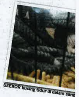
SEORANG kucing tidur di dalam sangkang.

Bagi kategori bulu pendek daripada Adult Open Shorthair