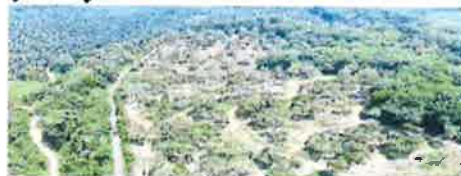
■主，也作出好成績。金馬揚種植園種植山