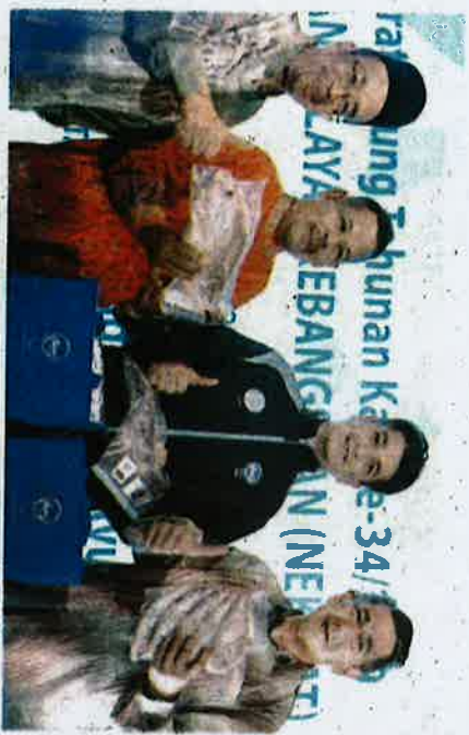
Mesyuarat Agung Tahunan Nekmat Kali Ke-34 dirasmikan oleh Menteri Pertanian dan Industri Asas Tani, Datuk Salahuddin Ayub 30 Julai lalu.