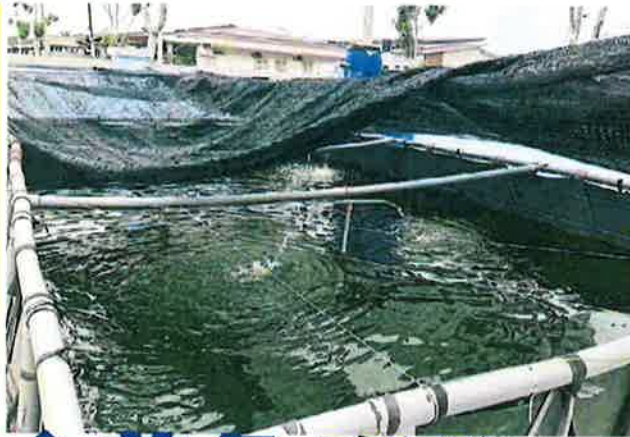
■室內外種植業風險低，非常適合作小園主第二事業。