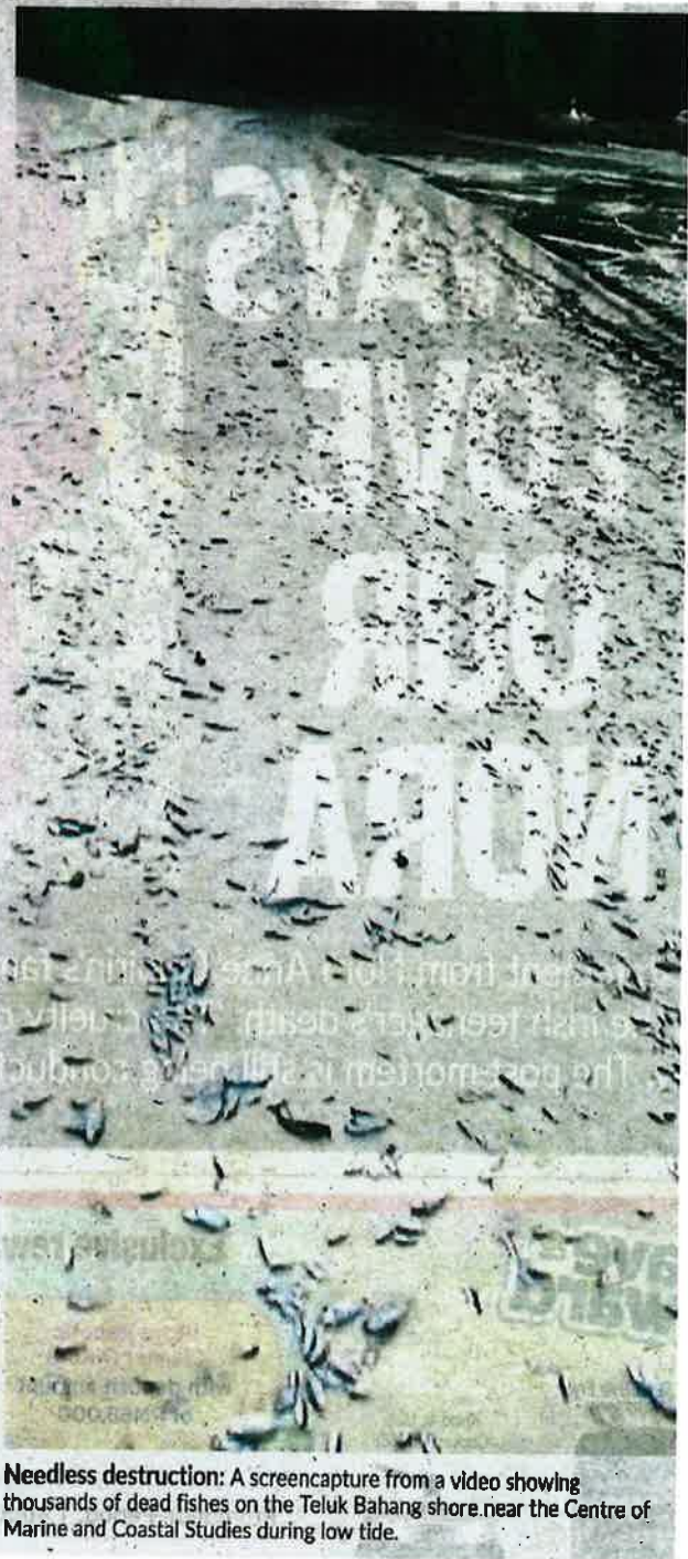
Needless destruction: A screencapture from a video showing thousands of dead fishes on the Teluk Bahang shore near the Centre of Marine and Coastal Studies during low tide.

She said sediment and sea water samples were now being tested for heavy metal, but initial checks suggested that the fish died from organic pollution at an extreme scale.