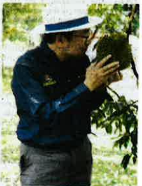
Tze Tzin tertarik dan mencium durian yang ditanam di ladang berkenaan.