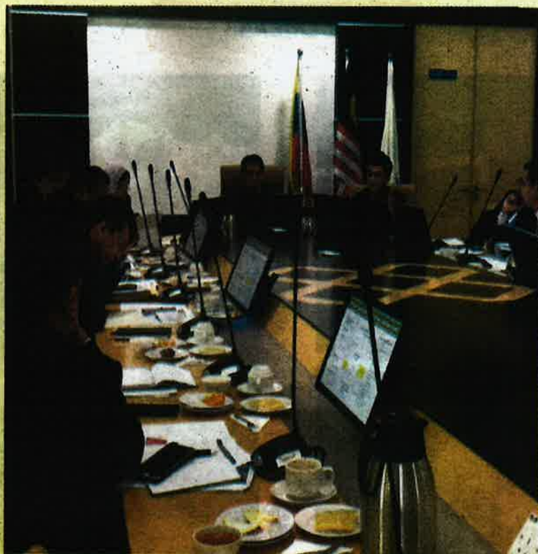
Mesyuarat melibatkan LKIM, LPP dan FAMA bagi mencari pendekatan bersepadu ringankan beban rakyat.

"Semoga usaha kerajaan PH dengan sokongan pegawai dan kakitangan agensi MOA ini dipermudahkan dan dirahmati," tambahnya.