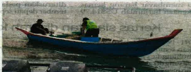
PPM Pelabuhan Klang mengesan kegiatan penggunaan pukak bubu naga oleh nelayan warga asing.

"Tangkapan dibuat di perairan Sungai Kuala Selangor kira-kira jam 10 pagi kelmarin susulan pemeriksaan sebuah bot penumpang," katanya.