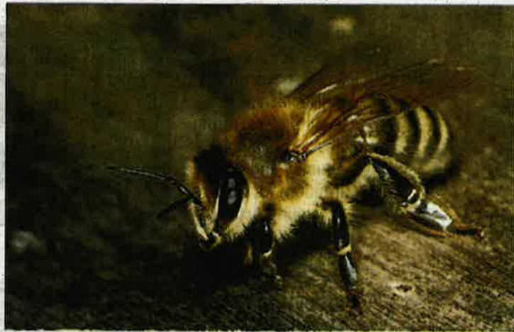
Preserving our forests and harvesting the stingless bees in a sustainable manner will ensure the honey produced by these bees to be a lucrative industry.

They are known locally as lebah kelulut (genus Heterotrigona , family Apidae — and a close rela-