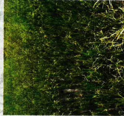
ANAK pokok padi tidak mengeluarkan hasil selepas diserang tikus dan haiwan perosak lain sejak dua bulan lalu.