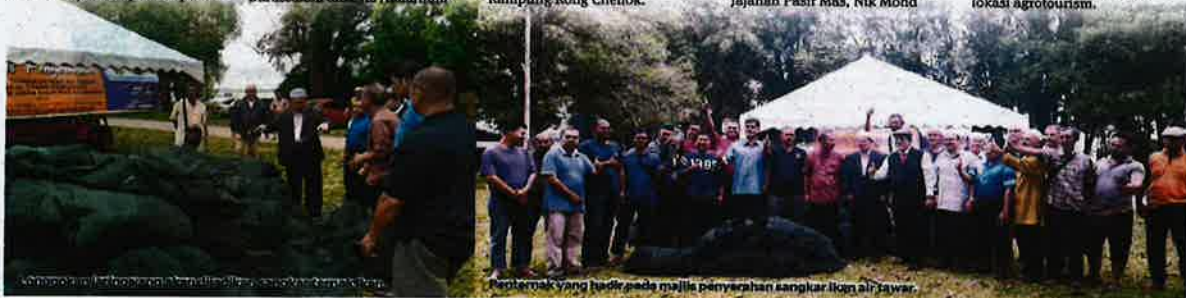
Penternak yang hadir pada majlis penyerahan sangkar ikan air tawar.

Sebelum ini anggota Exco terlibat juga melepaskan anak ikan ke danau tersebut. Di Rong Chenok pula terdapat ternakan rusa yang menjadi lokasi agrotourism.