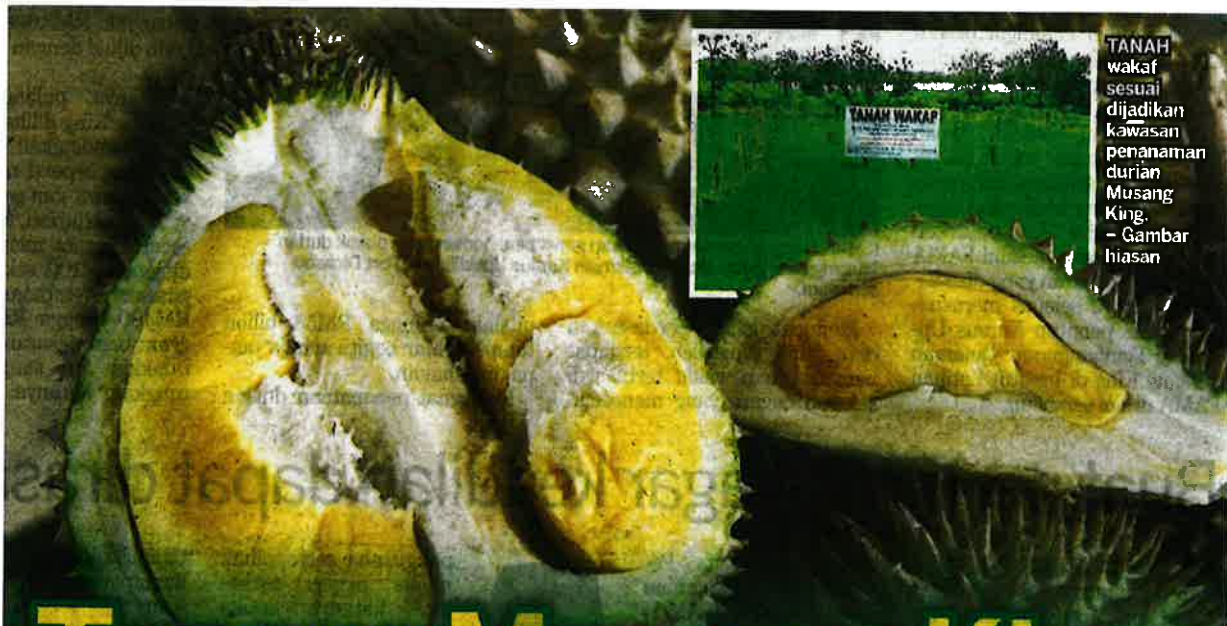
TANAH wakaf sesuai dijadikan kawasan penanaman durian Musang King. - Gambar hiasan