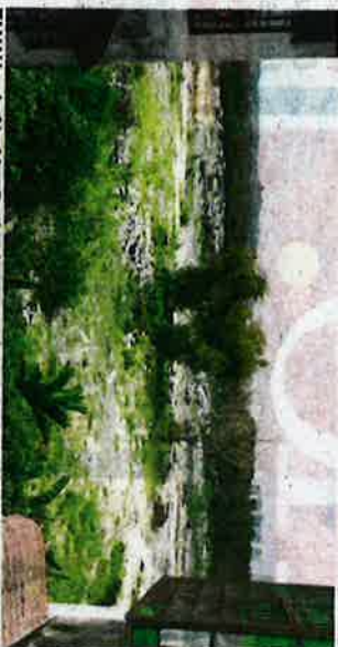
TANAH wakaf terbiar di seluruh negara bakal dibangunkan oleh FAMA untuk ditanam dengan pokok durian Musang King.

"Kita mahu jadikan tanah wakaf itu sebagai tapak pertanian yang diusahakan oleh penanam muda dan hasil yang diperoleh nanti kita akan pastikan ke luar sama ada melalui FAMA atau ruang pasaran yang disediakan," katanya selepas merasmikan majlis penutup Kursus Upskilling Pembangunan Tanaman Musang King di Institut Latihan FAMA di sini semalam.