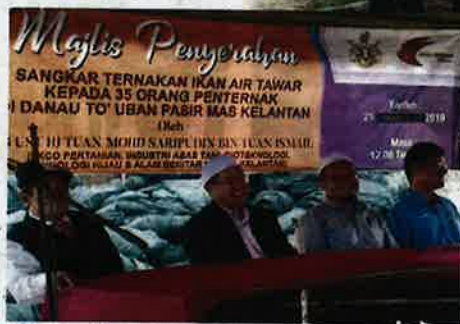
Majlis penyerahan sangkar kepada penternak di Danau To' Uban.

Di Rong Chenok terdapat Masjid Brunei yang tersergam indah menjadi tempat tumpuan