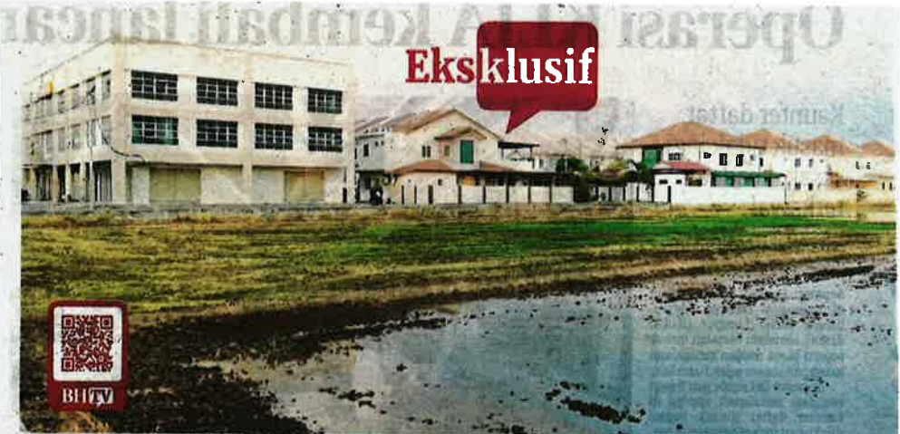
Kawasan sawah di Tanjung Pandang, Parit Buntar yang kini sudah bertukar status kepada tanah kediaman.