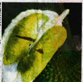
DURIAN Musang King menjadi buruan peminat raja buah kerana rasanya yang enak.