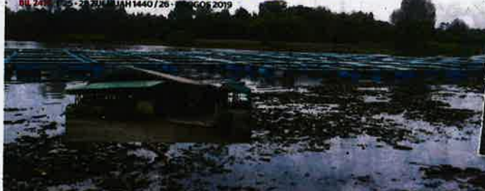
Sangkar ternakan ikan air tawar kawasan di kawasan penduduk To' Uban.

RU 2401 / 15-28 75 / 11440 / 26 / 26 AGOS 2019