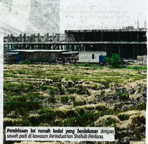
Pembinaan lot rumah kedai yang berdekatan dengan sawah padi di kawasan Perindustrian Shahab Perdana.

nyakit, kawasan padi yang berhadapan laut yang terdedah ancaman air masin juga menyebabkan hasil tanaman terjejas," katanya.