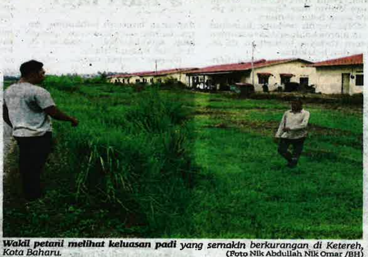
Wakil petani melihat keluasan padi yang semakin berkurangan di Keteleh, Kota Bharu.

pencawang masuk utama (PMU) Sungai Manik ke PMU Kuala Selangor," katanya.