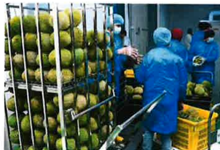
Factory workers at M Durian Fruits Sdn Bhd choosing durians to freeze for export. — Bernama

He said the ministry was optimistic that the durian would be an industry under the New Avenues for Wealth Generation, with exports estimated to reach about RMS00mil a year. — Bernama