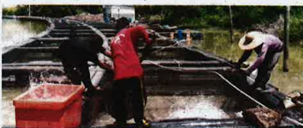
Kerajaan hari ini mengurangkan subsidi sektor perikanan dan kasannya nelayan kita semakin terhimpit.