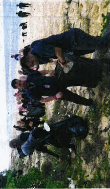
Aktiviti gotong-royong mengutip sampah di sekitar pantai.