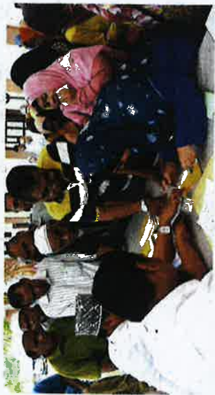
Peserta tanah terkilang sedang menyemak nama masing-masing untuk Jadual 5A mengikut kawasan dan Dun masing-masing.