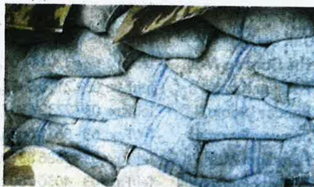
MAQIS merampas biji koko bernilai RM3 juta yang berulat di Pelabuhan Tanjung Pelepas, Johor Bahru pada 19 Ogos lalu.

"Pemeriksaan ketat di pintu masuk negara bagi mengesan kemasukan keluaran pertanian dilakukan secara berterusan bagi menjaga biosekuriti dan keselamatan makanan dalam negara. Ianya juga bagi memastikan tiada penyakit dan perosak masuk dan merosakkan industri tanaman serta menjejaskan ekonomi negara," katanya.