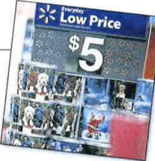
美国新泽西一家沃尔玛门市陈列的圣诞商品。

零售零售商一年来的内忧外患，就已开始大量裁员。根据彭博的统计，去年下半年从亚洲飞往北美的货运增长10%，但美航货运量却下降。今年的增长速度因运力短缺，下半年飞行量下降。 这对中国出口很有感。原本第一季就面临中国生产产能过剩的困境，现在加上全球贸易战，主要出口货物需求下降，运到美国的货物也减少。今年情况大不相同。