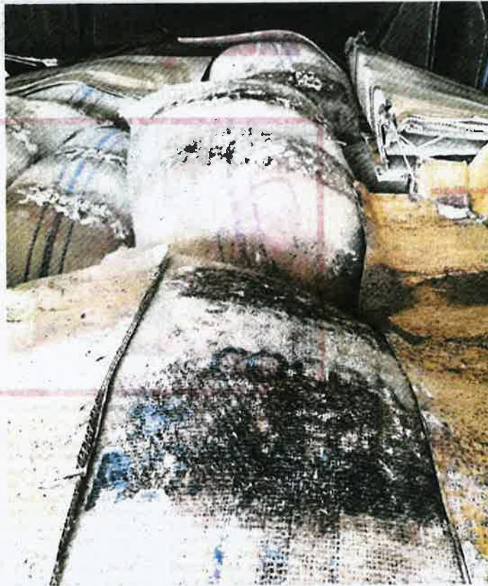
SEBANYAK 253,179 kilogram koko dari Nigeria dirampas Maqis.