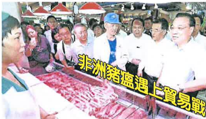
前往菜市场的猪肉摊前，实际询问猪肉价格。中国总理李克强（右）上周到哈尔滨视察猪肉，还特别

猪肉狂涨也引起中国国务院总理李克强关注。他在日前在国务院常务会议提出，要地方政府立即采取超法规措施平抑猪肉价格。李克强在会中强调，猪肉价格上涨对低收入群体影响较大，要特别关注菜篮子产品的保供稳价，保障低收入群体生活。