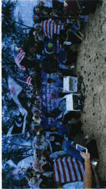
Pelepasan anak penyu turut diadakan.

"Terdapat tiga spesies penyu yang dipelihara di sini antaranya penyu Agar, penyu Karah dan penyu Lipas dengan pelajar diajar cara mencuci tangki penyu, menukar air laut yang bersih, merawat penyu sakit dan memberi makan berkualiti kepada penyu," katanya.