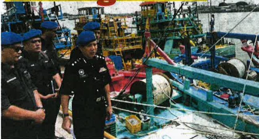
ROSMAN (kanan) melihat tujuh bot pukat jerut kelas C yang didakwa mencero boh zon menangkap ikan kira-kira lima batu nautika dari perairan laut Tanjung Karang.