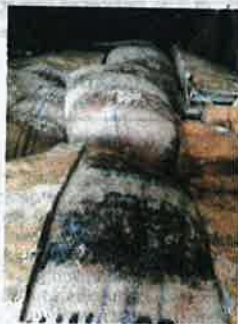
SEBAHAGIAN guni mengandungi biji koko berulat yang dirampas Maqis di Pelabuhan Tanjung Pelepas, Johor, baru-baru ini.