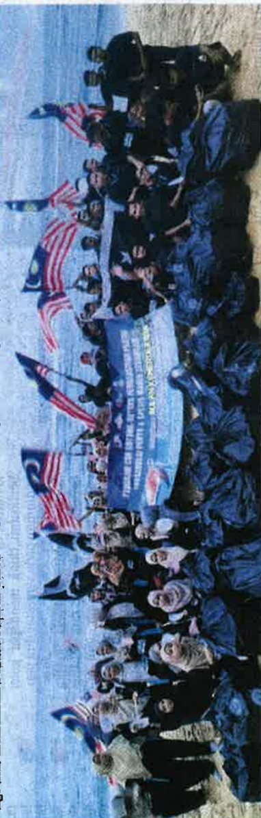
Sebanyak 345 kilogram sampah dikumpulkan oleh peserta program CSR gotong-royong di Pantai Rantau Abang, baru-baru ini.