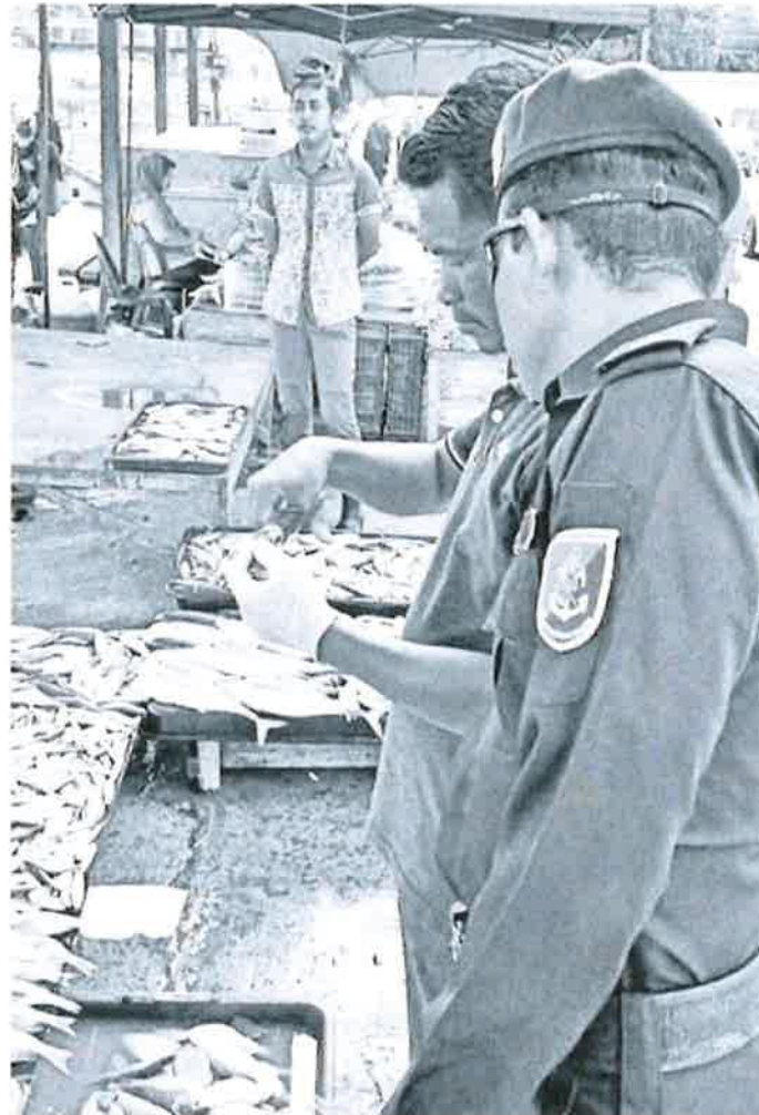
Marine police personnel with officers from the Fisheries Department examine the fish at the one of the markets during the operation on Tuesday.