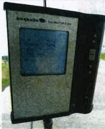
ALAT pengawal penabur kadar boleh ubah membolehkan penaburan baja dan benih mengikut keperluan.