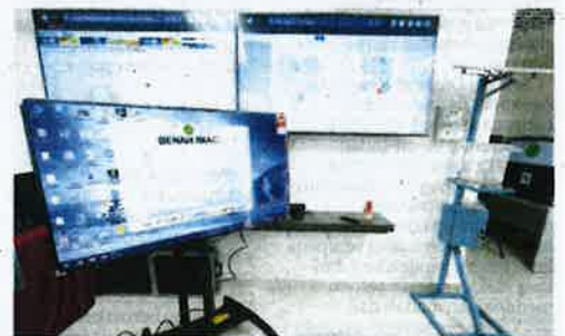
SISTEM Amaran Awal (EWS) digunakan berjaya menghalang serangan wabak benih perang di sawah.

Kini, orang muda mula melibatkan diri dalam bidang pertanian ekoran manfaat yang besar pada masa akan datang.