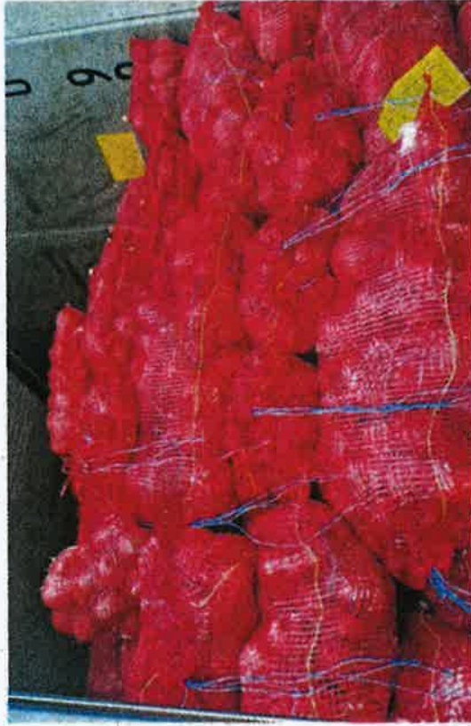
Bawang antara keluaran pertanian yang dirampas Maqis Pulau Pinang di Pengkalan Kontena Butterworth Utara semalam.

"Maqis Pulau Pinang berjaya menggagalkan cubaan membawa masuk ke luaran pertanian dari pelba-