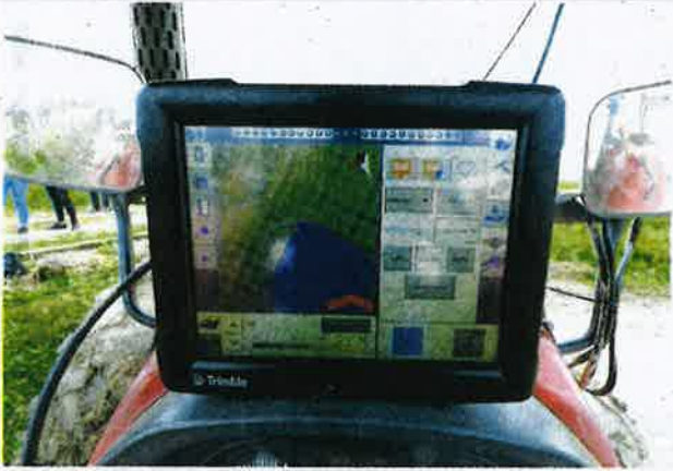
PAPARAN Integrasi FmX yang digunakan dalam proses penyediaan tanah dapat mengurangkan penggunaan tenaga buruh dan masa.