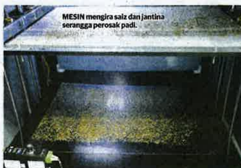
MESIN mengira saiz dan jantina serangga perosak padi.

■ Sambungan tsnin depan: Teknologi baja lebih efektif