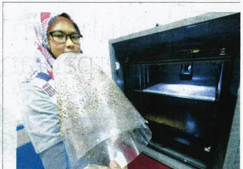
SEORANG kakitangan MARDI menunjukkan serangga benih perang sebelum dimasukkan ke dalam kotak hitam bagi tujuan pengiraan jumlah saiz dan jantina.