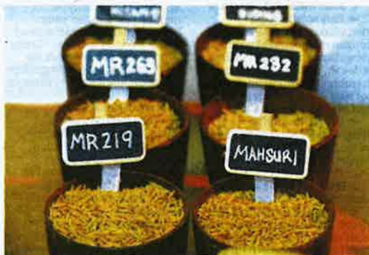
ANTARA varieti padi yang dihasilkan MARDI.

Penggunaan IoT berjaya mengatasinya menerusi penghasilan peta rawatan pembajaan secara kadar boleh ubah mengikut peta rawatan dan Sistem Amaran Awal (EWS) untuk mengesan sekali gus membantu pesawah mengawal serangan perosak dan penyakit.