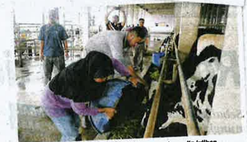
Dua pelatih Diploma Ternakan Ruminan menjalankan rutin latihan mereka di Kompleks Ruminan.