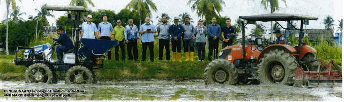
PENGUNAAN teknologi IoT mula dimanfaatkan oleh MARDI dalam mengurus sawah padi.