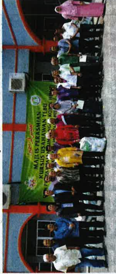
Sebahagian peserta mengikuti kursus penanaman tebu telur.