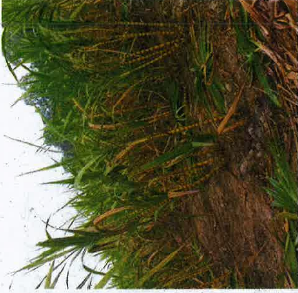
Kebun tebu telur.

"Tanaman tebu boleh di-tuai dalam tempoh lapan bulan. Tebu boleh diek-sport manakala daunnya boleh diproses untuk menjadi makanan haiwan ternakan," ujarnya.