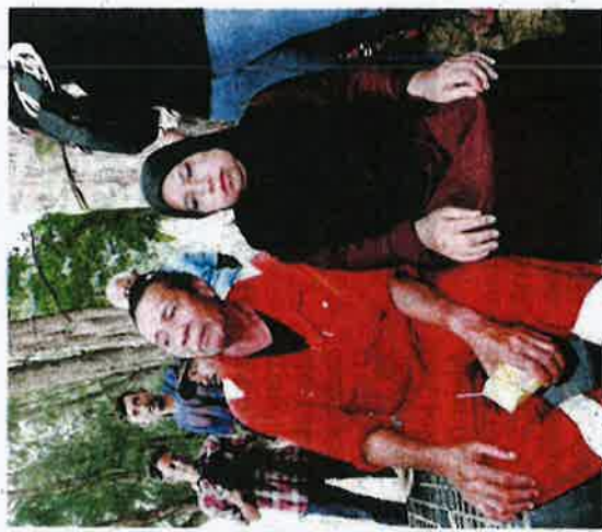
Putih ditemani isterinya ketika ditemui semalam.

pir, kehabisan minyak dan rupanya telah menghampiri perairan Indonesia.