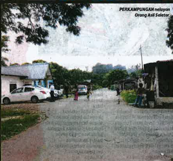
PERKAMPUNGAN nelayan Orang Asli Seletar.