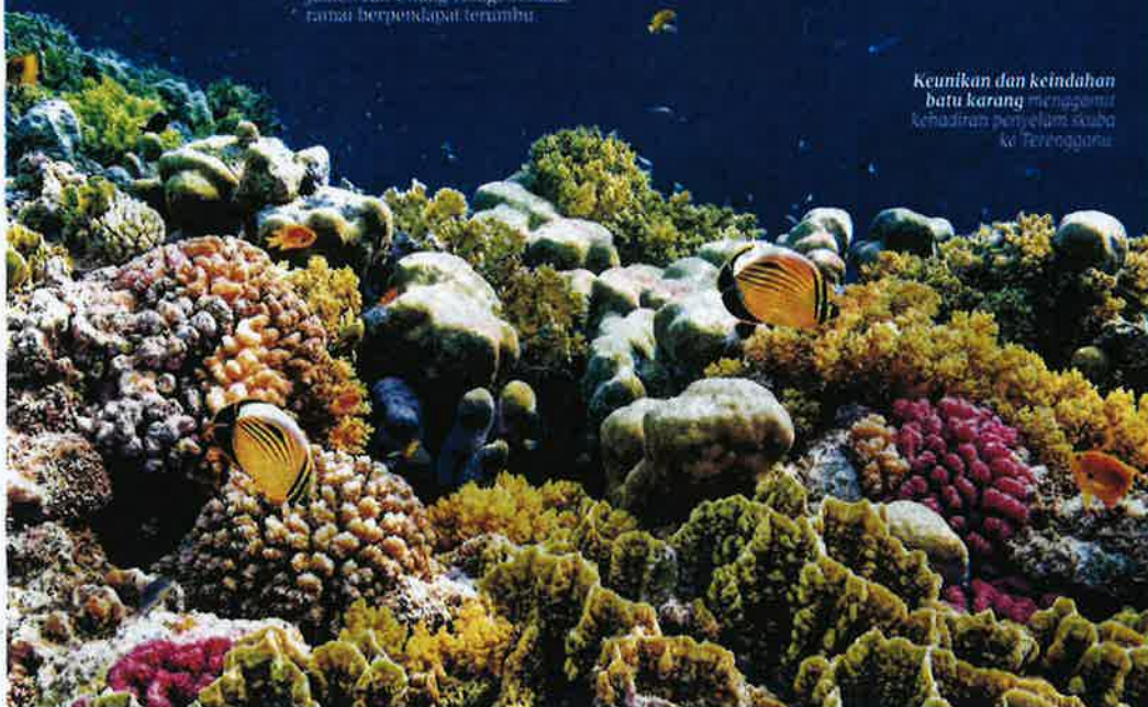
Keunikan dan keindahan batu karang merupakan kehadiran penyelam skuba ke Terengganu.