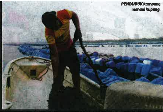
PENDUDUK kampung menuai kupang.