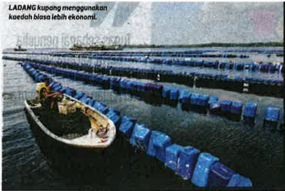
LADANG kupang menggunakan kaedah biasa lebih ekonomi.