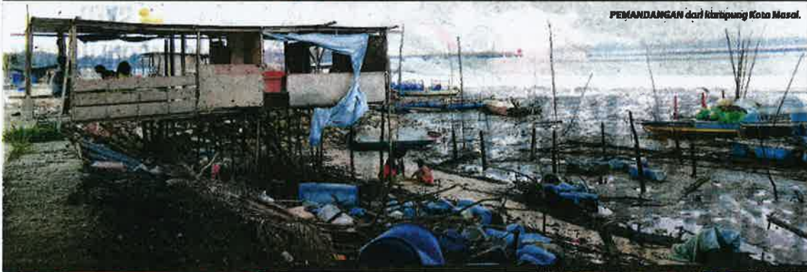
PEMANDANGAN dari kampung Kota Masai.