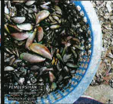
PEMBERIHAN kupang diupon mengikufun.