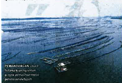
PEMANDANGAN udara ladang kupang untuk projek pemuliharaan mata pencarian nelayan