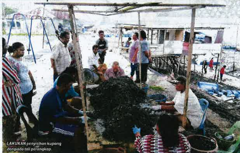
LAKUKAN penyisihan kupang daripada tali perangkap

Projek ternakan kupang inisiatif Petronas beri pendapatan lebih baik kepada nelayan Orang Asli Seletar