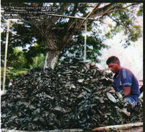
RU TIN harian biasa setiap kali air surut menerusi kerja mengambil upah mencari kupang.