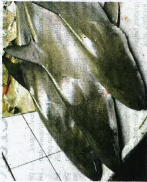
DOF menjelaskan purata pendaratan yu di perairan Malaysia daripada 2007 hingga 2017 ialah 7,027 tan metrik sahaja iaitu 0.4 peratus sekali gus menyangkal laporan Traffic .

"Purata pendaratan yu daripada 2007 hingga 2017 ialah 7,027 tan metrik sahaja iaitu 0.4 peratus dari-