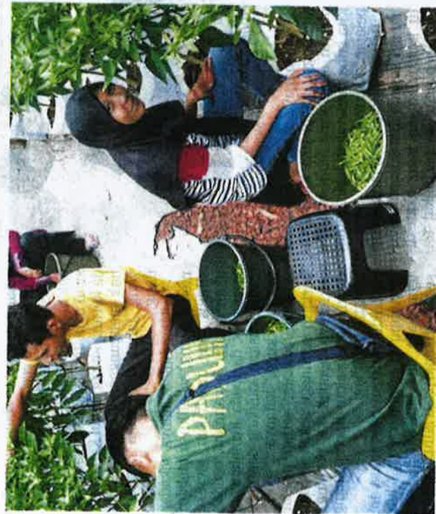
Antara anak muda yang menyertai kursus tanaman cili bara secara fertigasi di Masjid Raudatul Jannah, Bukit Katil.