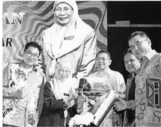
SETEM KENANGAN... Timbalan Perdana Menteri Dato Seri Dr Wan Azizah Wan Ismail bersama Menteri Pertanian dan Industri Asas Tani Dato Salahuddin Ayub (tiga, kiri) menunjukkan Setem Kenangan 125 Tahun sempena Sambutan 125 Tahun Jabatan Perkhidmatan Veterinar semalam.