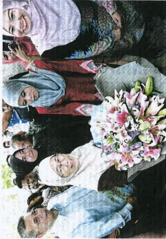
Dr Wan Azizah menerima jambangan bunga ketika hadir program Sambutan 125 Tahun Veterinar Malaysia di Alor Gajah, semalam.

"Cabaran seterusnya adalah mengangakat industri ternakan menjadi pemain penting dalam usaha ke arah transformasi ekonomi berpendapatan tinggi dan pada masa sama, memastikan perkhidmatan veterinar sentiasa relevan terhadap keperluan warga ternak, industri ternakan dan rakyat secara amnya," katanya.