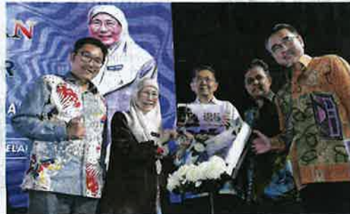
Wan Azizah (empat dari kanan) dan Salahuddin (tiga darikanan) menunjukkan Buku Coffee Table 125 tahun dan setem kenangan Sempena Sambutan 125 Tahun Perkhidmatan Veterinar di dewan konvensyen Freeport A' Famosa di simpang Ampat semalam.

Timbalan Perdana Menteri, Datuk Seri Dr Wan Azizah Wan Ismail berkata, golongan itu perlu berani ke hadapan dan lebih agresif untuk menerokai bidang baharu yang lebih