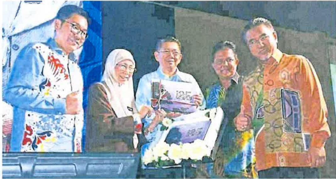
■旺阿兹莎（左2）主持開幕禮。左起為沈志勤、沙拉胡丁阿育、華查尼查慕丁及阿德里。

（马六甲26日讯）副首相拿督斯里旺阿兹莎指出，燕窝是我国极具潜能的农产品，创下今年出口额增长40%的纪录，值得大力推广。