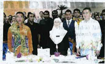
Wan Azizah (tengah), Salahuddin (kanan) dan Adly (kiri) ketika Majlis Sambutan 125 Tahun Perkhidmatan Veterinar di Dewan Konvensyen Freeport A' Famosa di Simpang Ampat, Alor Gajah semalam.

Cabaran seterusnya untuk mengangkat industri ternakan menjadi pemain penting dalam usaha ke arah transformasi ekonomi berpendapatan tinggi. - Wan Azizah