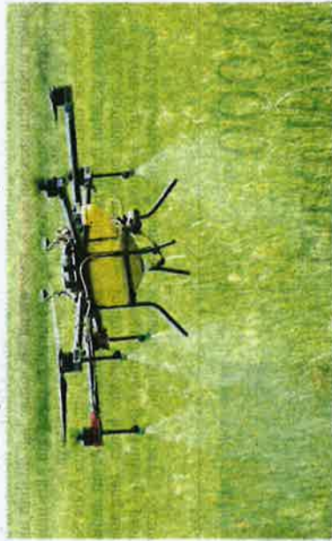
Penggunaan dron untuk kerja meracun dan membeja sawah mampu mengurangkan kira-kira 50 peratus tenaga manusia.

"Saya merancang untuk menyewa sawah lain dan turut akan menggunakan khidmat dron, saya yakin dengan menggunakan dron, lebih ramai anak muda akan berminat mengusahakan sawah daripada makan gaji," katanya yang menggunakan dron sejak Juhai lalu.