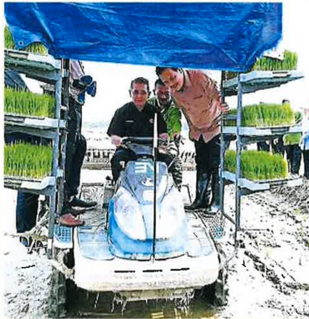
沙拉胡丁（左）今年8月视察浮罗交怡糯米种植试验区