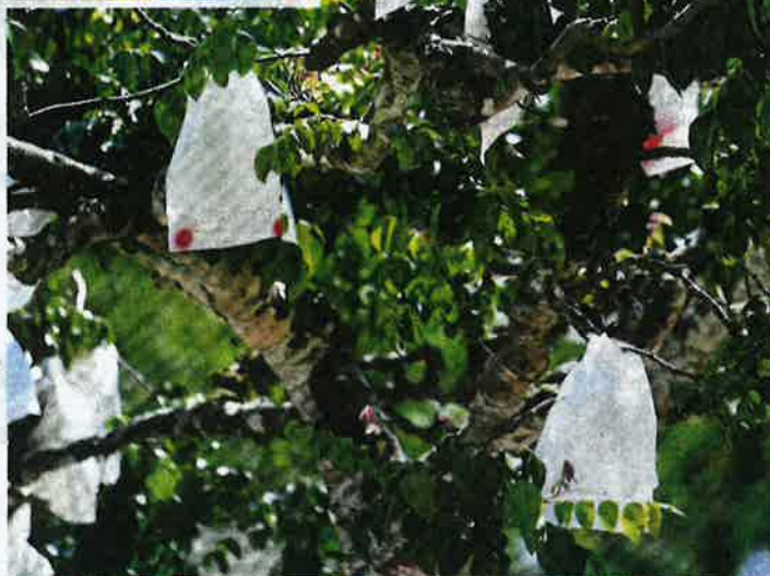
BELIMBING perlu dibungkus seawal mungkin untuk elak serangan iaat buah.