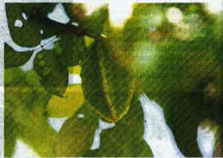
BELIMBING perlu perhatian ketika tempoh saiz besar jar.