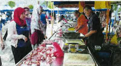
JUALAN daging tempatan segar antara yang menarik minat pengunjung.