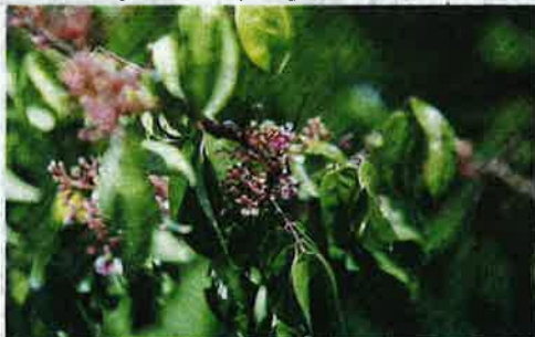
PUTIK atau bunga pokok Belimbing.