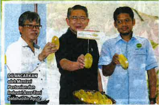
DILANCARKAN oleh Menteri Pertanian dan Industri Asas Tani Salahuddin Ayub.

terbaik seperti Bintang Mas, kita mengambil tempoh 29 tahun untuk dapatkan kualiti atau hibrid belimbing ini.