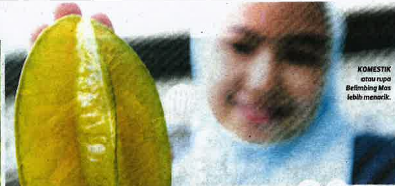
KOMESTIK atau rupa Belimbing Mas lebih menarik.