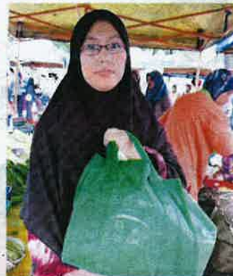
RAJA Rozlana menunjukkan barang dapur yang dibeli di Pasar Tani Mega Stadium Shah Alam.

menjadi pilihan kerana menjual pelbagai barangan di dalam satu tempat.