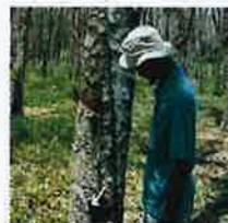
Sampai bila harga lantai getah mesti RM2.30 sekilogram?

cewaan dan kebimbangan akan nasib pesawah memandang pembentangan bajet tersebut tiada peruntukan dan bantuan khas kepada pesawah.