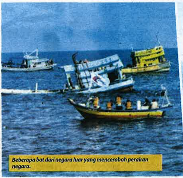
Beberapa bot dari negara luar yang menceroboh perairan negara.