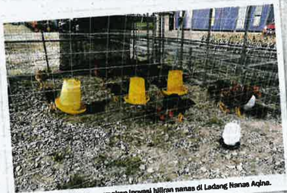
Produk ayam kampung merupakan inovasi hiliran nanas di Ladang Nanas Aqina.

"Lebih kurang 75 peratus daripada tanah pertanian kita adalah daripada kelapa sawit, jadi apabila ada masalah harga komoditi turun, ia memberi kesan kepada pekebun.