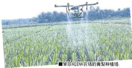
■笨珍AQINA农场的黄梨种植场