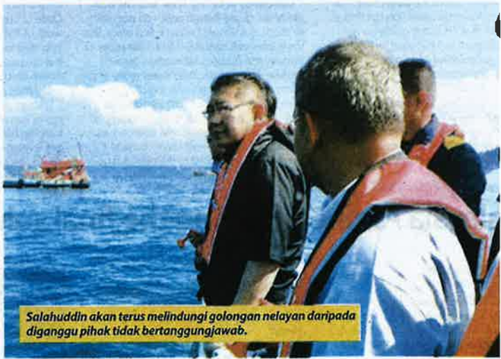
Salahuddin akan terus melindungi golongan nelayan daripada diganggu pihak tidak bertanggungjawab.