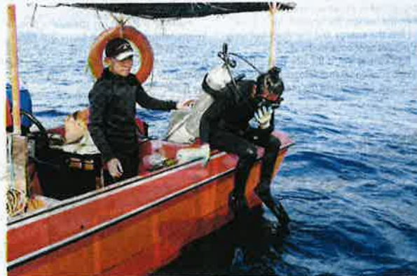
A crew, who is a qualified diver, gets ready to jump into the water.

The process from the moment a crew dives in until the trap is emptied takes 90 minutes to complete, before we make our way back to the shore.