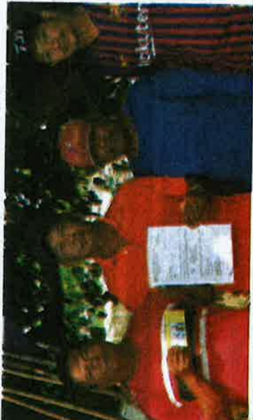
Nelayan menunjukkan borang permohonan mendapatkan lesen.

Oleh itu beliau meminta nelayan bersabar sehingga dimaklumkan perkembangan baharu terhadap pembekuan tersebut.