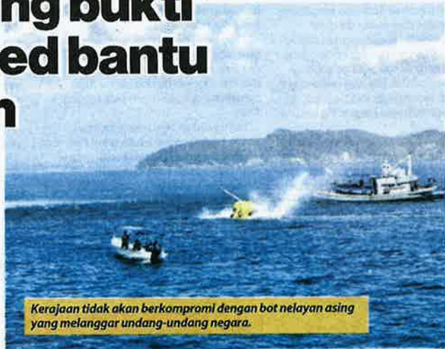
Kerajaan tidak akan berkompromi dengan bot nelayan asing yang melanggar undang-undang negara.

Melalui tindakan itu, kerajaan berharap dapat mengurangkan ketirisan bekalan ikan yang dianggarkan sebanyak RM6 bilion setahun akibat penceroohan nelayan asing.