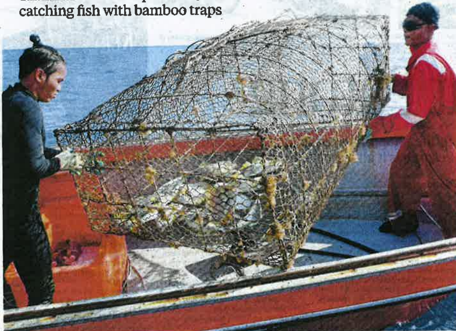
A bubu is hauled up onto the boat to reveal its catch.

Shahrul M Zain experiences catching fish with bamboo traps