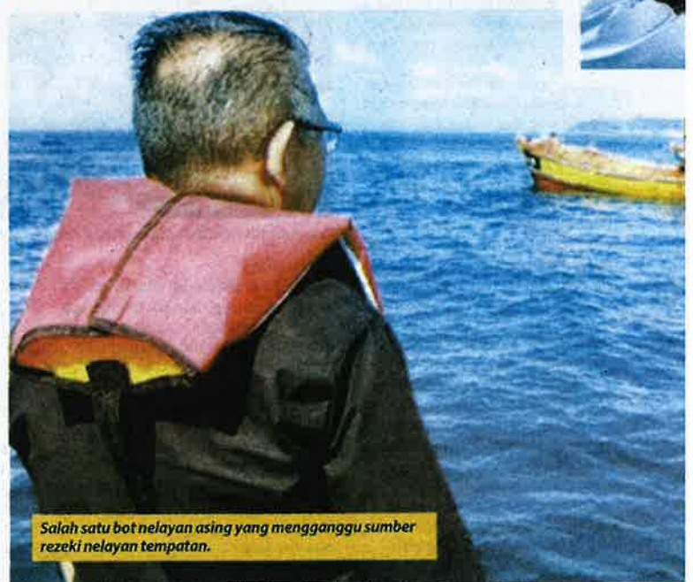
Salah satu bot nelayan asing yang mengganggu sumber rezeki nelayan tempatan.