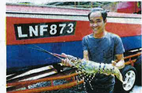
The catch of the day — an XL-sized lobster.