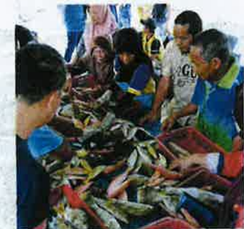
The locals don't waste any time to get the best of the day's catch.

This valuable experience with Asiran and his crew and family is organised by Fisheries Development Authority of Malaysia. The Labuan director Pada Anak Bijo welcomed us that morning at Kampung Pohon Batu. shahrulzaman@mediaprima.com.my