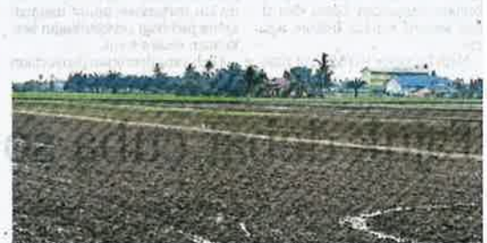
Kerja penanaman padi sepatutnya bermula bulan ini.

tari di KBJS dan masing-masing 200 tan di Syarikat Seri Merbok serta Syarikat Pertama Padi," katanya ketika dihubungi.