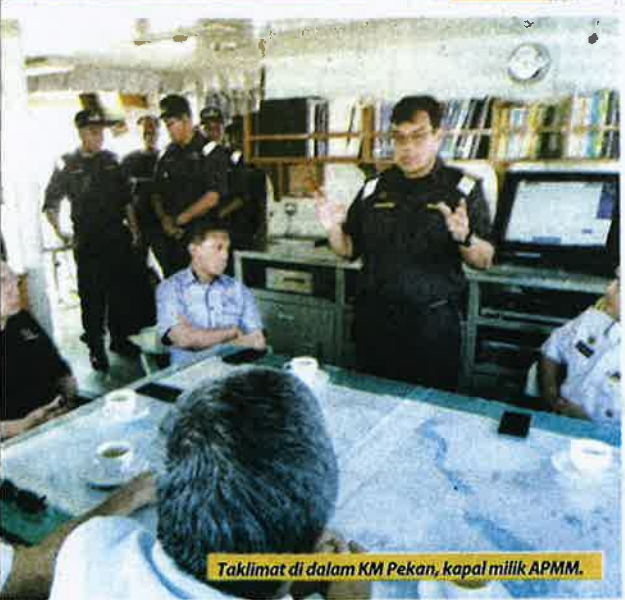
Taklimat di dalam KM Pekan, kapal milik APMM.