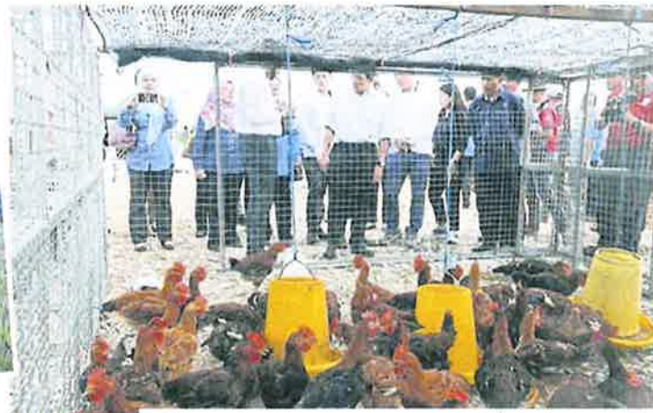
■业者使用黄梨酵素作为鸡只饲料，养出「黄梨鸡」。