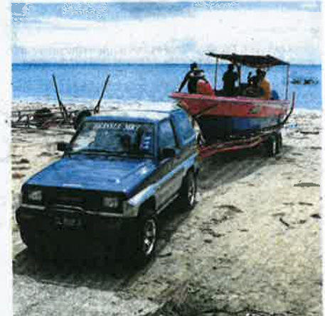
Asiran's boat is towed by a four-wheel-drive to a fish market at Kampung Lubok Temiang.