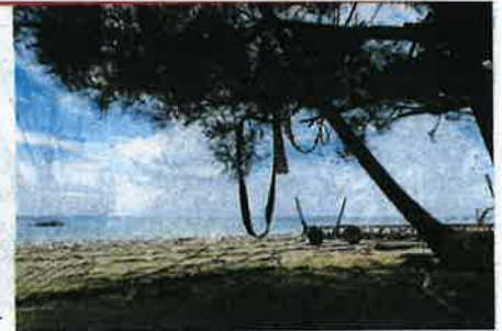
The scenic setting of Kampung Pohon Batu.

Within 30 minutes, everything on his table is all gone. But the good news is that my lobster is put aside for our dinner.