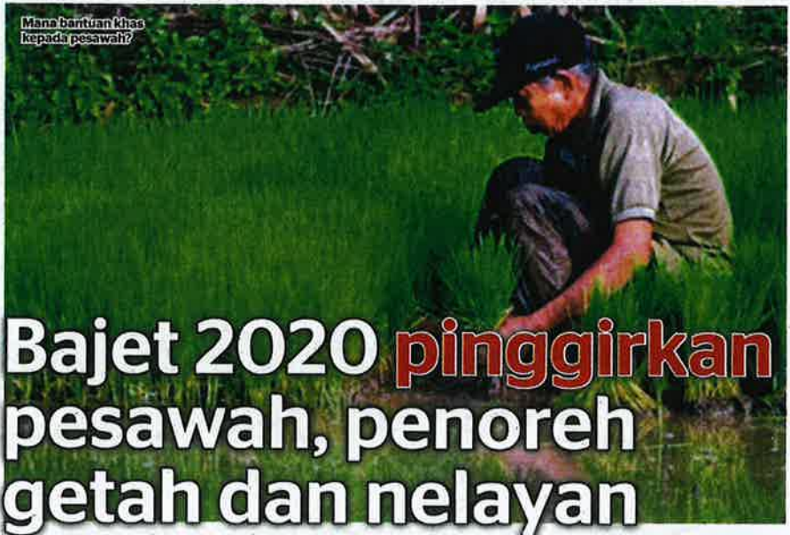
Mana bantuan khas kepada pesawah?

Dengan itu, pelbagai pihak wajar melahirkan keke-