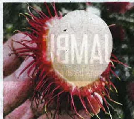
MEMPUYAI isi yang tebal, manis dan lekang serta mempunyai aroma ketara.