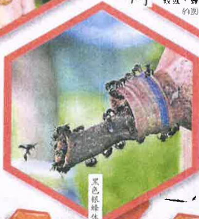
黑色银蜂体积小，长相很像苍蝇