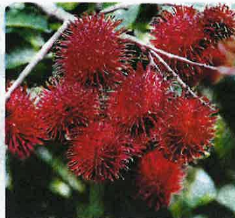
PENYELIDIKAN klon rambutan dilakukan sejak 1980-an.

Mutiara Merah mempunyai penampilan luaran yang baik, tekstur isi yang kenyal dan kering, aroma buah yang sederhana dan lekang.