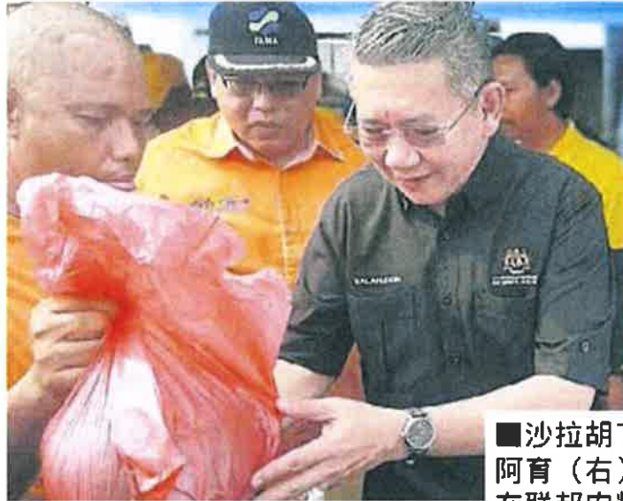
■沙拉胡丁阿育（右）在联邦农粮销售局的摊位帮忙卖西瓜。

（笨珍19日讯）农业及农基工业部长拿督斯里沙拉胡丁阿育指出，该部将扩大“关心人民市集（Bazar Peduli Rakyat）”，并推广至全国各地，尤其在乡区。