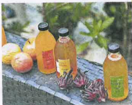
自创的水果红茶菌 (Kombucha)