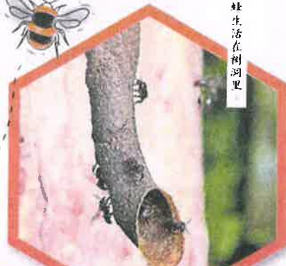
银蜂生活在树洞里