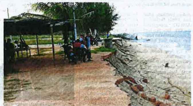
KEKESAN hakisan hampir dengan gerai di Pantai Pengkalan Maras.

Menurut beliau, pihaknya akan membangkitkan isu hakisan pada Sidang Dewan Undangan Negeri bulan depan selain isu perairan cetek di kawasan tambak pemecah ombak di Pantai Tanjung Gelam, Mengabang Telipot yang menyokong nelayan mendaratkan bot nelayan.