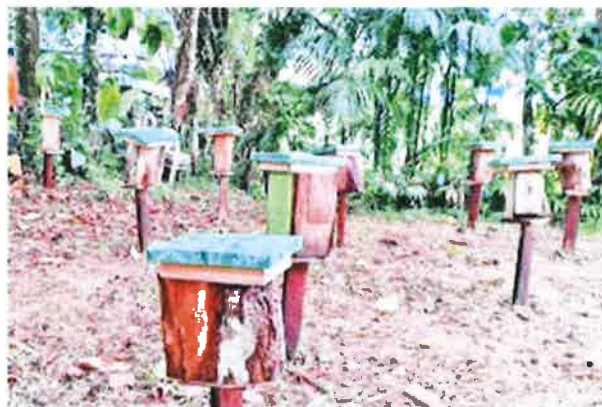
Loans totalling RM2 million have been approved for about 200 people in Sabah to participate in kelulut honey projects in 10 villages in Membakut, eight in Bongawan and four in Kimanis.

A total of 18 youths from Kampung Bambangan are