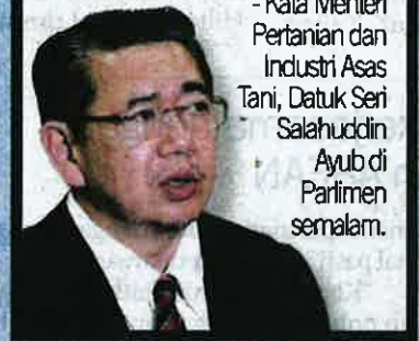
- Kata Menteri Pertanian dan Industri Asas Tani, Datuk Seri Salahuddin Ayub di Parlimen semalam.

“Anggaran ketirisan atau nilai yang hilang akibat pencerobohan nelayan asing lebih kurang RM5 bilion setahun. Kita mesti tingkatkan aset dan penguatkuasaan.”