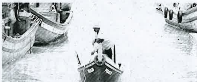
Kenaikan elaun sara hidup golongan nelayan daripada RM200 kepada RM250 sebulan adalah bukti keprihatinan kerajaan kepada rakyat bawahan.

Bagi usahawan Bumiputera pula, geran sebanyak RM445 juta disediakan untuk mengukuhkan akses kepada pembiayaan, penyediaan premis perniagaan dan