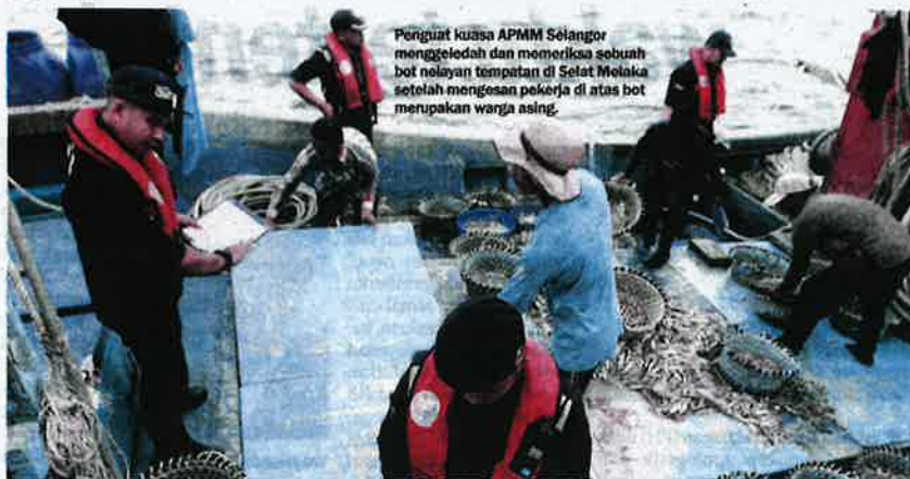
Penguat kuasa APMM Selangor menggeledah dan memeriksa sebuah bot nelayan tempatan di Selat Melaka setelah mengesan pekerja di atas bot merupakan warga asing.

Wartawan Sinar Siasat berpeluang mengikuti pelayaran selama lima hari bersama kapal operasi APMM Selangor, KM Bagan Datuk baru-baru ini untuk mendedahkan tentang tugas berat pihak berkuasa mengawal samudera negara.