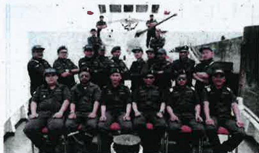
Pegawai dan anggota KM Bagan Datuk yang mengawal perairan negara.