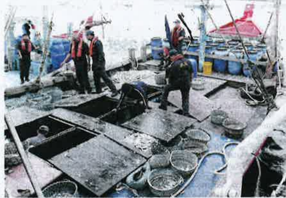
Penguat kuasa APMM Selangor mengoleleh kotak simpanan ikan dalam sebuah bot di tahanan.

bawah penguatkuasaan Seksyen 27 Akta Perikanan Negara 1985. - Bernama