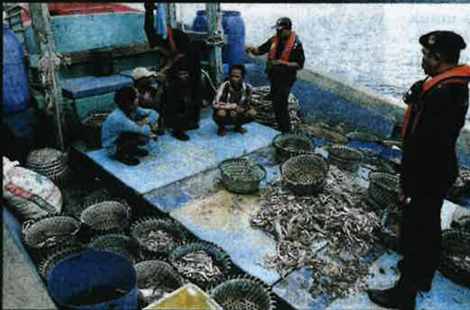
Anggota APMM menahan sebuah bot tempatan yang menggunakan nelayan asing untuk menangkap ikan di perairan Selat Melaka baru-baru ini.