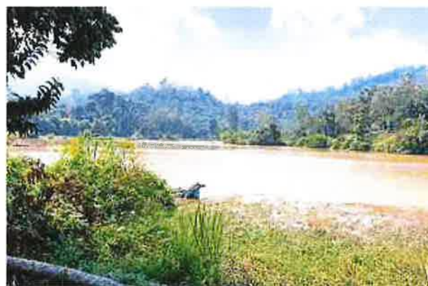
KAWASAN paya di Tobek Godang Kuala Pilah akan dibangunkan semula sebagai estet ikan.

Katanya seperti di Pahang yang mempunyai estet ikan, ia membuktikan usaha berkenaan berhasil selepas Jabatan Perikanan berjaya mengadakan pesta menangkap ikan bersama komuniti.