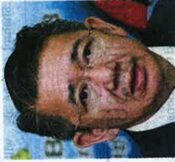
Datuk Salahuddin Ayub

The allocation will include basic facilities, such as refrigerated storage and stalls for small- and medium-sized enterprises.